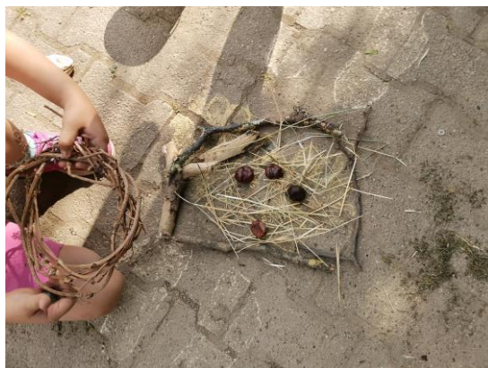
Slika 64. „Kućica za ptičice“.

Djevojčica H. (6 godina) izrađuje kućicu za ptičice ( Slika 64. ). Pridružuje joj se djevojčica I. M. (6 godina) i govori: „Stavit ću unutra kestene. Ti kesteni mogu biti ptičice u šumi“.