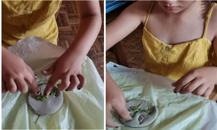
Slika 112. i 113. Proces izrade.