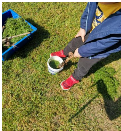
Slika 21. Pravljenje boje od sakupljene trave.

A. P. (4 godine): „Teta možeš nam dati vode i onda ćemo napraviti zelenu boju od trave.”