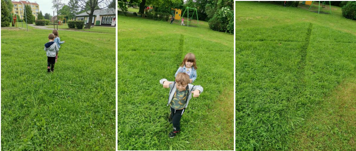
Slika. 18., 19. i 20. Linija nastala hodanjem po uzoru na umjetničko djelo Richarda Longa.

Nakon što smo promatrali umjetnička djela preko reprodukcija krećemo u prvu aktivnost u prirodnom okruženju. Prva aktivnost u prirodnom okruženju bila je inspirirana upravo djelima Richarda Longa te su djeca hodajući kroz livadu ostavljala svoj trag ( Slike 18, 19 i 20 ).