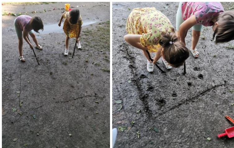
Slika 46. i 47. Crtanje kvadrata i kopanje rupa u koje će posaditi prethodno prikupljene materijale.

Nakon što su djevojčice izradile stazu dio mlađe djece prilazi i želi hodati po stazi. Djevojčice preusmjeravaju aktivnost u izradu vrta kako bi „spasile“ materijale koji čine stazu. I. M. (6 godina) uzima granu i crta „kvadrat“. Na pitanje što će to biti odgovara: „Posadit ćemo vrt, jer će sve to što smo ubrali možda ponovno narasti“. Poziva djevojčicu M. K. (5 godina i 8 mjeseci) da joj se pridruži, a djevojčica joj govori: „Baš budemo vidjeli hoće opet narasti. Sutra kad dođemo u vrtić vidjet ćemo je li opet naraslo. Idemo brzo sve posaditi jer će nam sve uništiti s biciklima“.