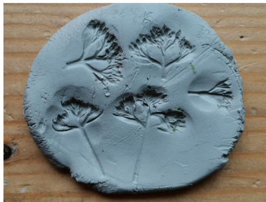
Slika 114. I. M. (6 godina): „Otisak cvijeća“.