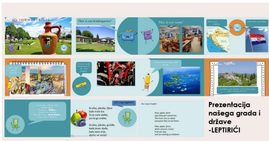
Slika 9. Prezentacija skupine „Leptirići“

Zbog slabe internetske veze u vrtićima, svi video pozivi održani su u zgradi fakulteta, pa su tako „Leptirići“ i „Kockice“ u vrijeme poziva boravili na fakultetu, što je za njih predstavljalo poseban doživljaj.