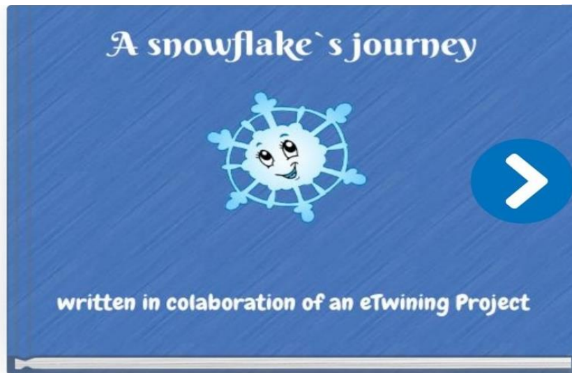
"A snowflake's journey"

Odgojiteljica iz Grčke predložila je izradu slikovnice u aplikaciji Storyjumper (slika 15.). Slikovnica prikazuje put jedne snježne pahuljice koja obilazi tri partnerske zemlje koje su sudjelovale u ovom projektu. Prvo obilazi Rumunjsku, gdje posjećuje grad Temišvar (rum. Timișoara), zatim dolazi u Grčku i mjesto Agios Kirykos (grč. Άγιος Κήρυκος) na otoku Ikariau i na kraju posjeti Hrvatsku i Petrinju (slika 16). Slikovnicu su izradile odgojiteljice i profesorce, a sudjelovala su i sama djeca tako što su nacrtali neke od scena te znamenitosti svojih zemalja i gradova u kojima žive. Njihovi su crteži uklopljeni u cijelu priču. Ponovno, ovo je potvrda podataka istraživanja Europske komisije (Mouratoglou i sur., 2022). Djeca koja sudjeluju u eTwinning projektima rade na međusobnoj suradnji, više se uključuju u aktivnosti, grade bolji odnos sa svojim odgojiteljima te razvijaju autonomiju i uče kako preuzeti odgovornost.