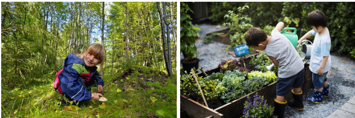
Slika 6. Primjer aktivnosti na otvorenom u vrtićima.

Primjeri vrtićkih aktivnosti na otvorenom vezanih uz načela waldorfske pedagogije, točnije uz istraživanje okoline i praktičan rad u obliku vrtlarenja, nalaze se na Slici 6.