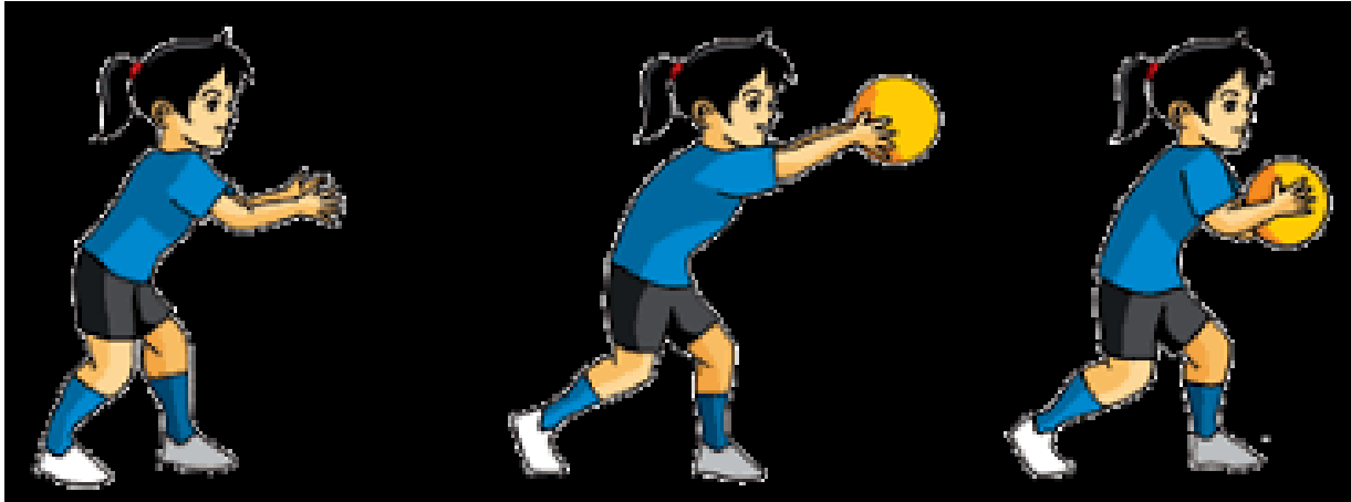
Slika 3. Dodavanje lopte (Antić, 2018)