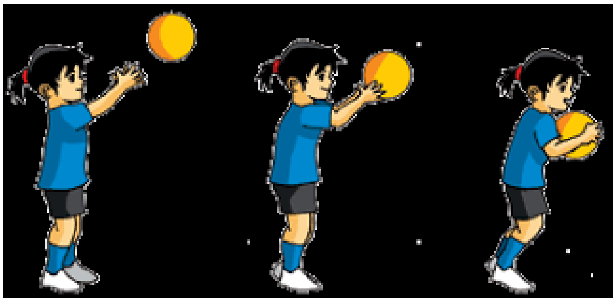
Slika 1. Držanje lopte (Antić, 2018)