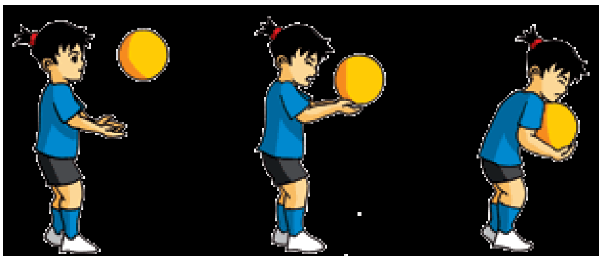
Slika 2. Hvatanje lopte (Antić, 2018)