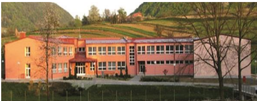
Slika 2. Osnovna škola Izidora Poljaka Višnjica

Vrata nove osnovne škole koja djeluje i danas otvorena su 18. svibnja 2001. godine, a s dodatnim učeničkim prostorima i sportskom dvoranom dograđena je 2007. godine. Od tada se nastava u njoj odvija u jednoj (jutarnjoj) smjeni.