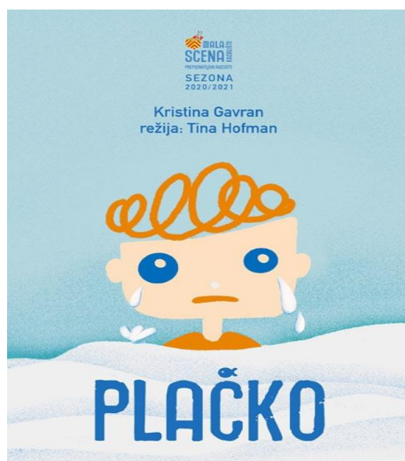
Slika 1. plakat za predstavu Plačko

Predstava se sastoji od sedam scena kroz koje pratimo dječaka Plačka koji ima supermoć-plakanje no, on već toliko dugo plače da ga više nitko ne zove pravim imenom niti ga se on više sjeća pa kroz predstavu pokušava pronaći svoje izgubljeno ime. U pronalasku imena pomažu mu Zlatna ribica, Profesorica Suzić, Krokodil i Mudri Luk. Scenografija je vrlo jednostavna kuhinja u kojoj zapravo dječak Plačko kreće na putovanje za svojim izgubljenim imenom. Likovi koje susreće su stvari iz njegove kuhinje koje on oživljava u svojoj mašti. Predstava se bavi emocijama i kako se s njima nositi te kako ih izražavati. Likovi Majka, Zlatna ribica, Profesorica Suzić, Krokodil i Mudri Luk pjevaju u rimi i svakom pojavom na sceni daju pouku o emocijama („Prije plakanja duboko udahni i pokušaj riječima opisati što te muči“). Kroz predstavu se spominju dani u tjednu, brojanje, abeceda i kruženje vode u prirodi, pa samim time osim emocija, djeci (gledateljima) približava i navedene stvari. Dječak Plačko na kraju pronalazi svoje ime te je kroz svoju potragu naučio da ima i drugih emocija te da i odrasli smiju plakati, ali se uvijek trebamo truditi riječima objasniti kako se osjećamo.