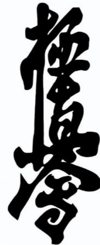
Slika 2 Kanji- znak za kyokushin karate