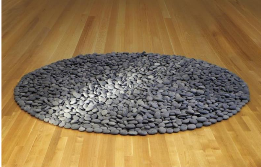
Slika 2. Richard Long, Krug oceanskog kamenja, 1990.