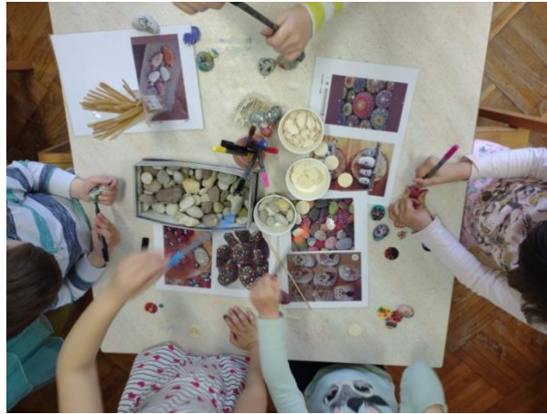
Slika 20. Crtanje po kamenju

mandale) što ih je posebno motiviralo i usmjerilo u aktivnosti. Koristili su različite boje, linije, oblike ( Slike 21. i 22. ). Jedna djevojčica, iznimnog interesa, oslikala je niz drvenih oblutaka i kamenja koristeći cijeli spektar boja ( Slika 22. ).