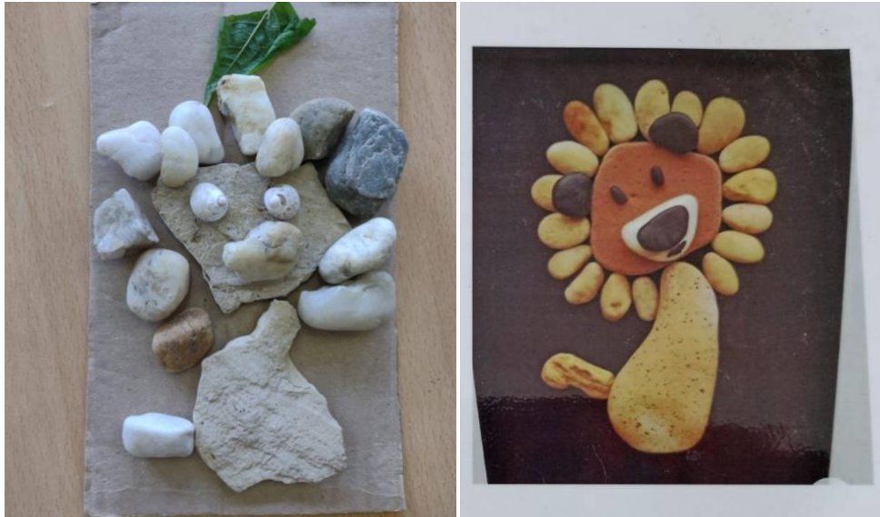
Slike 15. i 16. „Kameni lavić“ po inspiraciji plastificiranog primjerka i plastificirani primjerak

inspiraciju. Koristila je druge materijale koji su joj više odgovarali. Primjerice, za lavlje oči nije postavila kamenčiće, već morske pužiće, a „griva“ ima sasvim drugačiji „karakter“. Postavila je i list za ukras na glavi.