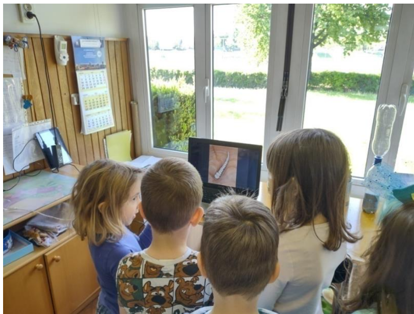
Slika 9. Proučavanje videozapisa