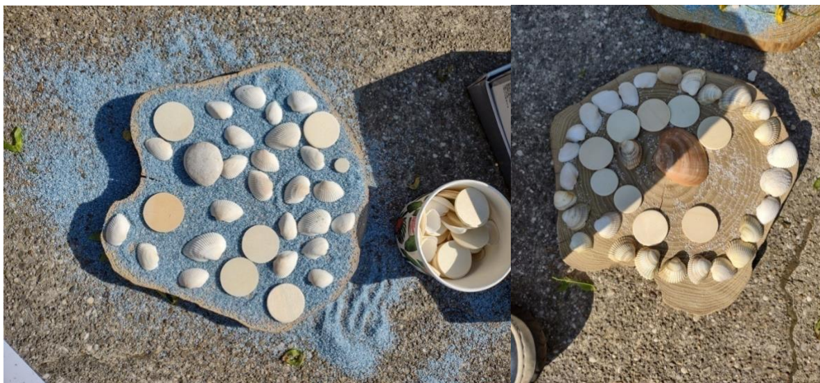
Slike 25. i 26. Land art skulpture na drvenim podlošcima