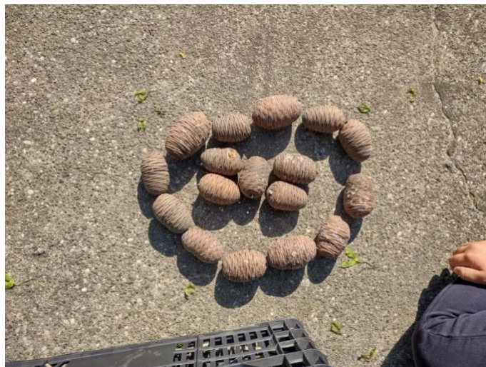
Slika 33. „Mandala“

sova“. To je sve potrajalo „satima“ . U navratima su se vraćale na svoja djela i dodavale još detalja.