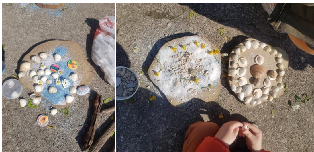
Slike 27. i 28. Land art skulpture na drvenim podlošcima

Na ovih pet radova ( Slika 25., 26., 27. i 28. ) djevojčice su se potrudile napraviti more i plažu, koristeći različite školjkice, oblutke, cvjetice, plavi pijesak i ostale predmete pronađene u dvorištu. Na nekim se radovima nazire i spirala, odnosno mandala po primjeru Nikole Fallera koji inače stvara spirale na morskim pješčanim plažama ( Slika 26. i 28. ).