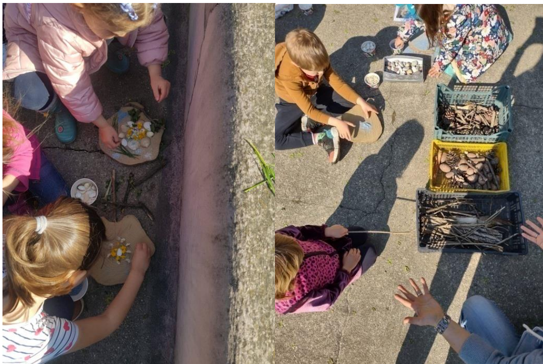
Slike 23. i 24. Dječja land art djela u procesu stvaranja

Djeca su ideju slobodnog izražavanja putem različitih plodova i tvorevina iz prirode prihvatili i prigrlili s velikim entuzijazmom, voljom i kreativnošću, a to se može vidjeti i po kvalitetnim radovima napravljenim uz mnogo strpljenja, motivacije i truda radeći „satima“ (Slike 23. i 24.).