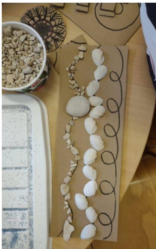
Slika 12. Slaganje plodova po iscrtanim linijama