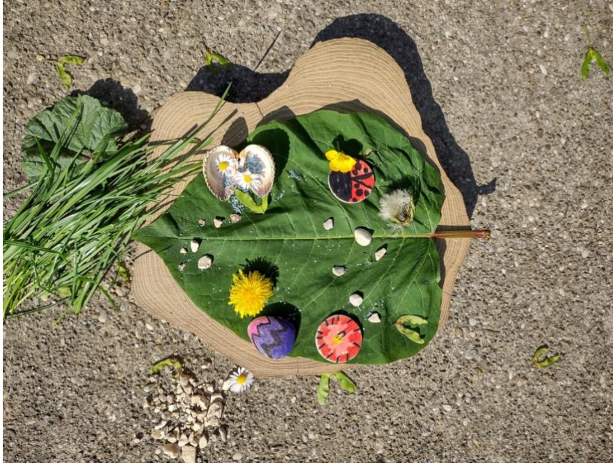
Slika 29. Land art skulptura na drvenom podlošku

Jedna likovno nadarena djevojčica na ovom je radu iskoristila svu svoju kreativnost i volju te uložila velik trud i vrijeme. U isto vrijeme, moglo se vidjeti kako uživa u kombiniranju različitih šarenih materijala postavljajući ih u skladan odnos. Uključila je skoro sve materijale, iz dvorišta i iz vrtića. Posebno je istaknula detalj sa školjkicom u lijevom gornjem dijelu rada ( Slika 29. ). U otvorenu školjkicu „pospremila“ je tratinčice s plavim pijeskom što ukazuje na to kako je na vrlo kreativan način pazila na detalje i unesla se u dubinu svog rada.