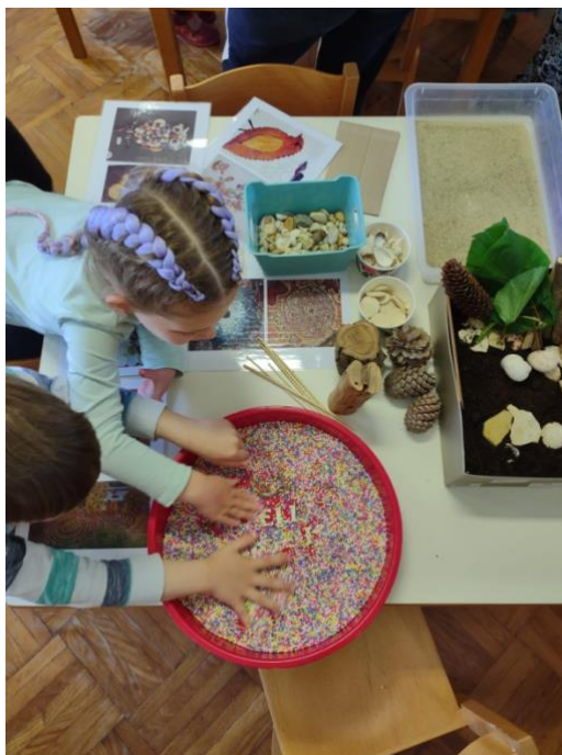
Slika 14. Kutije ispunjene zemljom, pijeskom i stiropornim kuglicama u radu s djecom

U sljedećim su se poticajima (kutije sa zemljom, pijeskom i šarenim kuglicama) djeca zadržala duže vrijeme zbog raznolikih materijala i sadržaja. Svidjela im se kutija sa zemljom kao imitacija vrta zvana „Mali vrt“. Pijesak im je također bio interesantan. Po njemu su poput spomenutih land art umjetnika (Nikola Faller) prstićima iscrtavali razne oblike, mandale i spirale dodavajući ostale plodove. No, najviše su bili zadivljeni sitnim šarenim stiropornim kuglicama (Slika 14.). One svojom minijaturnom veličinom na opip djeluju poput masaže (antistresno), a različitih boja djeluju vizualno primamljivo, poput šarene mase za koju se stalno dobiva poriv za diranjem. To su djeca oduševljeno prihvatila, a upravo je poslužilo kao senzomotoričko sredstvo za razvijanje fine motorike prstiju i ruke (upravljanje sitnim predmetima) tragom stvarajući linije i krugove ( land art motive). Dodavali su i ostale ponuđene predmete iz prirode i u njih ubacivali kuglice (unutar šupljine morskih puževa).