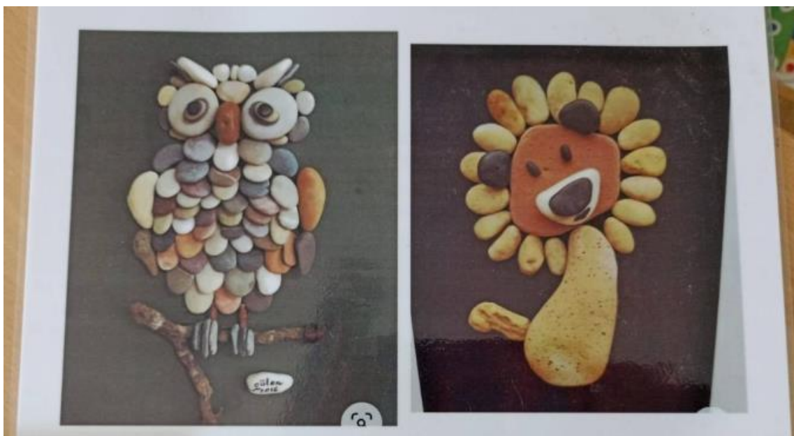
Slika 7. Plastificirane slike i primjerci land art umjetničkih djela