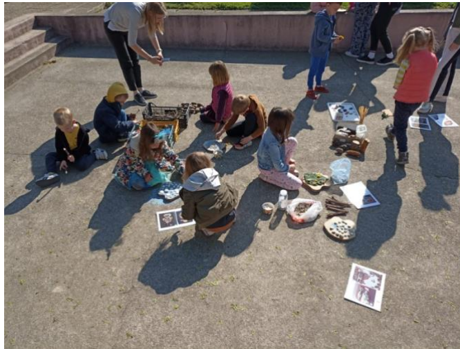
Slika 22. Land art aktivnost u vrtičkom dvorištu

Djeca su ideju slobodnog izražavanja putem različitih plodova i tvorevina iz prirode prihvatili i prigrlili s velikim entuzijazmom, voljom i kreativnošću, a to se može vidjeti i po kvalitetnim radovima napravljenim uz mnogo strpljenja, motivacije i truda radeći „satima“ (Slike 23. i 24.).