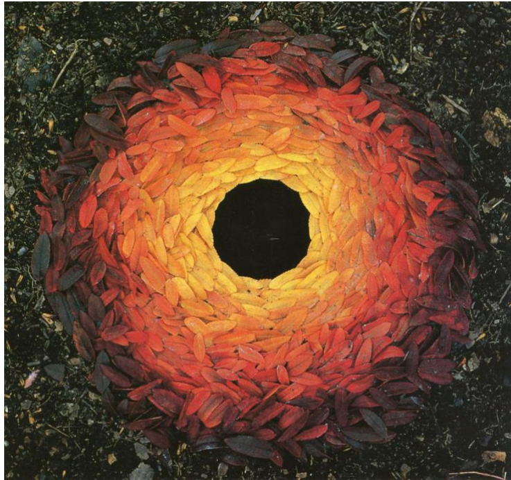
Slika 3. Andy Goldsworthy, Mandala (2013)

Turković (2002.) nadodaje kako se Goldsworthy općenito koristi kamenim vapnencom, riječnim kamenjem, pijeskom, zemljom i glinom kako bi izrazio uvjerenje o jednakom značaju mjesta na kojem stvara priroda i onoga na kojem stvara umjetnik.