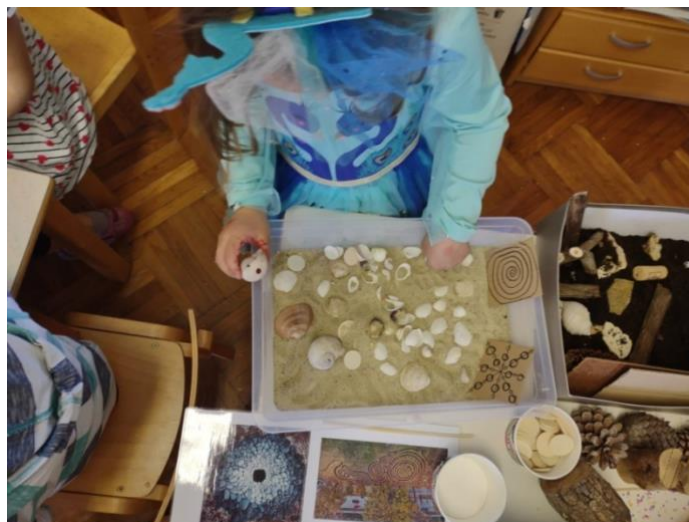
Slika 17. „Mala plaža“