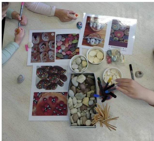
Slika 8. Plastificirani primjerci u radu s djecom