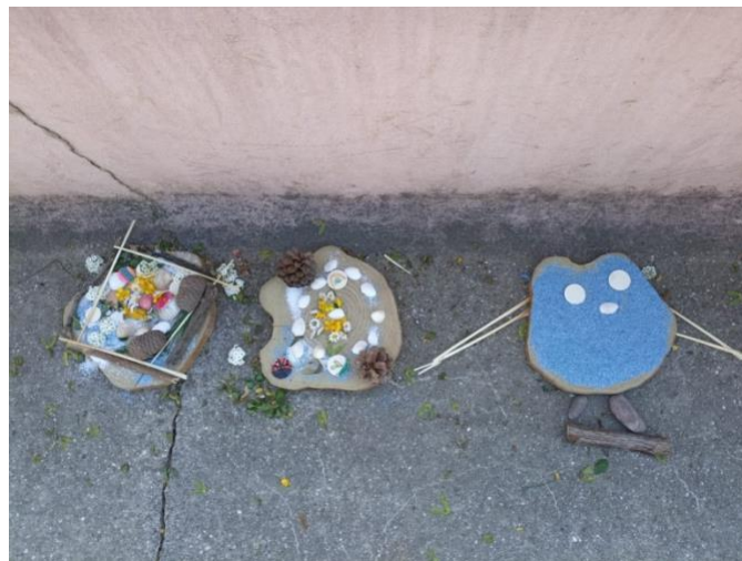
Slika 32. „Vilinske kućice“ i „Plava sova“

Na ovom je radu vidljiva bitna motivacija putem plastificirane fotografije ( Slike 30. i 31. ). Zanimljivo je kako nijedan materijal nije isti, ni korišten na jednak način. Ovdje dominira zemlja iz „Malog vrta“, školjkice, drveni oblutci, kamenje i grančice. To je pet materijala više od materijala na fotografiji primjerka. Tako je izvedena izvrsna ideja i napravljena originalna „Sova“.