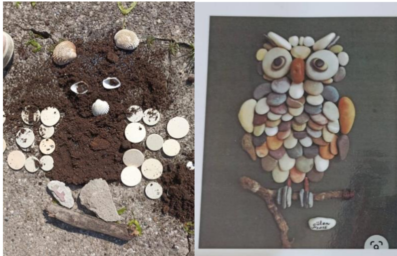
Slika 30. i 31. „Sova“ i plastificirani primjerak

Na ovom je radu vidljiva bitna motivacija putem plastificirane fotografije ( Slike 30. i 31. ). Zanimljivo je kako nijedan materijal nije isti, ni korišten na jednak način. Ovdje dominira zemlja iz „Malog vrta“, školjkice, drveni oblutci, kamenje i grančice. To je pet materijala više od materijala na fotografiji primjerka. Tako je izvedena izvrsna ideja i napravljena originalna „Sova“.