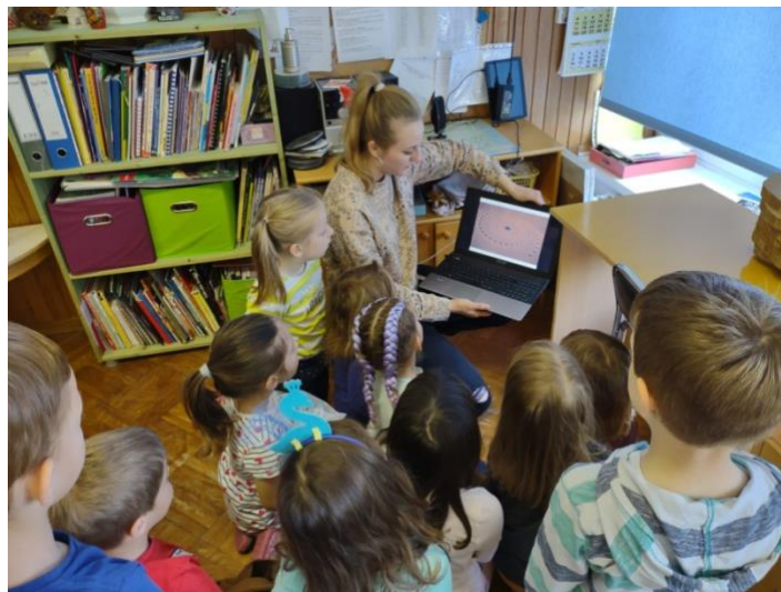
Slika 19. Vođenje prezentacije

Prezentaciju smo pogledali na kraju prije samog izlaska na dvorište. To se ispostavilo kao dobar poticaj i motivacija za djecu prije druge glavne prostorno-plastičke aktivnosti. Dobili su inspiraciju. Djeca su zainteresirano promatrali umjetnička djela land art umjetnika. Postavljala sam im razna navedena pitanja: „Što prikazuje slika? Što mislite kako je umjetnik to uspio i čime? Kako bi mi to mogli slično napraviti u dvorištu?“ Mnoga su djeca surađivala na način da su opisivala djelo i razmišljala na koji je način umjetnik uspio napraviti svoje djelo.