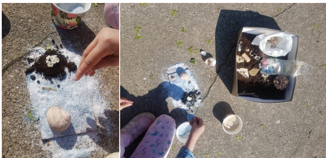
Slike 34. i 35. „Otočić s cvijećem na oceanu“

Dječakova vrlo simetrična „Mandala“ od češera motivirana je od strane umjetničkih djela Andyja Goldsworthyja ( Slika 33. ).