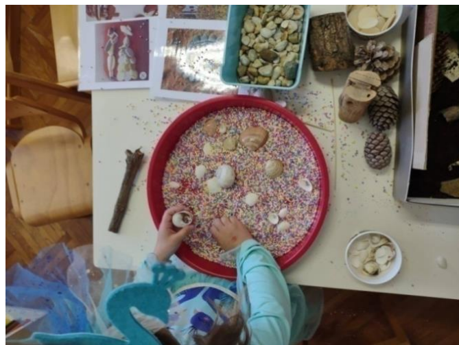
Slika 18. „Šareno čarobno more“

U posudu sa šarenim stiropornim kuglicama, djeca su počela dodavati i ostale materijale i prirodne tvorevine. Jedna je djevojčica složila svoje „Šareno čarobno more“ sa svim morskim detaljima (Slika 18.) što je bio uspješan poticaj za land art umjetnost i upoznavanje slobodnog „karaktera“ te umjetnosti.