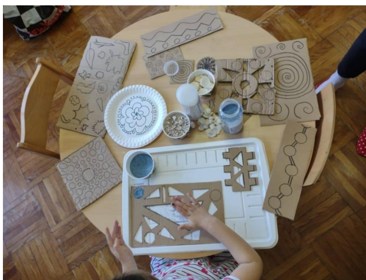
Slika 13. Stvaranje otiska