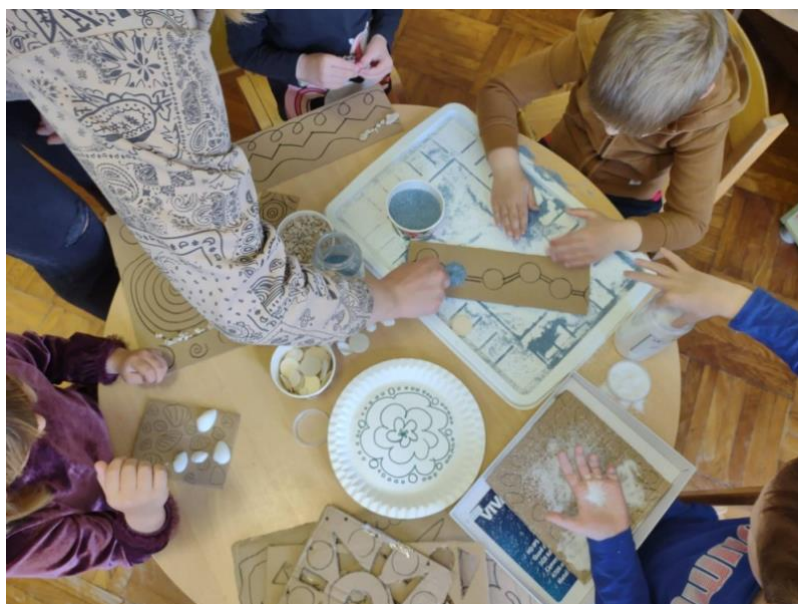
Slika10. Korištenje kartonskih matrica u radu s djecom