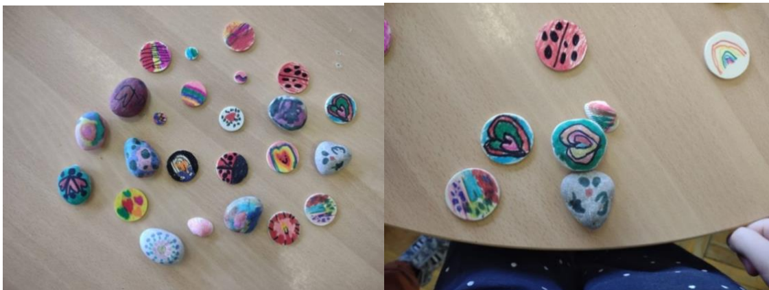
Slika 21. i 22. Ukrašeno kamenje

Na prikazanim radovima ( Slike 21. i 22. ), svako je dijete iznijelo vlastite motive, osjećaje i uspomene. Djevojčice su više koristile motive srca, duga i bubamara koristeći nježne boje. Dječaci su crtali karikature, krugove i razne linije i crte, koristeći jarke i konkretnije boje. Jedna je djevojčica napravila cijeli niz ocrtanih kamenčića, školjaka i drvenih oblutaka te izjavila da je to za cijelu njenu obitelj, „za svakog po jedan mali dar“.