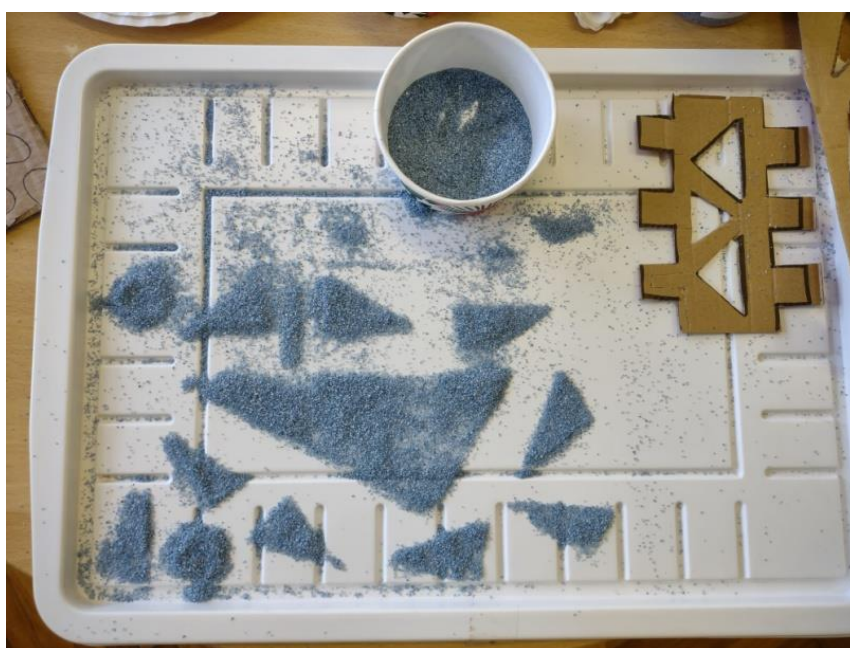
Slika 11. Otisak pijeska: „Brodovi“