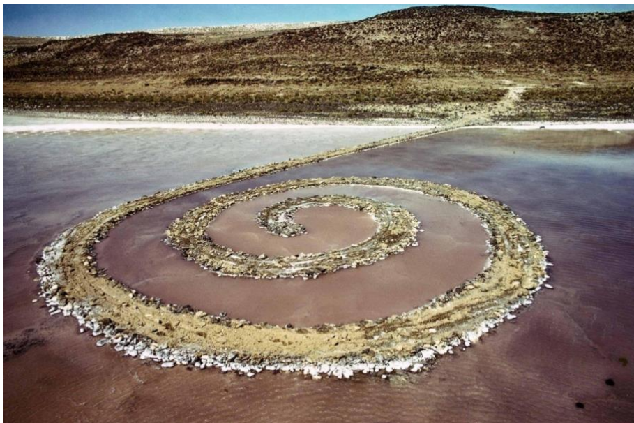
Slika 1. Robert Smithson, Spiralni Jetty (1969. - 1970.)

Kao pisac, Smithson se iskazao i u esejima o djelu na Great Salt Lakeu koji su isto djelo, Spiralni Jetty , učinili najromantičnijim i najpoznatijim land art djelom u prirodi. Svoj je rad opisao kao vrtlog koji se ne širi u sve većem krugu, nego se zamata prema unutra: „tvar koja se urušava u jezero, odražena u oblik spirale“. U narednim godinama Spiralni Jetty s vremena na vrijeme nestaje i ponovno se pojavljuje u promjenjivom vodostaju jezera Great Salt Lake, a današnji jedini dostupni uvid u djelo jedino su fotografije i filmovi (Arnason, 2009: 614).