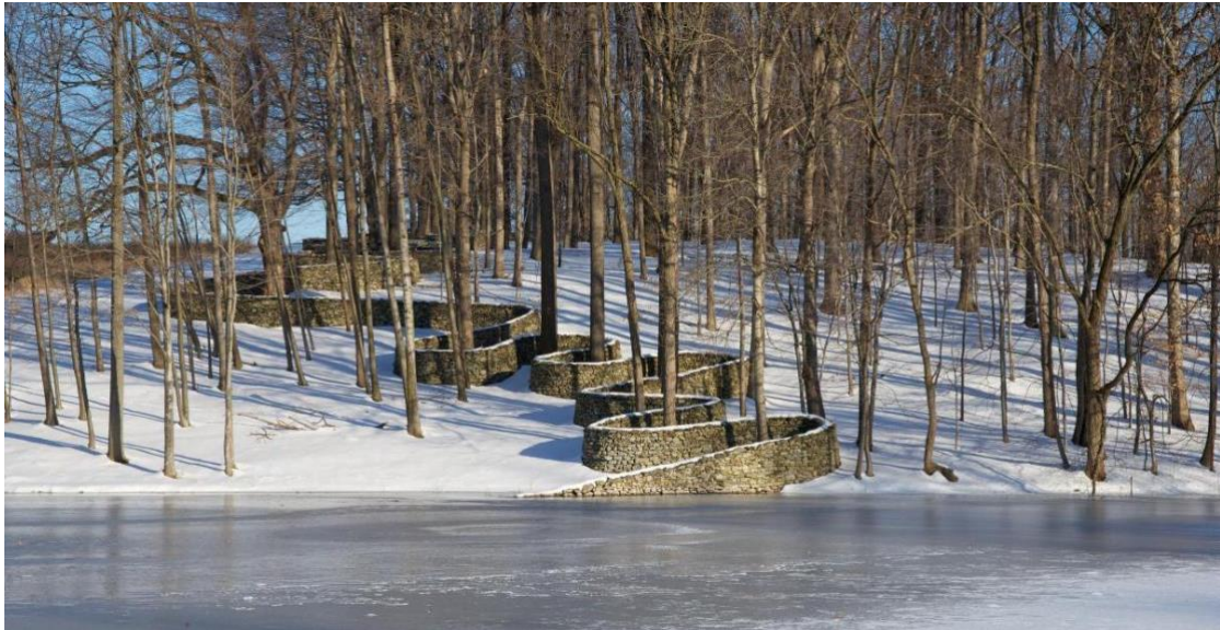
Slika 5. Andy Goldsworthy, Storm King Wall (1997. - 1998.)

Jedno od poznatih Goldsworthyjevih djela velikih dimenzija upravo je zakrivljeni zid Storm King Wall (1997. - 1998.) izgrađen u šumi (u New Yorku, SAD) dajući poseban dojam „šuljanja“ i „vijuganja“ između drveća ( Slika 5. ).