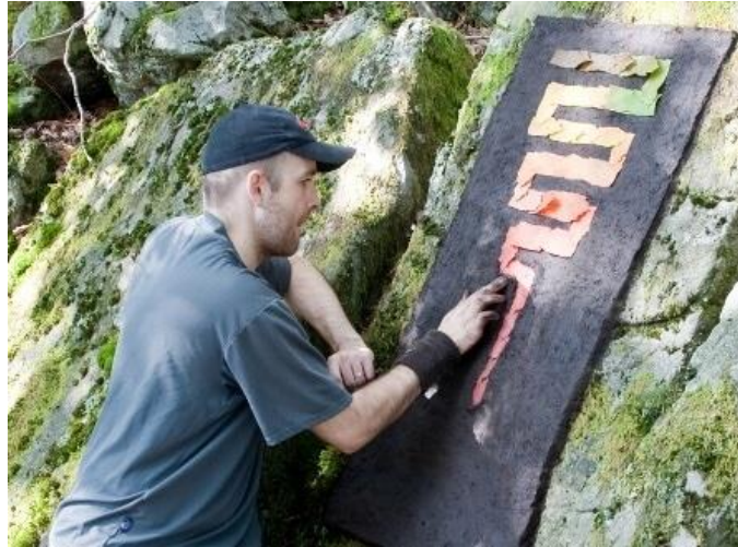
Slika 8. Umjetnik u procesu , https://artfulparent.com/richard-shilling-on-land-art-for-kids/ 24.9.202