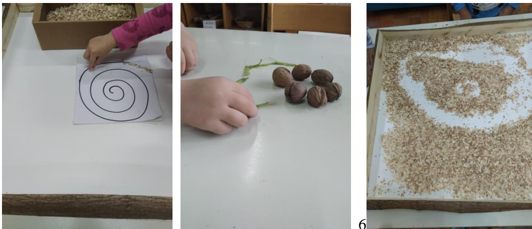
Slike 22, 23 i 24 - Spirale

Simbol spirale poznaju gotovo sve kulture, simbolizira suprotnosti, borbe između svjetla i tame dobra i zla i prisutna je u prvim radovima „Land art pokreta. U dječjem izražavanju simbolima, najčešće je prisutno crtanje izraženim kružnim linijama, prvi znak izražavanja. S vremenom postaju simbol za neki oblik ili značenje nekog događaja u djetetovom životu. Među spirale također koristi, stavlja i ravne linije koje će s vremenom dobiti jasnije značenje. (Belamarić, 1986: 45)