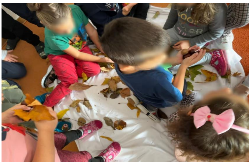
Slika 3 i 4 Igra osluškivanja i opipanja lišća

Djecu sam pozvala na tepih, a ja sam sjela nasuprot njih. Prvi put sam im pročitala pjesmu, a drugi put sam im pročitala sa aplikacijama. Uslijedio je razgovor o pjesmi. Na pitanje „Kako vam se pjesma sviđa?“ uslijedili su odgovori: „Lijepa.“, „Volim ježeke.“. Na pitanje „Kakav je ježek?“, bili su razni odgovori: „Dobar“, „Bodljikav“, „Ima iglice, skoro po celim telu.“, „Nogice mu se ne vide.“, „Crni“, „Smeđi“, „Ima crnu njuškicu“, „Malo su mu crne bodljice“. Pitala sam ih i „O kome stalno ježek misli?“, slijede odgovori djece: „O kruškama.“. Zatim sam ih pitala „Kažete li vi doma kruške ili hruške?“, rekla sam im nek dignu ruke koji doma kažu hruške. Ruku je diglo osmero djece. Sljedeće pitanje bilo je „Volite li vi jesti kruške?“, odgovor jedne djevojčice bio je „Jer voli jesti kruške“. Uslijedilo je pitanje „Da li vi volite jesti kruške“ i jednoglasni odgovor „Da.“ Zatim pitanje „Zašto jesen ima žutu suknju?“ i odgovor „Zato jer promeni boju dok je jesen i sve je šareno“ Nadalje moje pitanje glasilo je „Što to pada u jesen?“, odgovori su bili „Lišće.“, „Lišće šareno, crveno, žuto.“ Tada sam ih još pitala „Kako ježek nosi hruške v luknju?“ i odgovori „Na bodljama“, „Napiči si.“.