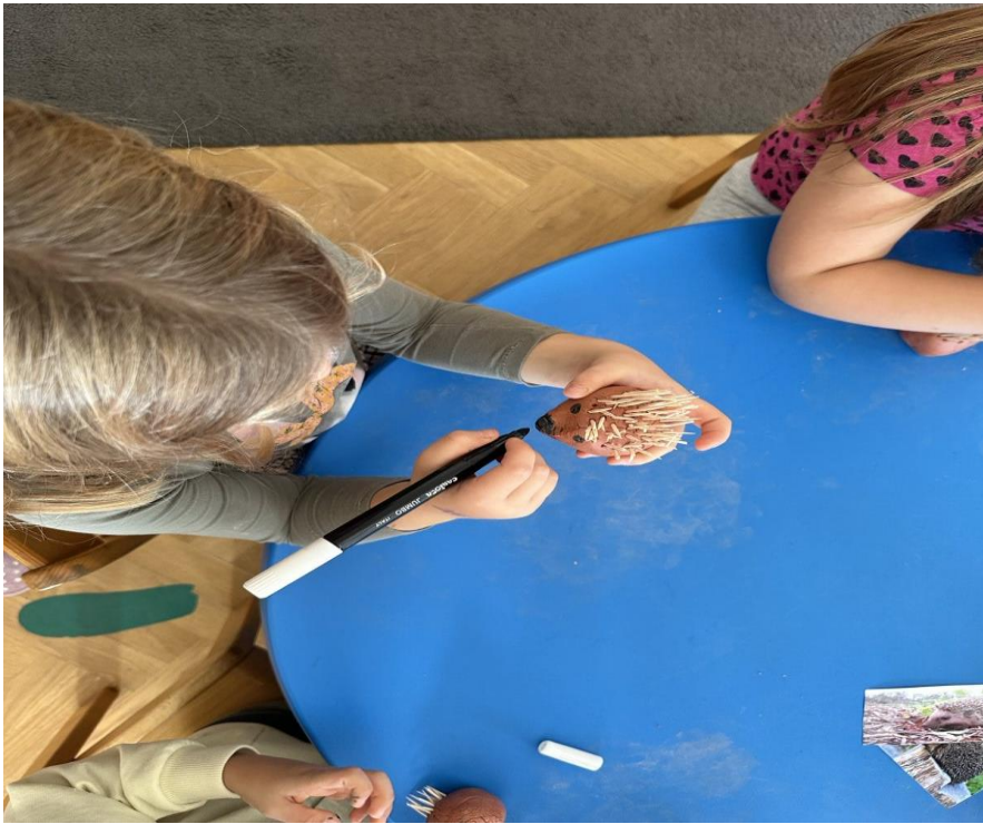
Slike 5, 6 i 7 Likovna aktivnost, modeliranje ježa