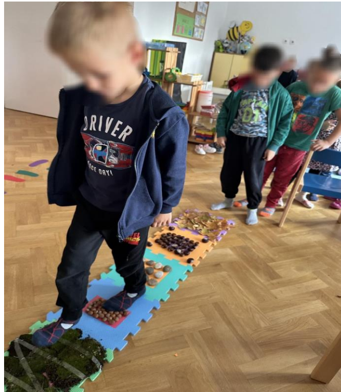
Slika 2 Hodanje po senzornoj stazi

Aktivnost sam započela postavljanjem senzorne staze. Djeca su izula svoje papučice te sam ih uvela u ulogu malih ježeka. Svako dijete je govorilo kakva je podloga; „tvrda“, „mekana“, „pika“, „hladna“. Tijekom hodanja po stazi postavljala sam im poticajna pitanja: „Kakva je podloga?“, „Je podloga bodeća?“. Njihove odgovore izgovarala sam na kajkavskom narječju, pr. tvrda - trda.