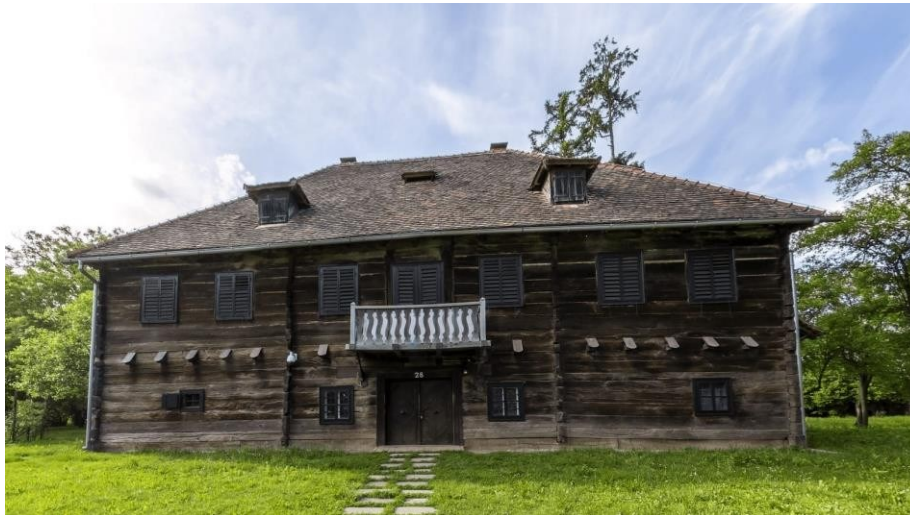
Slika 15. Kurija Modić-Bedeković

Bogatiji ljudi i plemenitaši na području Turopolja živjeli su u kurijama ili dvorovima te su one bile vrhunac graditeljstva u 19. stoljeću. Oko njih nalazili su se parkovi i ostatak gospodarskog imanja. U Turopolju je sagrađeno mnogo kurija, ali većina njih danas ne postoji. One koje su opstale su župni dvor Staroga Čiča, dvor obitelji Zlatarić, dvor obitelji Pintarić koji su se nalazili u Bukevju te najpoznatije kurije Alapić i Modić-Bedeković. Kurija Alapić nalazi se u Vukovini te je danas u vrlo lošem stanju. Pripadala je obitelji Alapić čiji je pripadnik bio Gašpar Alapić, poznat kao sudionik Seljačke bune. Kurija Modić-Bedeković je izgrađena 1806. godine u Donjoj Lomnici (Slika 15). Ona je danas očuvana zbog restauratora Muzeja Turopolje. Oko nje nalazi se park. U prizemlju su gospodarske prostorije, a ostatak se nalazi na katu. U njoj se može naći stilski namještaj, peć za grijanje, umjetnička djela, porculan, klavir i slično.