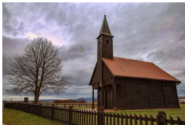
Slika 19. Kapela Ranjenog Isusa