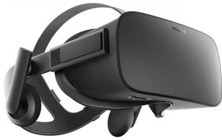
Slika 3. OCULUS RIFT. https://www.mikronis.hr/Proizvod/oculus-rift-virtual-reality-headset-p-n-301-00204-01/2179