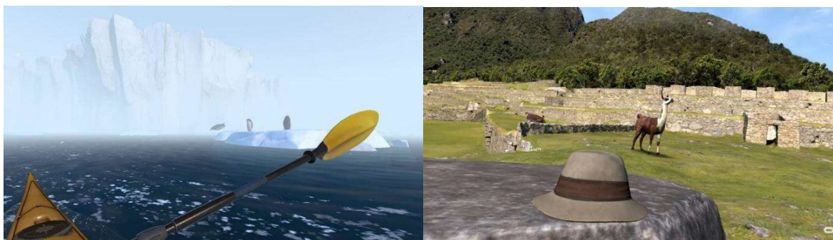
Slika 9. National geographic explore VR. https://www.oculus.com/experiences/quest/2046607608728563

My Africa: Elephant Keeper je aplikacija u kojoj se korisnici u virtualnom okruženju brinu za maloga slona, hrane ga, čiste, slušaju otkucaje srca, uzimaju uzorak krvi itd. Aplikaciju su napravili Vision3 i Conservation International. Conservation International se bavi zaštitom i očuvanjem okoliša.