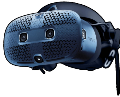
Slika 4. HTC VIVE COSMOS. https://www.vive.com/au/product/vive-cosmos/features/

Vrhar (2017) prema Lavallo (2016) dijeli strukturu HMD uređaja na četiri dijela. Prvi je izvor slike koji se prikazuje u oku korisnika, zatim optički sustav koji prenosi informaciju od izvora slike do očiju korisnika, montažna platforma kao što je traka za glavu, vizir, naočale ili kaciga i uređaj za praćenje koji nije obavezan dio, ali je često dio HMD uređaja. Uređaj za praćenje potreban je za isporuku vanjske slike pomoću senzora ili sintetičke baze podataka.