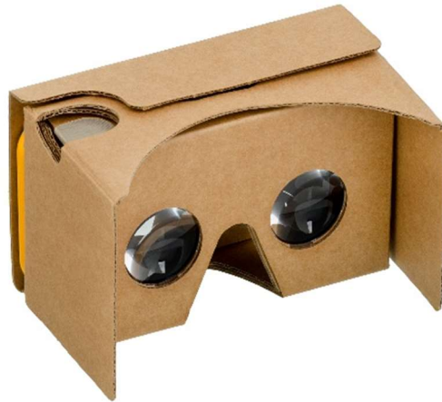
Slika 2. Google cardboard. https://en.wikipedia.org/wiki/Google_Cardboard

Internetski portal PC Chip (2016) donosi opis Google Cardboarda, Googleova proizvoda koji je revolucionarno smanjio cijenu ulaska u svijet virtualne stvarnosti. Google Cardboard zapravo je kartonska kutija koja se složi za desetak minuta. Ideja Googleova razvojnog tima bila je omogućiti korisnicima jeftini uređaj za glavu koji se koristi u kombinaciji s vlastitim mobitelom. PC Chip ipak ističe kako je vizualni doživljaj lošiji u odnosu na druge uređaje, ali je zato puno dostupniji, što je dobro za početno eksperimentiranje s tehnologijom virtualne stvarnosti.