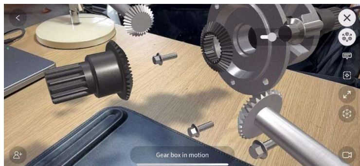
Slika 7. Jig Space. https://www.jig.space/help-center/exploded-views-in-augmented-reality

Aplikacija JigSpace je platforma koju bismo najjednostavnije opisali kao knjižnicu sadržaja za tehnologiju virtualne ili proširene stvarnosti koja odgovara na pitanje kako nešto radi. Od principa rada svemirske stanice na Marsu i indukcijskoga motora, preko načina rada glasovira, do izgleda unutrašnjosti planeta Zemlje.