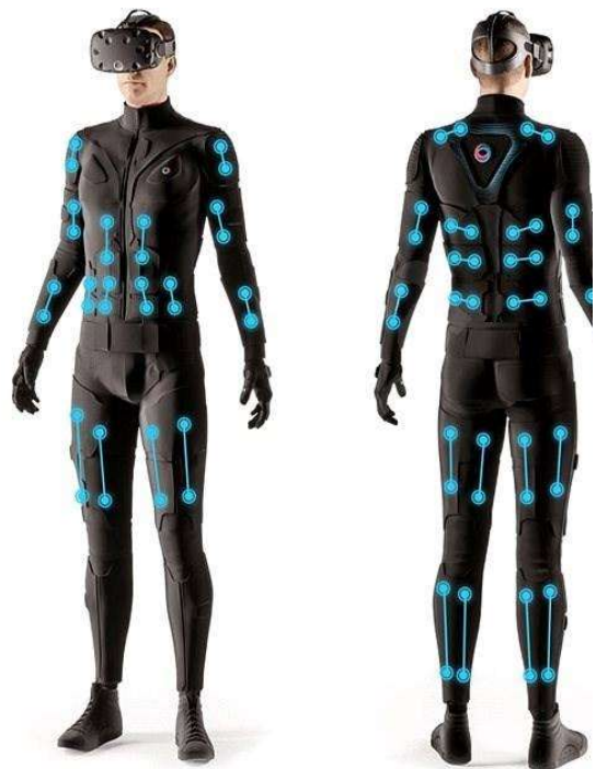
Slika 5. Tesla suit. https://m.alza.cz/EN/gaming/teslasuit-d5250186.htm

Na CES-u (Consumer Electronics Show) godišnjem sajmu najnovijih tehnologija koji se održava u Los Vegasu, 2019. godine predstavljen je Tesla Suit koji, koristeći se tehnologijom „pametne tkanine“, ima sposobnost dati povratnu informaciju iz virtualne stvarnosti šaljući električne impulse direktno na kožu. Rad odjela na portalu Culex opisuje kroz konkretan primjer virtualnoga odlaska na Sjeverni pol. Primjerice, ako stavimo virtualne naočale i obučemo odijelo i virtualno „odšetamo“ do Sjevernoga pola, osim vizualnoga dojma da smo na snijegu i ledu Sjevernoga pola odijelo će zaista simulirati našem tijelu hladnoću.