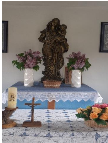
Fotografija 8. Unutrašnjost kapele Gospe Snježne u Tremi Osuđevo

Od preostalih sakralnih objekata tu su još kapela u Tremi Budilovo koja nije posvećena nijednom svecu, kapela u Tremi Medačevo posvećena rođenju Blažene Djevice Marije te kapela Gospe Snježne u Tremi Osuđevo.