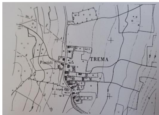
Fotografija 3. Trema, karta naselja