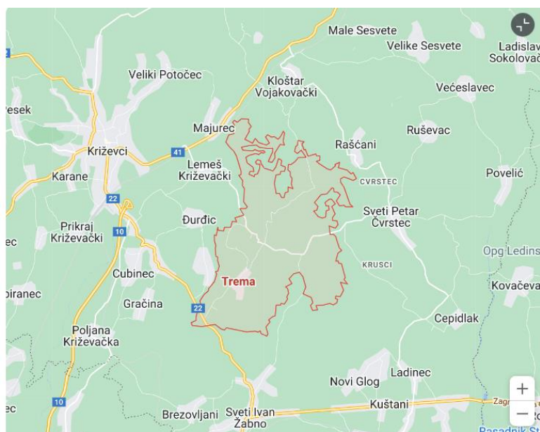
Fotografija 1. Zemljopisni položaj sela Trema

Selo Trema nalazi se u općini Sveti Ivan Žabno, jugoistočno od Križevaca. Selo je smješteno u razvedenom i brežuljkastom krajoliku, a sastoji se od devet zaseoka (ulica), a to su: Prkos, Budilovo, Osuđevo, Gornje selo, Medačevo, Grubiševo, Pintići, Dvorišće i Vražje oko.