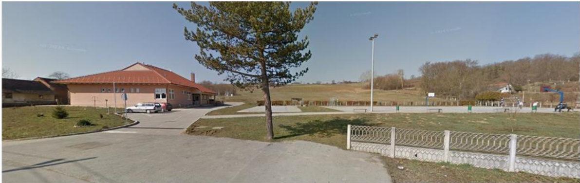
Fotografija 4. Područna škola i igralište u Tremi

1954. godine osnovana je područna škola u Tremi (Šramek, 1995.), matična školska ustanova jest Osnovna škola „Grigor Vitez“ Sveti Ivan Žabno. Područna škola u Tremi srušena je zbog starosti, a nova škola izgrađena je na istom mjestu te je otvorena 21.9.2007. godine na adresi Grubiševo 17.