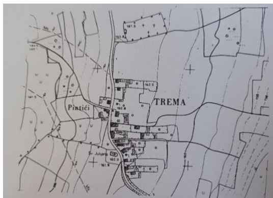
Fotografija 3. Trema, karta naselja