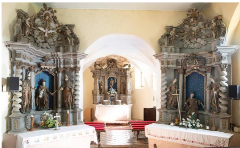
Fotografije 6. i 7. crkva sv. Julijane: eksterijer i interijer