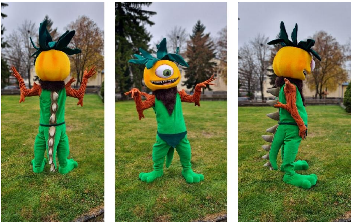
Slika 5. Maskota Pesjaneka

Zahvaljujući Knjižnici grada Preloga i Društvu naša djeca Prelog, ova legenda postaje sve poznatija i današnjoj djeci. Naime, oni organiziraju razne događaje čija tema je upravo Pesjanek, a upravo takav jedan događaj je „Legendra, festival mitova i legendi dravskog kraja“. Osim toga, od strane ravnateljice preloške knjižnice, izdana je slikovnica „Pesjanek te gleda“ koja je ujedno prva preloška baštinska slikovnica. Uz to, Prelog ima i maskotu Pesjaneka koja je djeci vrlo primamljiva.