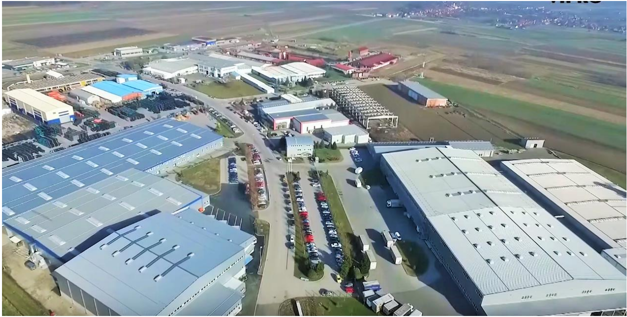
Slika 2. "Industrijska zona Prelog Istok"