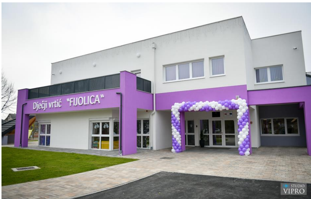
Slika 4. Dječji vrtić Fijolica nakon rekonstrukcije