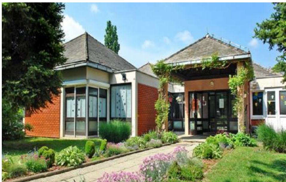
Slika 3. Dječji vrtić Fijolica prije rekonstrukcije

Zabavište, kako se nekad zvao dječji vrtić, u Prelogu je otvoreno davne 1898. godine, no iz mnogih različitih razloga, nekoliko se puta zatvaralo pa opet otvaralo sve do 1953. godine od kada radi bez prekida. Od te godine, pa do 1998. bio je u sklopu škole i tek tada postaje samostalan. Vrtić Fijolica je gradski vrtić te se sastoji od deset odgojno obrazovnih skupina, plus još tri u Draškovcu i jedna u Cirkovljanu. 2019. godine završen je projekt “Rekonstrukcija i dogradnja dječjeg vrtića u Prelogu” kojim je vrtić u potpunosti obnovljen, podignut je kat te se dobio prostor za nekoliko novih soba.