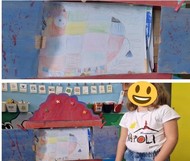
Slika 13. Dječji rad: Elmer i izgubljeni medo