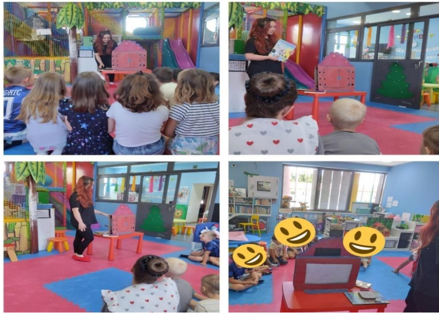
Slika 5. Uvodni dio radionice