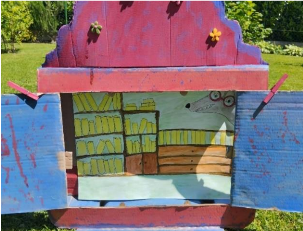
Slika 24. . Ilustracija 6

Kako i vuk čitati zna“, pomisli vuk te se zaputi prema selu (Zamole se djeca da ponove rečenicu)