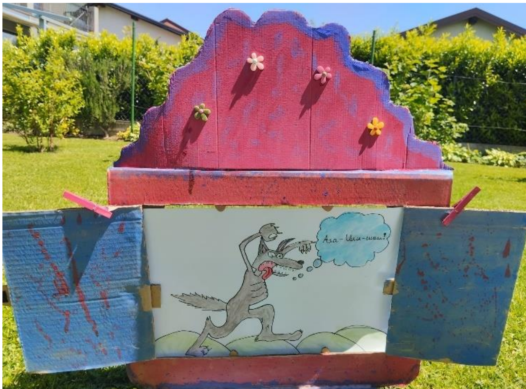
Slika 21. Ilustracija 3

Ali vuk se sav ljut derao kako je on veliki, opasni vuk i nije mu bilo jasno zašto ga se životinje nimalo ne boje. No, svinja ga je otjerala sa sela i rekla mu kako ovdje borave samo uljuđene životinje.