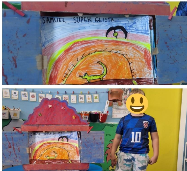
Slika 9. Dječji rad: Superglista