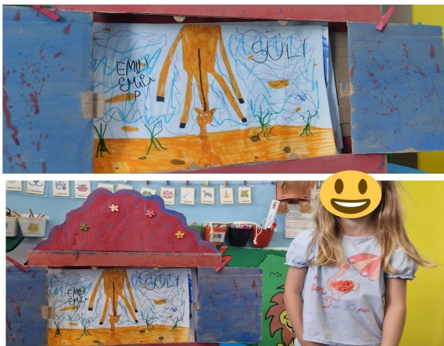
Slika 14. Dječji rad: Suli u avanturi