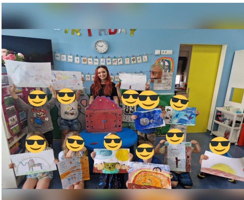
Slika 19. Zajednička fotografija radova

Aktivnost provedenu u vrtiću smatram veoma uspješnom zbog brojnih pozitivnih reakcija djece. Djecu sam prisjetila na kamišibaj kazalište te im proširila znanje o japanskoj kulturi te povijesti nastanka kamišibaja. Uvođenjem rime u priču privukla sam interes djece za pričom. Da su djeca pozorno pratila priču, spoznala sam kroz razna pitanja o priči na koja su svi odgovarali točno te i samim ponavljanjem rečenica s rimom što ukazuje na uspješno obavljen cilj rada tj. poticanje predčitalačkih vještina kod djece. Također, djecu sam upoznala s igrom riječi te primijetila kako poprilično dobro barataju slovima te prepoznaju glasove u riječima. Jedno od ciljeva bilo je i osloboditi povučenu djecu od treme prilikom vlastitog predstavljanja priče. Primijetila sam kako su neka od djece imala problem prilikom javnog nastupa primjerice nekima se tresao glas, neki su zaboravili rečenice i slično, ali uz pomoć odgojiteljica i mene svako je dijete uspjelo predstaviti svoju priču u par rečenica te je naposljetku dobilo i pljesak od svojih prijatelja i odgajatelja. Na samom kraju upitala sam djecu je li im se svidio ovakav način pripovijedanja priče te su me odgovori jako razveselili zbog brojnih pozitivnih komentara o kamišibaju. Neka od djece zamolila su me da im ponovno pričam priče u butaju, neki su govorili kako im je ovaj način bolji od čitanja slikovnice te su me na kraju zamolili za zajedničku fotografiju s radovima koja se nalazi ispod.