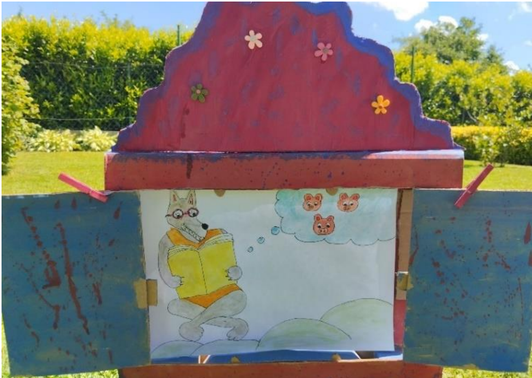
Slika 25. Ilustracija 7

Patka ga je odmah prekinula i rekla mu da prestane s tim. Svinja je nadodala kako se malko popravio, ali da će još mnogo morati poraditi na stilu, a vuk je samo podvio rep i povukao se.