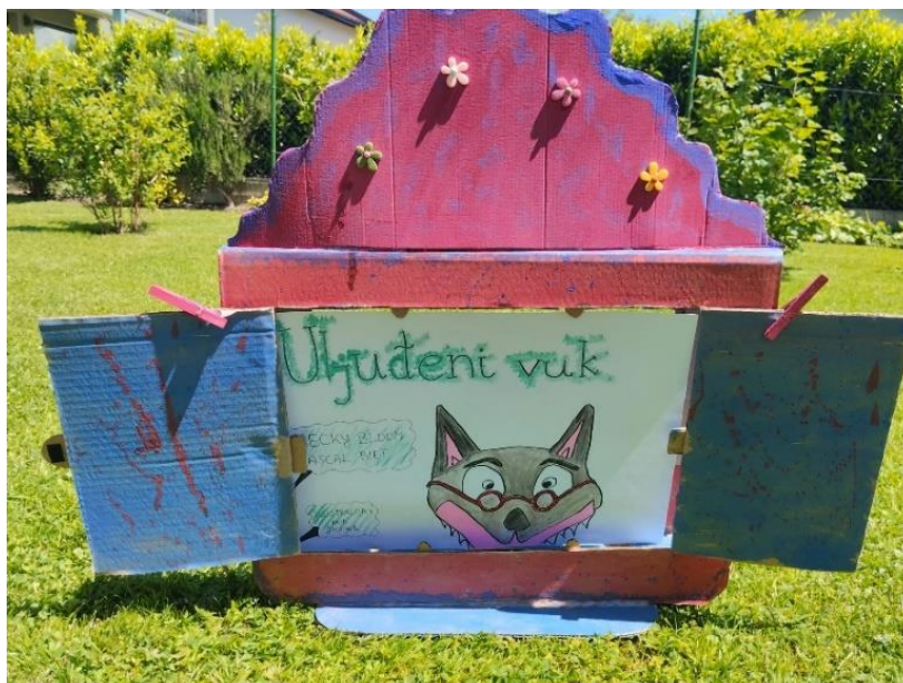
Slika 4. Ilustracija 1: Naslovna stranica

Cjelovita priča i kartice s ilustracijama, nalaze se u Prilogu.