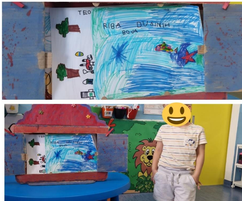
Slika 11. Dječji rad: Riba duginih boja