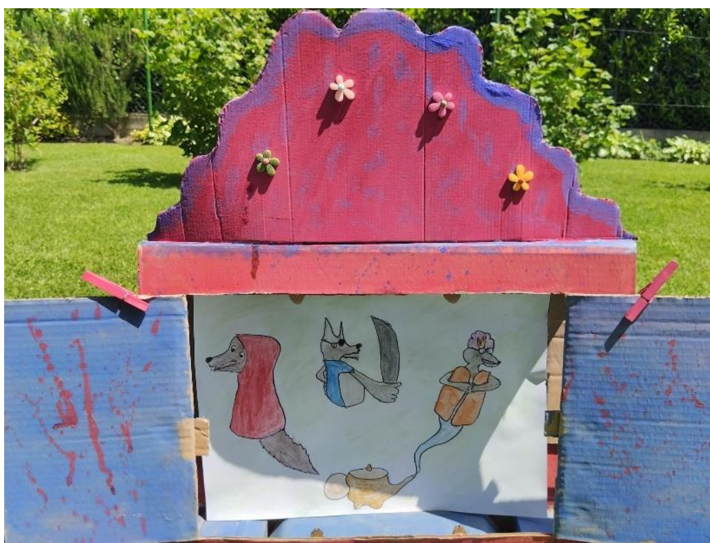
Slika 28. Ilustracija 10

Krava je imala jednu izvrsnu ideju te je upitala vuka želi li poći s njima na izlet.