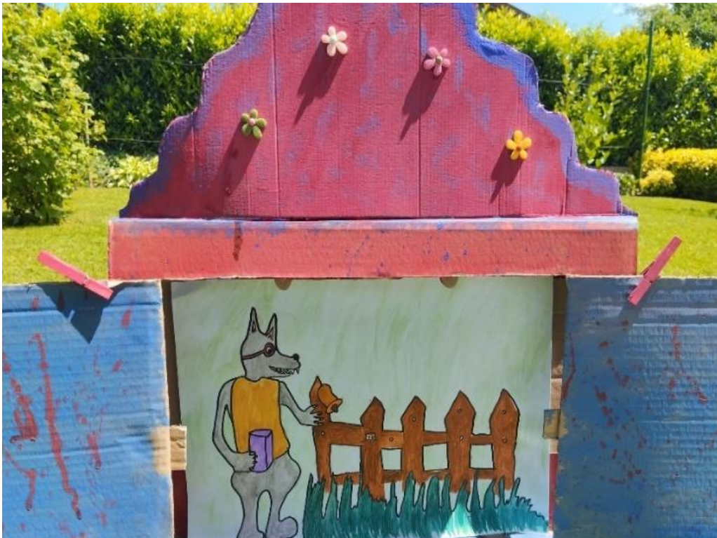
Slika 27. Ilustracija 9

„Ding - dong“, pozvonio je vuk na ulazu u seosko dobro. Legao je na travu, udobno se smjestio te izvadio svoju novu knjigu. Počeo je tako strastveno čitati na glas, pa su ga svinja, patka i krava slušale bez riječi. Svaki put kad bi pročitao jednu priču, životinje su ga zamolile da pročita još jednu.