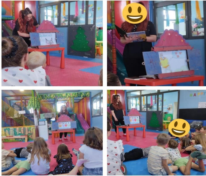
Slika 6. Glavni dio radionice