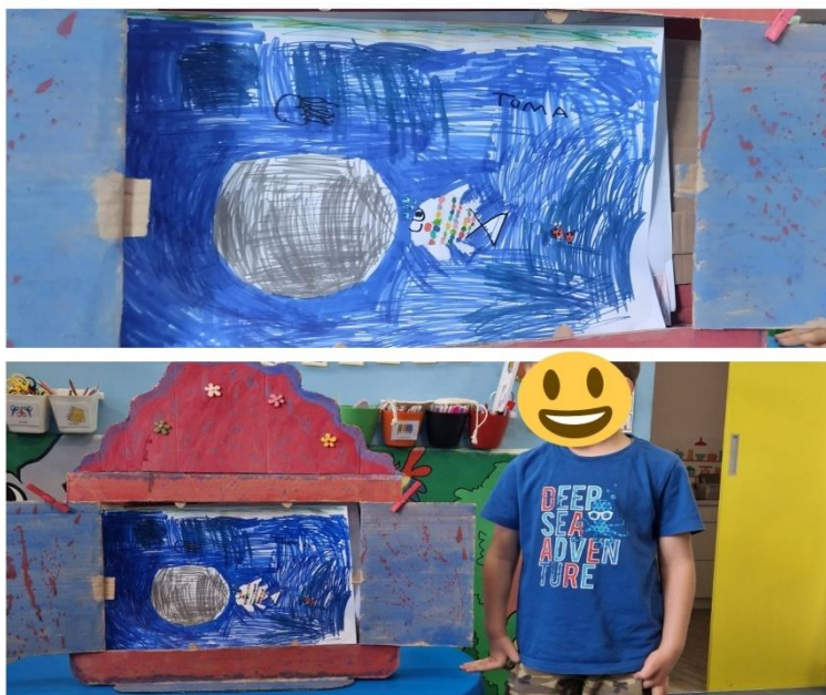
Slika 15. Dječji rad: Ribica srebrica