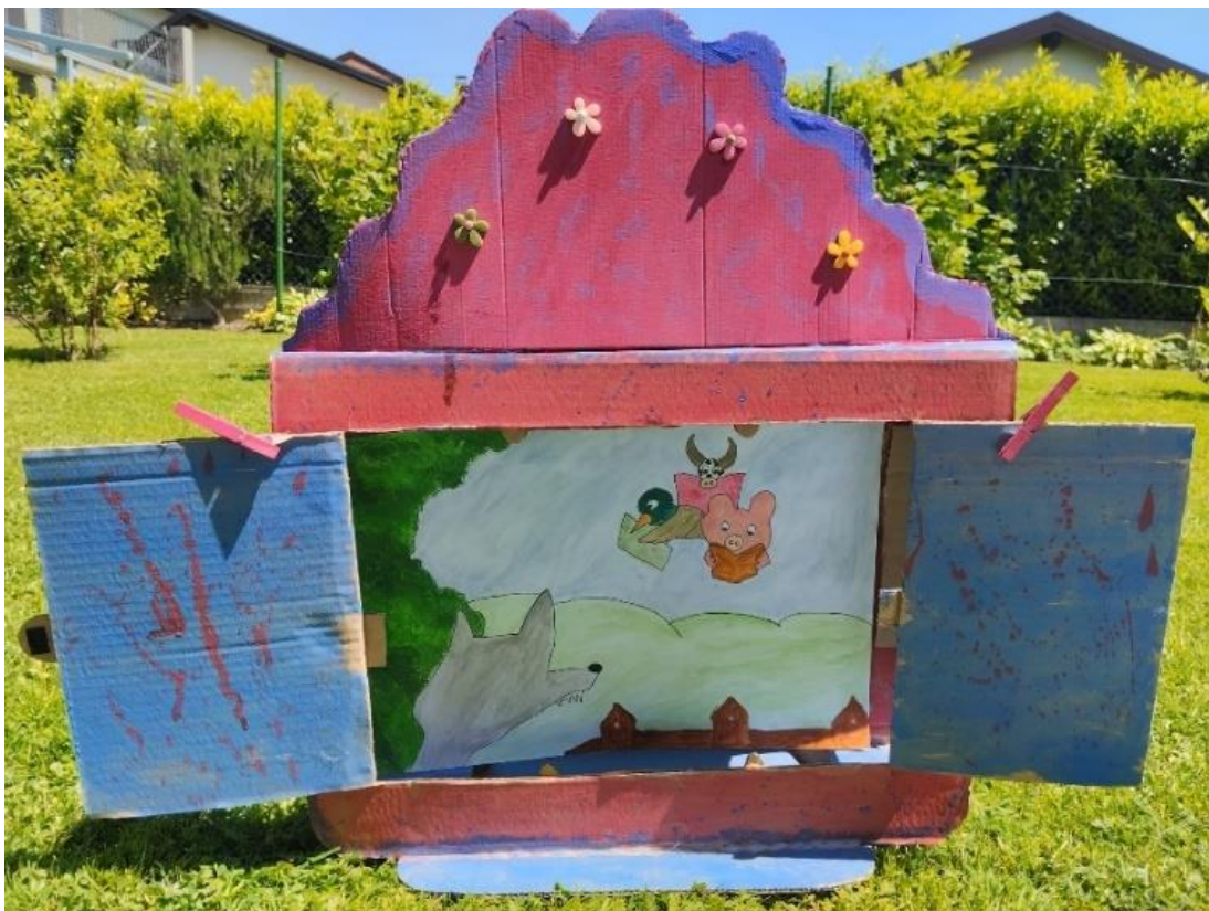
Slika 20. Ilustracija 2

ili su i životinje dobile čitalačke moći?