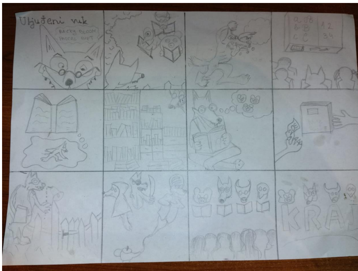
Slika 1. Izrada mreže ilustracija

Mreža ilustracija sastoji se od 12 kartica. Likovna tehnika koju sam koristila je kombinacija akvarel boje i flomastera kojim sam označila rubne linije kako bih ih bolje istaknula. Koristila sam svjetlije nijanse radi dočaravanja atmosfere te boje iz prirode gdje je i smještena radnja priče. Slike iz priče sam prilagodila djeci koristeći se različitim tehnikama npr. prikazivanjem detalja, krupnog plana te prikazom likova smještenih u geometrijsku perspektivu.