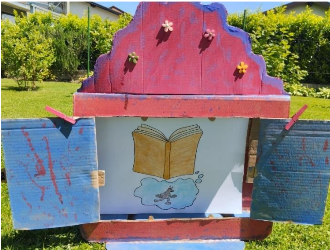
Slika 23. Ilustracija 5

Životinje su ga prekinule i upozorile kako se treba još dosta potruditi, nastavile su čitati svoje knjige, a vuk je sav tužan skočio preko ograde i otišao.