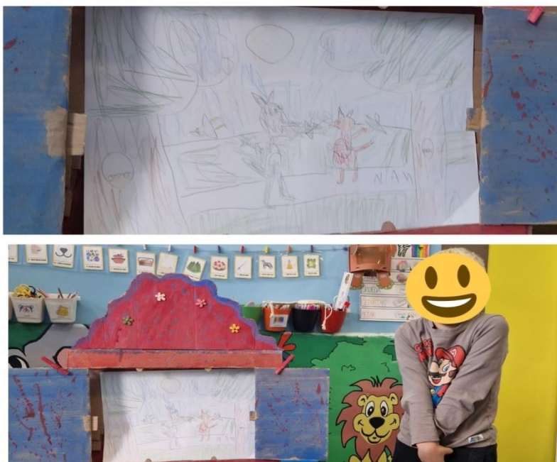
Slika 18. Dječji rad: Vuk koji je tražio ljubav