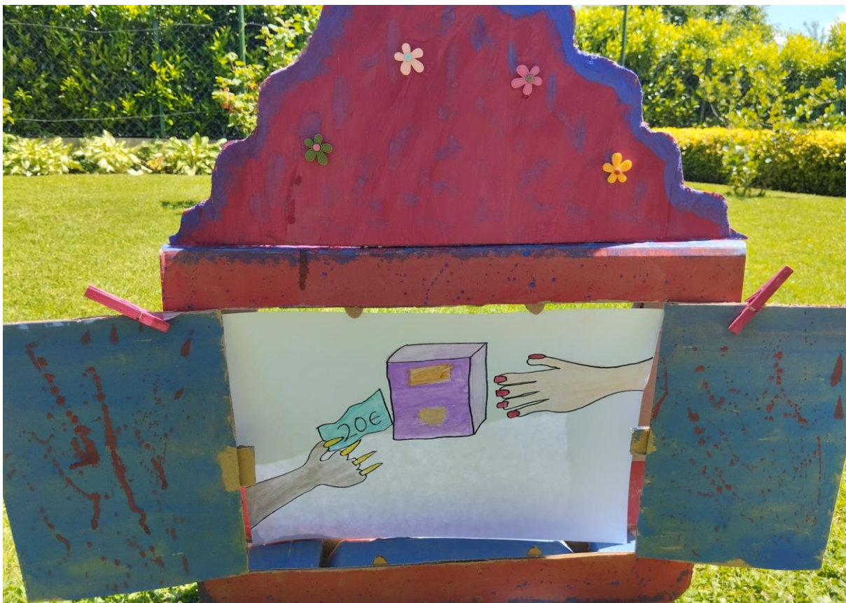
Slika 26. Ilustracija 8