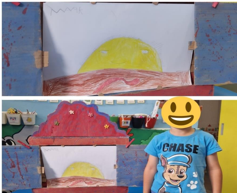
Slika 17. Dječji rad: Superglista