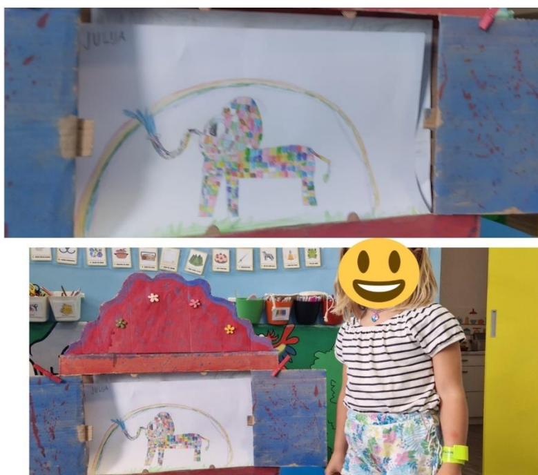
Slika 16. Dječji rad: Elmer i duga