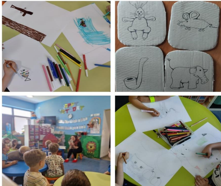
Slika 7. Završni dio radionice

dobila zadatak da se prisjete svoje omiljene priče te da ju pokušaju nacrtati i predstaviti unutar butaja. Svako dijete sam upitala što se nalazi na slici te zašto je to njihova omiljena priča.