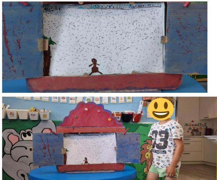
Slika 8. Dječji rad: Prutimir