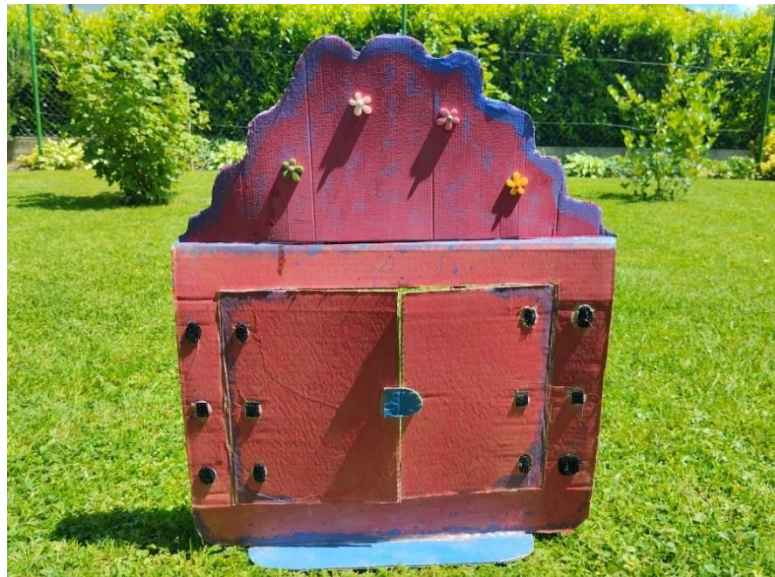
Slika 3. Samostalno izrađen butaj

postavila u butaj kojeg sam također samostalno izradila koristeći kartonsku kutiju, tempere i ukrase.