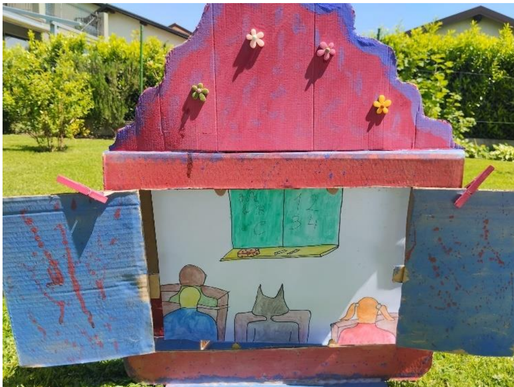
Slika 22. Ilustracija 4

Vuk nikada nije čuo za uljuđene životinje. (Pitanje za djecu: Jeste li vi čuli za uljuđene životinje?). Ako tamo borave samo uljuđene životinje, vuk je pomislio kako će i on krenuti u školu i tamo naučiti čitati. Djeci je bilo pomalo čudno što imaju vuka u razredu, no kako nikoga nije pokušao pojesti, ubrzo su se privikli na njega. Vuk je bio prilično marljiv te ubrzo naučio čitati i pisati, a postao je i najbolji učenik u razredu.