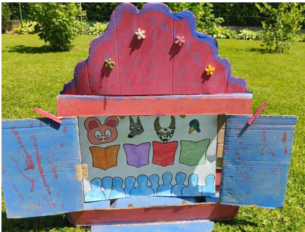
Slika 29. Ilustracija 11

„Sad se vidi sad se zna, kako dobre prijatelje imam ja“ „Jeste li djeco primijetili ovo, sad i vuk zna svako slovo!?”