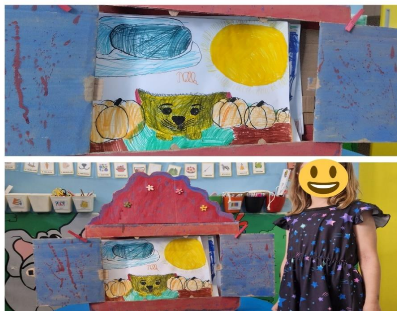
Slika 12. Dječji rad: Juha od bundeve