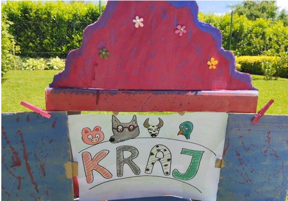
Slika 30. Ilustracija 12 : Kraj