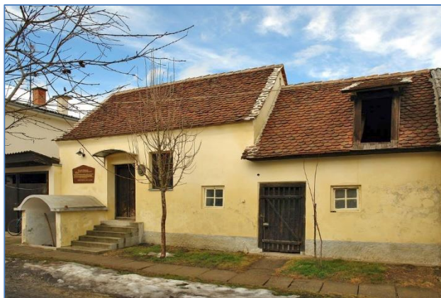
Slika 1. Rodna kuća dr. Rudolfa Steinera, (izvor: https://centar-rudolf-steiner.com/rodna-kuca/ )

Dr. Rudolf Steiner utemeljitelj je waldorfske pedagogije. Osim područja pedagogije, bavio se još i prirodnim znanostima, filozofijom, umjetnošću (arhitektura, slikarstvo i drugo) i književnošću temeljenima na duhovno-znanstvenom radu.