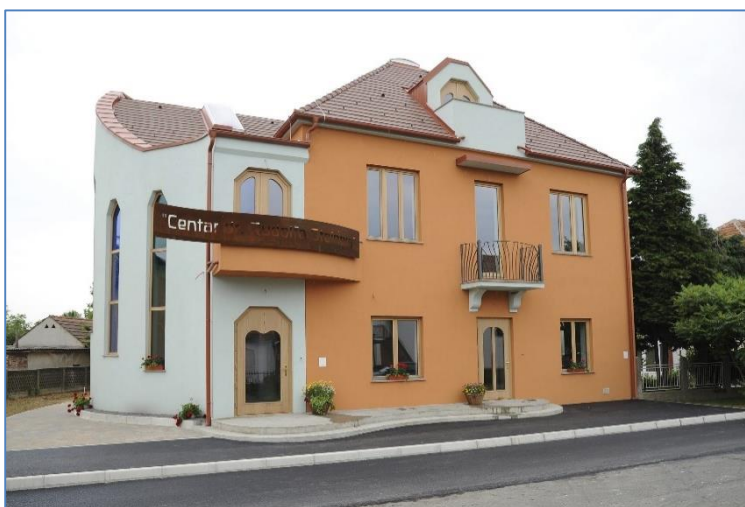
Slika 2. Centar dr. Rudolfa Steinera u Donjem Kraljevcu

Antropozofija (grčki: antrophos – čovjek i sofia – mudrost) je mudrost o čovjeku, ali i put spoznaje, koji želi duhovno u ljudskom biću dovesti ka duhovnom u svemiru (Santrić, 2011). U svojoj knjizi „Aspekti valdorfske pedagogije“ (2001) Steiner govori da antropozofija spaja teoretsko promatranje svijeta s neposrednim promatranjem života. Antropozofija polazi od prirodoznanstvenih temelja, ali traži i put do duhovne biti onoga što djeluje u prirodi.