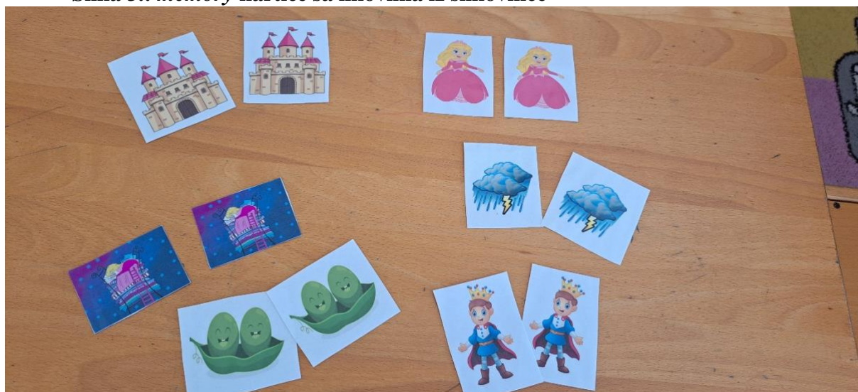
Opis slike 3.: memory kartice ponuđene djeci na kojima se nalaze likovi i pojmovi iz slikovnice koja djeci pročitana. Komentar djeteta koje se igralo: „Joj kak su lijepe ove slikice“