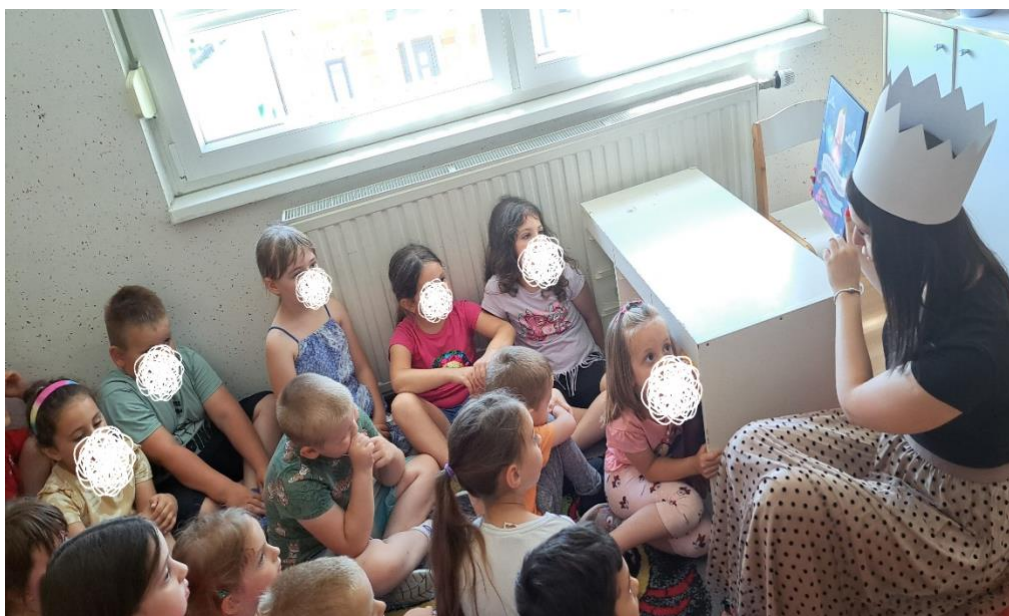
Opis slike 1.: studentica čita slikovnicu djeci, djeca su na tepihu i pozorno slušaju