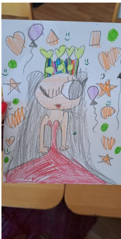
Slika 6.: Crtež djevojčice K.V.

Opis fotografije 6.: Djevojčica K.V. nacrtala je kraljevnu kao omiljeni lik iz priče. Komentar djeteta: „Vidiš teta, tu ti je kraljevna i vesela je jer se bude ženila.“