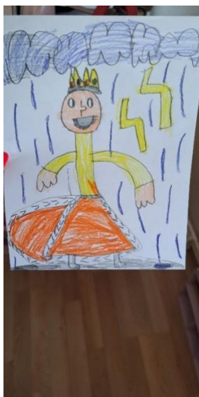
Opis slike 5.: Na fotografiji se nalazi crtež dječaka L.F., a on prikazuje kraljevića u oluji. Komentar djeteta: „To je kraljević kak ide spasiti kraljevnu od nevremena.“