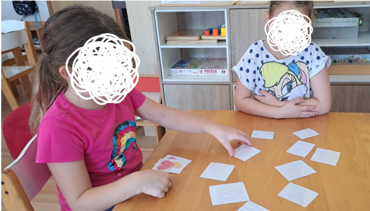
Opis slike 4.: Djevojčice igraju memory , povezuju pojmove, imenuju pojmove koje vide.