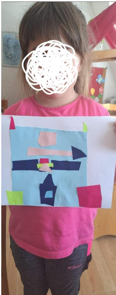
Opis fotografije 8.: Djevojčica je iz kolaž papira izradila svoj dvorac iz mašte.