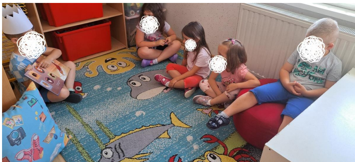
Opis slike 2.: Dječak D.T. čita prijateljima slikovnicu pokazujući ilustracije uz korištenje poticajnog izvora – krune.