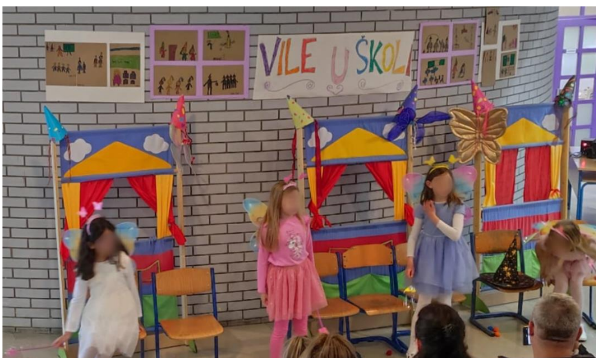
Treća scena: Dolaze dobre vile i pronalaze način kako da ponište čaroliju zlih vila.