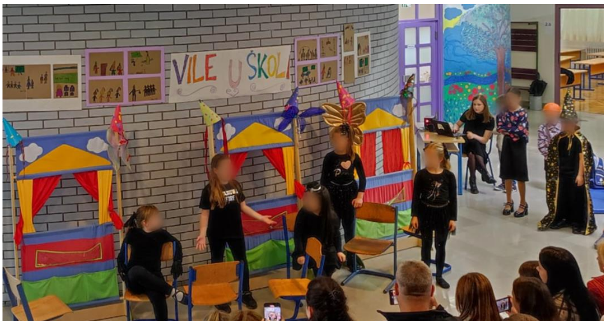
Druga scena: Zle vile smišljaju plan kako začarati učenike.