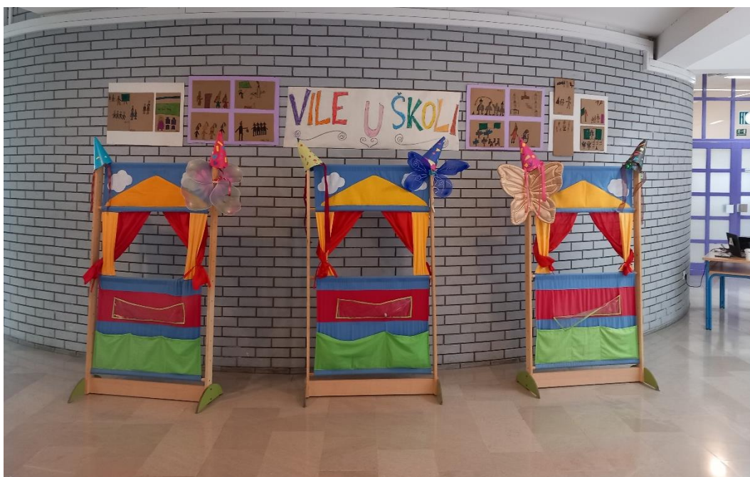
Prilog 4. Sastavljena scena prije nastupa