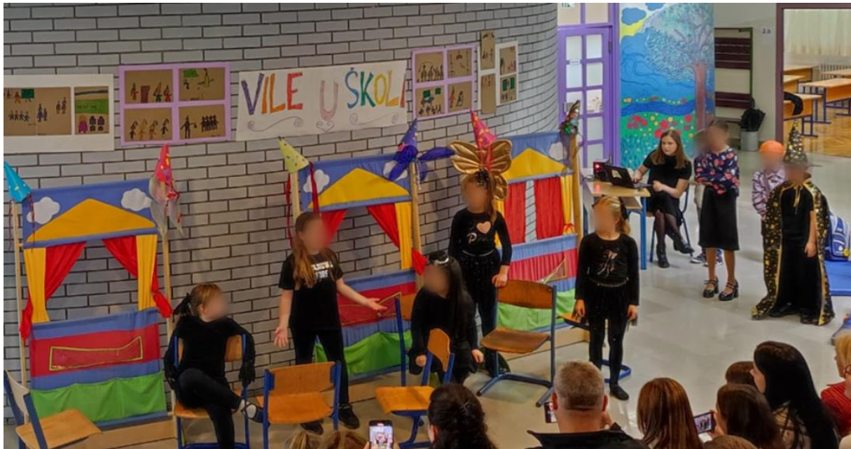
Druga scena: Zle vile smišljaju plan kako začarati učenike.