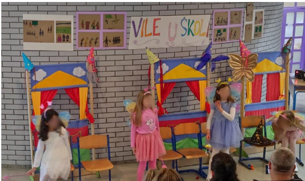
Treća scena: Dolaze dobre vile i pronalaze način kako da ponište čaroliju zlih vila.