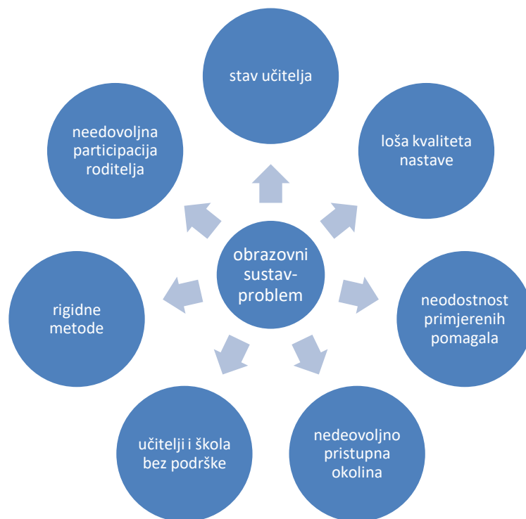
Slika 1: Inkluzivno obrazovanje (Cerić, 2004)