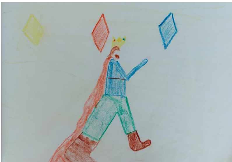
Slika 3. Učeničkov crtež kralja Krunoslava u bilježnici epohe

- od kralja Krunoslava do pisanja slova K: