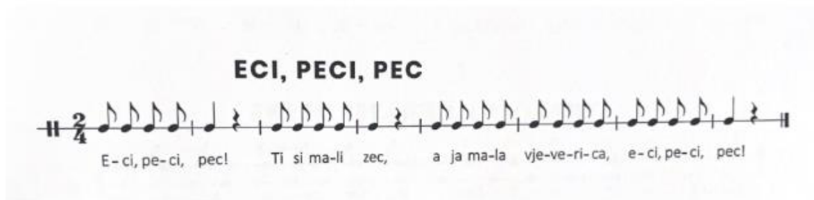
Slika 3 Primjer brojalice (Kraljić, 2023, str. 71)