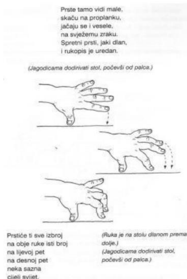
Slika 1. Vježba 1 (Osmanova, 2010, str. 53)

klaviru, dolazi do iste situacije u kojoj se ističe pravilan položaj prstiju, tj. pravilno dodirivanje klavijature jagodicama prstiju.