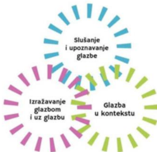
Slika 1. Domene u nastavi Glazbene kulture (MZO, 2019, n.s.).

Promatrajući Sliku 1., može se uočiti kako se domene predmeta Glazbena kultura nadopunjuju i međusobno povezuju, a u svim su domenama prisutni zajednički elementi: glazbeni jezik i informacijsko-komunikacijska tehnologija koja uključuje: