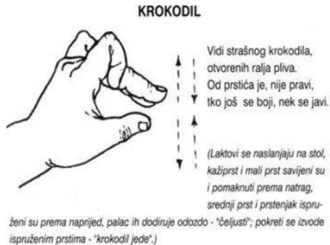
Slika 2. Vježba 2 (Osmanova, 2010, str. 31)

prema gore što omogućuje kontrolu i preciznost pri sviranju instrumenta, a položaj šake na flauti sličan je položaju šake u vježbi. Uz navedeno, Vježba 2 može se usporediti i sa sviranjem kastanjeta, instrumentom koji čini dio Orffovog instrumentarija. Kastanjeta se drži tako da se palac nalazi na donjoj strani kastanjeta dok se ostali prsti pomiču prema palcu i nalaze se s gornje strane kastanjeta te time dobiva zvuk.