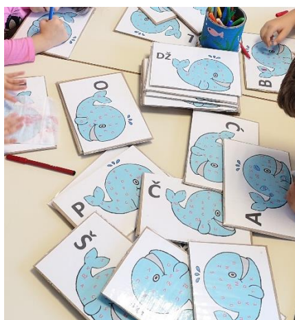
Slika 7 – kartice za uočavanje i prepoznavanje zadanih slova

Centar ćemo obogatiti slikovnom i/ili taktilnom abecedom te raznim materijalima koji će poticati djecu na stvaranje njihovih slikovnica. U nedostatku prostora, a u sklopu centra predčitačkih igara nalaziti će se dramski kutak s raznim vrstama lutaka, npr. štapne, prsne i ginjol lutke gdje će djeca primjenom dramskih igara razvijati svoje govorno-jezične sposobnosti.