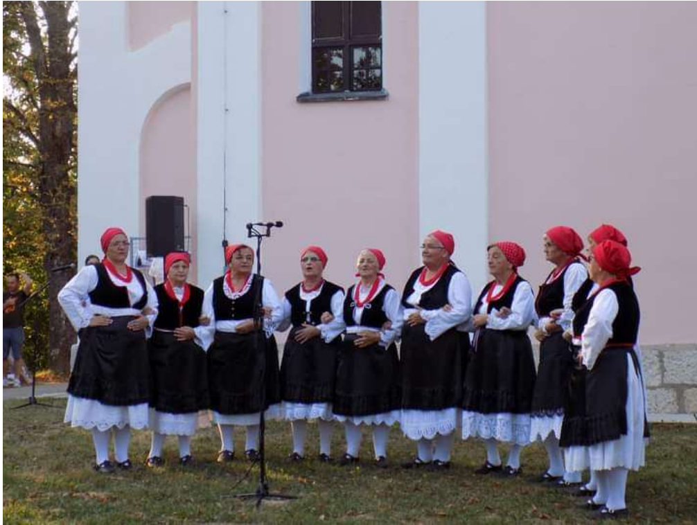
Slika 33. Ženska narodna nošnja Kostajničkog Pounja (KUD „Potočanka“ Potok, 2018)

Muška narodna nošnja ovog kraja sastoji se od bijele košulje, crnog prsluka (lajbeka), bijelih hlača (gaća), opanaka i crnog šešira.