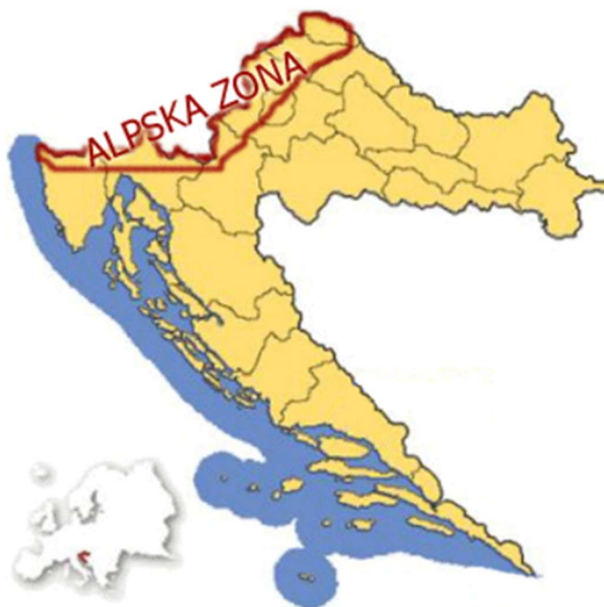
Slika 7. Alpska folklorna zona ( Hrvatski folklor 4 )

Alpska zona (Slika 7) obuhvaća prostor Istre, Gorskog kotara, Prigorja, Hrvatsko zagorje, Međimurje te dio Podravine. Vidljivi su i utjecaji alpske zone u Kalniku, Pokuplju, Bilogori, Banovini, Moslavini i Turopolju (Ivančan, 1996).