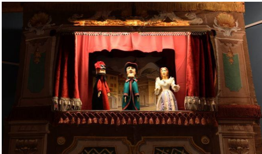
Slika 3. Pozornica za javajke