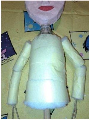
Slika 16. Izrada ruku