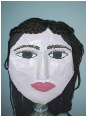
Slika 26. Nacrtani detalji na licu

Kad se boja na licu osušila, na njemu sam nacrtala detalje, odnosno obrve i trepavice. Za crtanje njih sam koristila čačkalicu. Zatim sam lutki obrubila usne i oblik očiju kao što je vidljivo na slici 26.