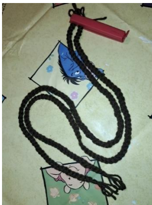
Slika 27. Dvije pletenice

Od smeđe vune za pletenje odrezala sam šest trakica duljine 120 centimetara. Jedan rub tih šest trakica sam zavezala u čvor. Grupirala sam po dvije trakica zajedno te sam isplela pletenicu do drugog ruba trakica na kojem sam ponovno zavezala čvor. Postupak sam ponovila tako da sam na kraju dobila dvije dugačke pletenice kao na slici 27.