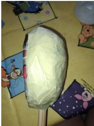
Slika 11. Oblikovanje glave pik trakom

Dodavala sam zgužvane novine na glavu pazeći na njihov raspored i debljinu te ih lijepila pik trakom kao na slici 11. sve dok nisam dobila željeni oblik glave.