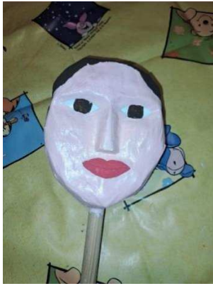
Slika 25. Lice obojano bojom kože

Na slici 25. vidljivo je kako sam lice lutke obojala bojom kože. Tu sam boju dobila miješanjem bijele boje s malo crvene i žute boje.