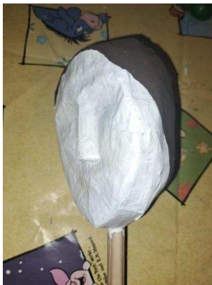
Slika 23. Obojena kosa

Na slici 23. vidi se da sam stražnji dio glave na kojem će se nalaziti kosa obojala smeđom bojom. Pri bojanju sam pazila na očekivano padanja kose s lica te tome prilagodila površinu koju sam bojala.