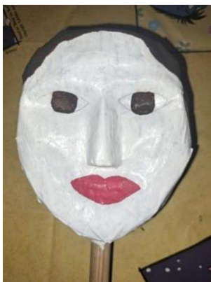
Slika 24. Nacrtane oči i usta

Na licu sam olovkom nacrtala oblik očiju i usta. Kad sam bila zadovoljna njihovim oblikom, veličinom i položajem, obojila sam unutrašnjost oka smeđom temperom, a usne mješavinom crvene boje s malo bijele što se vidi na slici 24.