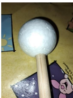
Slika 9. Stiroporna kugla na štapu

Na kugli od stiropora bušilicom sam probušila rupu do otprilike sredine kugle. Jedan rub štapa duljine 50 cm namočila sam u drvofiksa te ga kao na slici 9. ugurala u rupu na stiropornoj kugli. Oko dodirnog ruba štapa i stiroporne kugle dodala sam još tanak sloj ljepila te ga zagladila komadićem kartona.