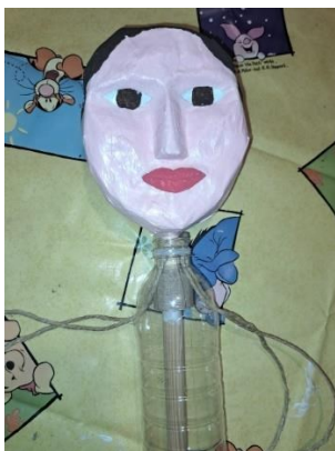
Slika 14. Mehanizam vrata

Na spoju glave i štapa zavezala sam špagicu i provukla svaku stranu špagice kroz jednu rupu. Komad kartona omotala sam u krug oko štapa te ga čvrsto zalijepila drvofiksom. Nanijela sam drvofiks na gornju stranu omotanog kartona i nagurala ga do vrha boce na način da sam ostavila pola centimetra prostora između vrha boce i glave kako bi se glava mogla okretati, odnosno kako bih dobila pokretnost vrata što se vidi na slici 14.