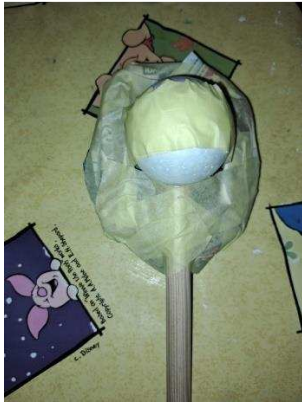
Slika 10. Kugla pričvršćena za glavu

Pik trakom prilijepila sam stiropornu kuglu za unutarnju stranu lica te ju tako osigurala da ostane pričvršćena uz glavu što se vidi na slici 10. Između kugle i glave ispod ljepila ugurala sam komadiće novina i oblijepila ih pik trakom.