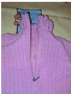
Slika 39. Patentni zatvarač

Od vrha ovratnika stavila sam patentni zatvarač te ga zašila za dvije stražnje strane haljine pomoću šivaće mašine kao na slici 39. Dio ispod patentnog zatvarača zašila sam jedan za drugi.