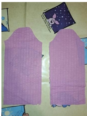
Slika 36. Rukavi haljine

Od iste roze tkanine izrezala sam i dva rukava haljine (slika 36.) pazeći na dimenzije sa skice haljine.