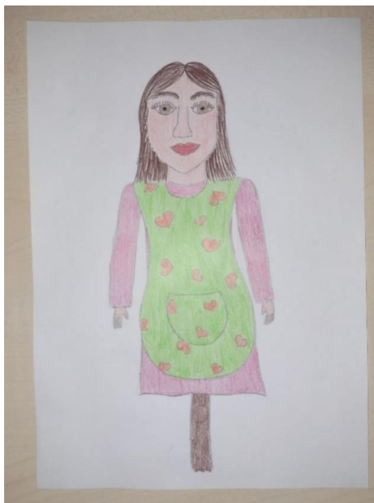
Slika 5. Skica lutke javajke