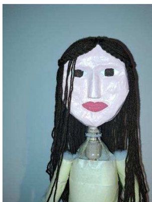
Slika 30. Pletenice sprijeda