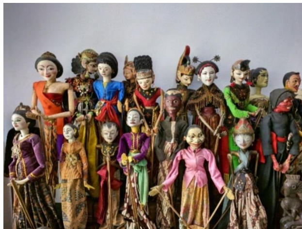
Slika 1. Lutka wayang golek