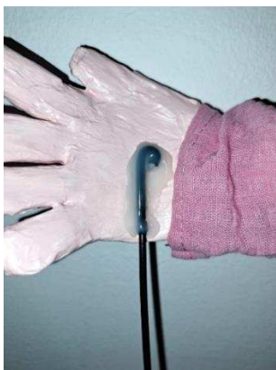
Slika 47. Vodilice na šakama

Za vodilice sam odabrala čvrste metalne žice. Duljinu vodilica odredila sam na način da vodilice budu jednake duljine kao štap u trenutku kad je lutkina ruka u najvišem položaju. Kliještima sam oblikovala jednu stranu žice po obliku dlana gdje sam ju htjela pričvrstiti te sam vrh žice zaoblila kako bih imala veću površinu dlana na koju bih nanijela vruće ljepljivo. Drugi dio vodilice izravnila sam kliještima. Na slici 47. vidi se kako sam vodilice za dlanove zalijepila