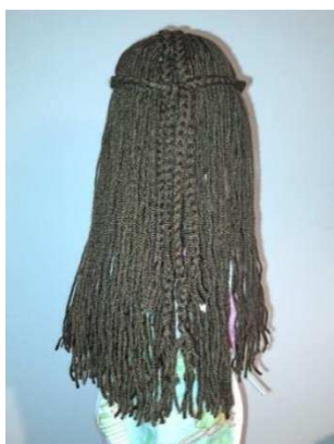
Slika 31. Pletenice straga

Jednu stranu pletenica ostavila sam da visi s razdjeljka s ostatkom kose, a drugi sam oblikovala preko čela tako da drži ostatak kose. Ta dva dijela pletenica zavezala sam u čvorić na stražnjoj strani glave. Zatim sam lutku postavila uspravno te joj škarama izjednačila duljinu kose.