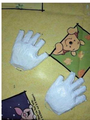
Slika 20. Šake obojane u bijelo

Obojala sam obje kaširane šake s dva debela sloja bijele boje kao na slici 20. kako se kroz krajnje nanесenu boju ne bi nazirala boja novina. Šake sam ostavila nekoliko dana da se bijela boja osuši.