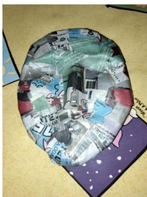
Slika 8. Kaširano lice lutke

Lice sam kaširala tako da sam novine potrgala na malene komadiće i umakala ih u 1:1 otopinu vode i drvofiksa. Umočene papiriće lijepila sam na foliju. Postupak sam ponavljala dok svaki dio lica nisam prešla s pet slojeva novina. Ostavila sam glavu da se osuši tjedan dana što se vidi na slici 8. Zatim sam glinu, zajedno s folijom, izvadila iz kaširanog lica. Rubove lica uredila sam škarama, a cijelo sam lice izgladila brusnim papirom.