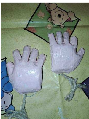
Slika 21. Šake boje kože

Nakon nekoliko dana kad se bijela boja posušila, obojala sam šake bojom koju sam koristila i za bojanje glave (slika 21.), a dobila sam ju miješanjem bijele boje s malo crvene i žute boje.