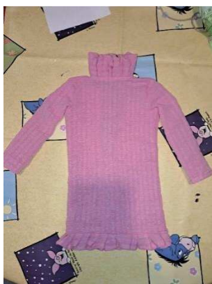
Slika 41. Završni izgled haljine

Na slici 41. vidi se kako sam na donji rub haljine sašila dodatak u obliku volana kako bi haljina izgledala ljepše. Za izradu volana nisam mjerila duljinu tkanine, već sam ga napravila prostoručno.