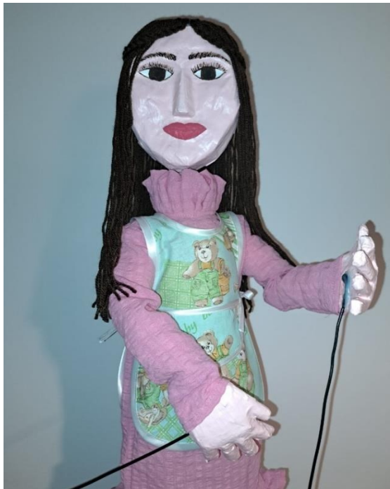
Slika 48. Konačni izgled lutke