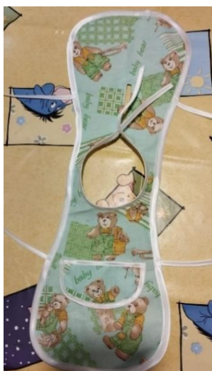
Slika 44. Završni izgled kute

Kutu sam obrubila bijelom vrpcom zašivši ju pomoću šivaće mašine. Od tkanine sam izrezala oblik džepića te sam ga također obrubila bijelom vrpcom i zašila za kutu lutke na odabrano mjesto. Bijele sam vrpce ostavila duže na vratu i na bokovima kako bi se mogle zavezati u mašne, a kuta lakše oblačiti (slika 44.).