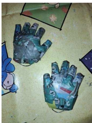
Slika 19. Kaširane šake

Šake sam kaširala na isti način kao i glavu, u 1:1 otopini vode i drvofiksa. Svaki sam dio šake prelijepila s barem tri sloja malih komadića novina (slika 19.) te sam ih ostavila da se osuše tjedan dana.