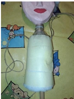
Slika 15. Izrada tijela

Na slici 15. vidi se kako sam oko boce omotala punjenje od jastuka kako bih dobila tijelo lutke. Pažljivo sam dodavala komadiće punjenja dok nisam bila zadovoljna oblikom i izgledom tijela lutke. Tijelo sam učvrstila tako da sam ga zalijepila pik trakom.