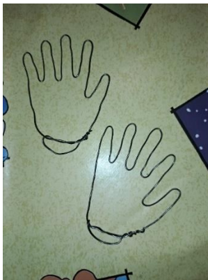
Slika 17. Šake od žice