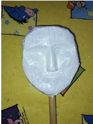
Slika 22. Bijelo obojena glava

Nakon što se glava dobro osušila, cijelu sam cijelu obojila s dva debela sloja bijele boje (slika 22.) kako se, nakon što lice obojim u boju kože, ispod boje ne bi ocrtavale novine. Boju kože dobila sam miješanjem bijele boje s malo crvene.