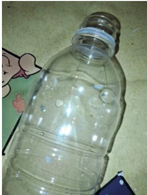
Slika 13. Boca s rupama

Uzela sam praznu bocu zapremnine pola litre te sam je prerezala škarama otprilike 2 centimetra iznad dna. Bušilicom sam na gornjem dijelu boce probušila dvije rupe jednu nasuprot drugoj kao na slici 13. na visini od oko 4 centimetra od vrha boce.