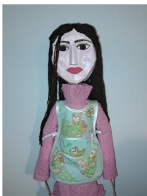
Slika 45. Kompletan kostim lutke

Na slici 45. vidi se kompletan kostim lutke: haljina i kuta.