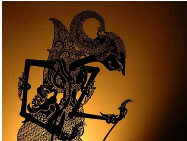
Slika 2. Lutka wayang kulit