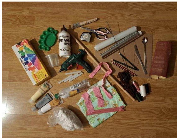
Slika 6. Pribor i materijal