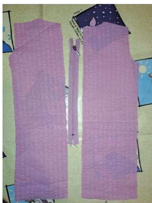
Slika 35. Stražnja strana haljine

Zatim sam izrezala i dvije polovice stražnje strane haljine (slika 35.) te sam pripremila patentni zatvarač u istoj boji za koji ću zašiti stražnje strane haljine.