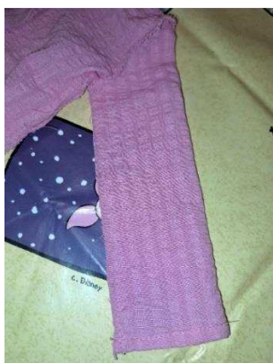
Slika 40. Šivanje rukava

Zatim sam na šivaćoj mašini zašila rubove haljine jedan za drugi, te sam također na šivaćoj mašini zašila stražnju za prednju stranu haljine i rukave (slika 40.).