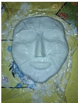
Slika 7. Lutkino lice od gline

Komad mase za modeliranje oblikovala sam nožićima i prstima dok nisam dobila željeni oblik lica moje lutke. Na slici 7. vidljivo je kako sam oko oblikovane mase za modeliranje omotala sam najlonsku foliju kako do gline ne bi dopiralo nimalo zraka.