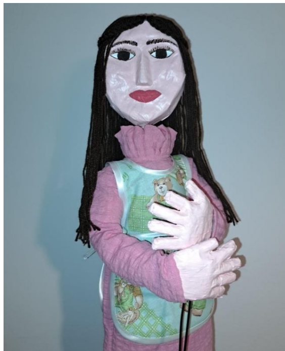
Slika 49. Konačni izgled lutke