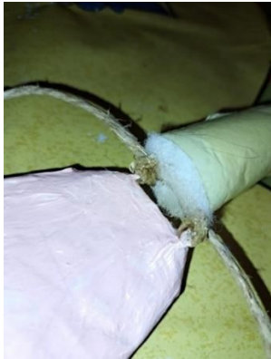
Slika 46. Spoj šake i podlaktice

Zglob koji spaja lutkinu šaku i podlakticu izradila sam tako što sam čvrsto zavezala špage iz podlaktice za žicu šake te sam taj spoj dodatno prešla vrućim ljepljivom za bolju potporu što je vidljivo na slici 46.