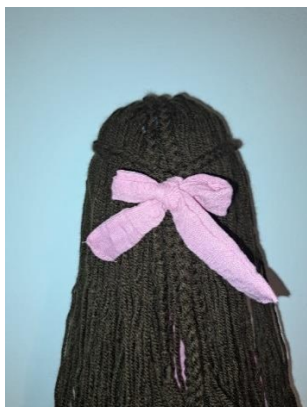
Slika 32. Mašna od vrpce za kosu

Od roze tkanine, iste tkanine koju sam koristila i za lutkinu haljinu, na šivaćoj mašini sam sašila vrpce za kosu kojom sam zavezala na čvoru pletenica u mašnu što je vidljivo na slici 32.