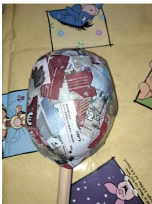
Slika 12. Kaširanje glave

Zadnju stranu glave kaširala sam na isti način kao i prednju stranu, svaki dio glave prelijepila sam s pet slojeva sitno otkinutih novina što se vidi na slici 12. Cijelu glavu ostavila sam da se posuši tjedan dana.