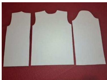
Slika 33. Skice dijelova haljine

Od papira sam izrezala okvirne skice dijelova lutkine haljine. Na slici 33. vidljive su skice polovice stražnje strane haljine (lijevo), prednje strana haljine (u sredini) te rukava haljine (desno).