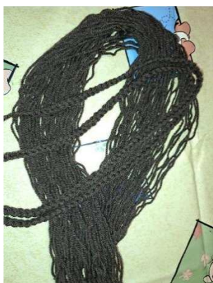
Slika 28. Sveukupna kosa