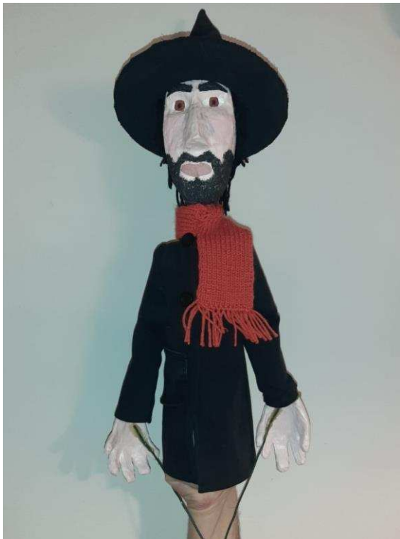
Slika 4. Javajka „Crni čovjek“

Tema za izradu lutaka javajki na kolegiju Metodika likovne kulture 1 za moju grupu bila je dječji roman Čudnovate zgrade šegrta Hlapića Ivane Brlić-Mažuranić. Lik kojeg sam ja izrađivala bio je „Crni čovjek“, glavni negativni lik romana. Završni izgled moje lutke javajke može se vidjeti na slici 4.