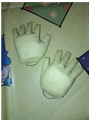
Slika 18. Šake od pik trake