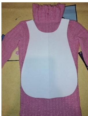
Slika 42. Skica kute za lutku

Na papiru sam nacrtala i izrezala okvirnu veličinu i oblik kute za odgojitelje za lutku kao na slici 42.