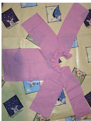
Slika 37. Spajanje dijelova haljine

Dijelove prednje strane haljine, stražnje strane i rukava koji se preklapaju sašila sam na šivaćoj mašini te sam dobila oblik koji vidimo na slici 37.