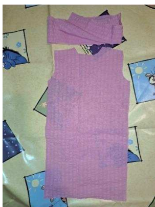
Slika 34. Prednja strana haljine

Kad sam se uvjerala da dimenzije skice odgovaraju tijelu moje lutke, prislonila sam papire na tkaninu te pažljivo izrezala jednu prednju stranu haljine i dugačku traku od koje ću napraviti vrpcu za kosu (slika 34.).