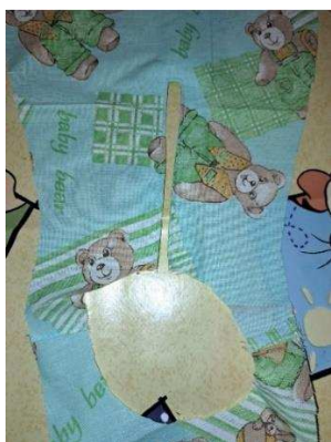
Slika 43. Oblik kute od tkanine

Kad sam se uvjerala da sam zadovoljna veličinom kute od papira, isti sam oblik izrezala od tkanine koju sam namijenila za izradu kute (slika 43.).