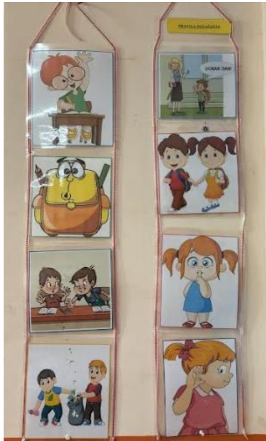
Slika 4. Pravila ponašanja u razredu Učiteljice I.

Učiteljica II: Imamo sedam pisanih i tri oslikana pravila. Pravila su predlagali učenici, a ja sam ih malo prilagodila. Osim klasičnog pravila podizanja ruke za riječ, definirali smo pravila ponašanja za vrijeme odmora i odnosa s drugima u razredu.