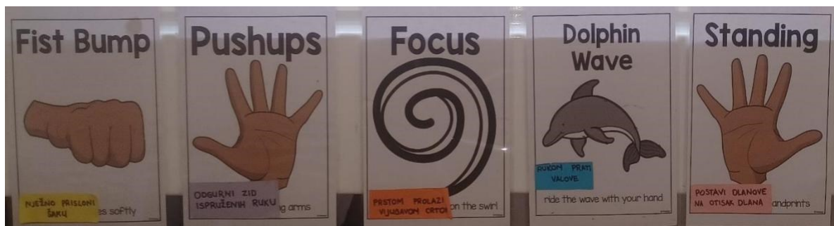
Slika 2. Primjer materijala u razredu Učiteljice III koji pomažu pri održavanju discipline i pažnje učenika.

urediti prostor tako da učenici imaju osjećaj sigurnosti i udobnosti, a učitelj mora postaviti svoje mjesto na poziciju koja će učenicima poručiti da je učitelj taj koji ima kontrolu (Cowley, 2006). Mignano, Romano i Weinstein (1993) naglašavaju da učitelj ima mogućnost učiniti prostor razreda takvim da on govori o karakteru učenika, prilagođen je njegovim potrebama i u njega postaviti materijale koji mogu olakšati upravljanje razredom. Tome odgovara Slika 2. Ona je primjer materijala koji pomaže pri upravljanju razredom. Ako dođe do remećenja discipline ili neprimjerenog ponašanja, učiteljica usmjerava učenika da ispuni zadatke koji se nalaze na materijalima sa slike. Zadaci su usmjereni na ponovno vraćanje fokusa na učenje i smirivanje učenika. Za Cowley (2006) prostor treba biti ispunjen različitim materijalima, igrama, bojama i sredstvima jer na taj način učenici stavljaju fokus na nešto pozitivno i stvara se ugodna radna atmosfera. Budući da je učenje osjetilno iskustvo, sljedeći element koji ne smije biti zanemaren je vizualna i tehnička opremljenost prostora.