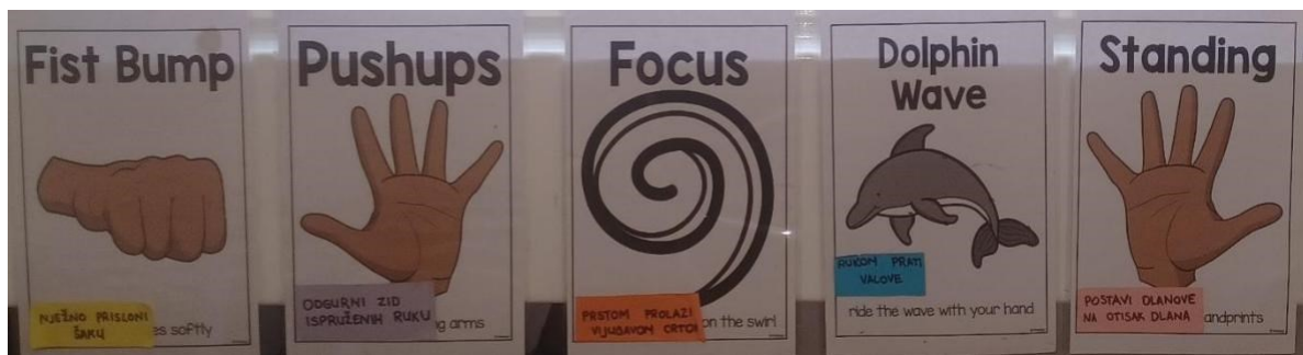
Slika 2. Primjer materijala u razredu Učiteljice III koji pomažu pri održavanju discipline i pažnje učenika. Izvor: osobna arhiva (3.5.2024.)

urediti prostor tako da učenici imaju osjećaj sigurnosti i udobnosti, a učitelj mora postaviti svoje mjesto na poziciju koja će učenicima poručiti da je učitelj taj koji ima kontrolu (Cowley, 2006). Mignano, Romano i Weinstei (1993) naglašavaju da učitelj ima mogućnost učiniti prostor razreda takvim da on govori o karakteru učenika, prilagođen je njegovim potrebama i u njega postaviti materijale koji mogu olakšati upravljanje razredom. Tome odgovara Slika 2. Ona je primjer materijala koji pomaže pri upravljanju razredom. Ako dođe do remećenja discipline ili neprimjerenog ponašanja, učiteljica usmjerava učenika da ispuni zadatke koji se nalaze na materijalima sa slike. Zadaci su usmjereni na ponovno vraćanje fokusa na učenje i smirivanje učenika. Za Cowley (2006) prostor treba biti ispunjen različitim materijalima, igrama, bojama i sredstvima jer na taj način učenici stavljaju fokus na nešto pozitivno i stvara se ugodna radna atmosfera. Budući da je učenje osjetilno iskustvo, sljedeći element koji ne smije biti zanemaren je vizualna i tehnička opremljenost prostora.