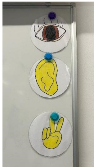
Slika 6. Primjer oslikanog pravila u razredu Učiteljice III.