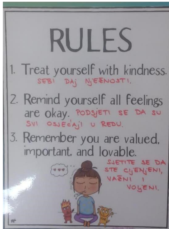
Slika 7. Primjer pravila ponašanja u razredu Učiteljice III.

Učiteljica III: Najčešće smo postavljali zajedno – kolegice s kojima radim i učenici. Pravila su proizlazila iz nekih situacija iz kojih su i oni mogli nešto naučiti ili zaključiti – zašto je nešto dobro, zašto nije. U razredu imamo četiri pravila. Cjeloživotno učenje traži da budemo i fleksibilni u pristupu vođenja razreda. Ne postoji savršen način za upravljanje učionicom i možda ćemo morati prilagoditi, promijeniti svoj pristup ovisno o potrebama svojih učenika i situaciji.