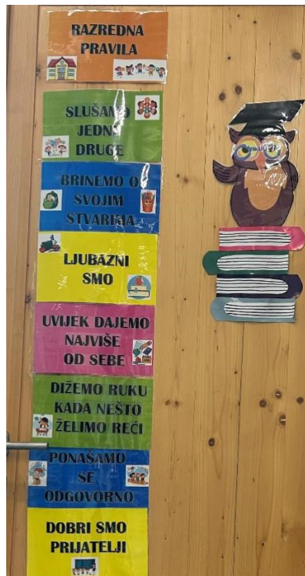
Slika 5. Primjer pisanog pravila u razredu Učiteljice II.