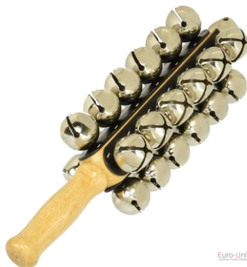
Slika 3 – Zvečke , preuzeto s: https://hr.izzi.digital/DOS/17246/datastore/10/publication/17246/pictures/2020/02/03/1580721080_1567874988_1562262402_1544566785_marakas_iStock-177810096.jpg?v=1711549227