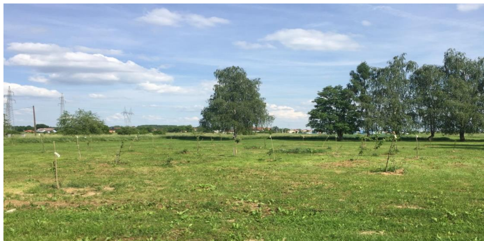
Slika 2. Voćnjak Osnovne škole Vukovina

Veliki vrtovi podrazumijevaju veće proporcije i u njima se mogu nalaziti drveće i grmlje te kako Grudiček (2005) navodi, vrtno-tehnički elementi kao što su kamenjari, putovi i staze po kojima se može šetati, vodene površine (npr. manje bare) kojima će se učenici moći koristiti za šetnju, odmor, igru ili kao prostor za učenje, spoznavanje novih sadržaja i ovladavanje novim vještinama. Škole osim manjih biljnih vrsta imaju grmlje i drveće koje je posađeno prije puno godina i sada već ima namjenu da učenicima stvara hlad ispred ili oko škole. Kao primjer navodi se Osnovna škola Vukovina koja je ove godine posadila voćnjak sa ukupno 26 sadnica te ima namjeru kroz idućih nekoliko godina, kada te sadnice porastu, sagraditi učionicu na otvorenom upravo u tom voćnjaku.