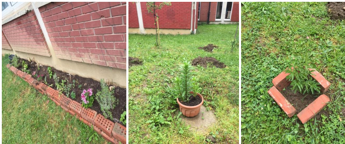
Slika 20. Školski vrt u međuprostoru Osnovne škole Eugena Kumičića

Od cvijeća imaju nešto trajnica, ali i nešto sezonskog cvijeća kao što su maćuhice i tulipani. Nedavno su posadili i začine od kojih se dio nalazi vani u visokoj gredici, a dio unutar škole (lavanda, ružmarin, smilje, metvica, timjan i melisa).