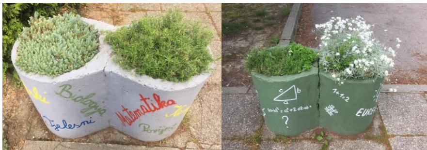
Slike 9. Žardinjere ispred Osnovne škole Vukovina