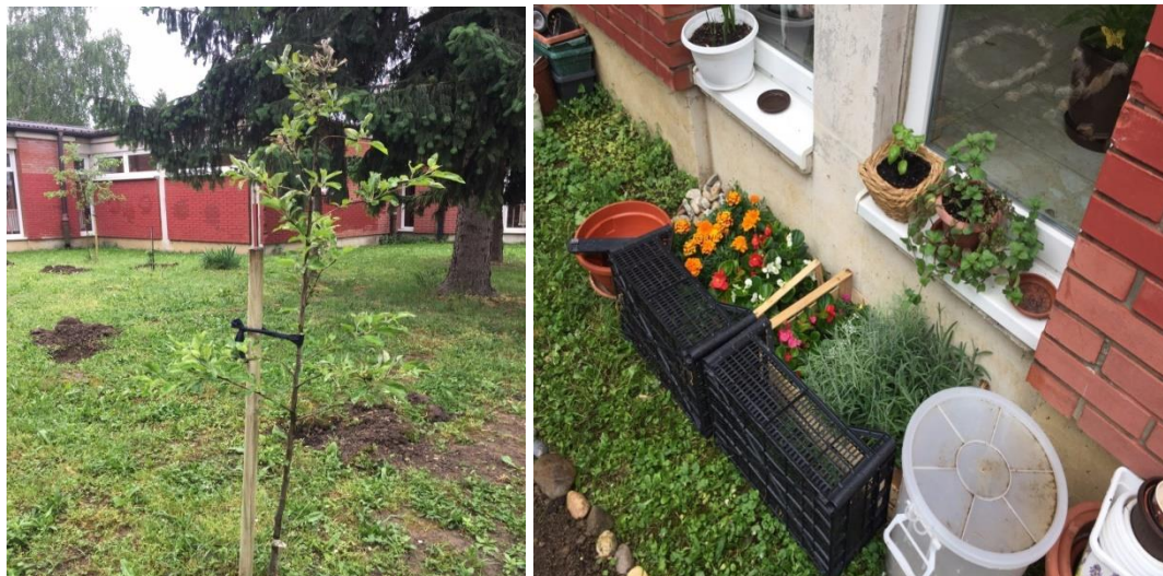
Slika 19. Školski vrt u međuprostoru Osnovne škole Eugena Kumičića