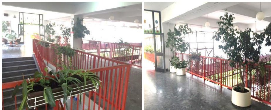
Slika 15. Živi kutić Osnovne škole Nikole Hribara