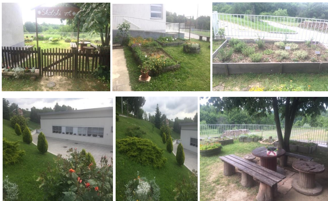
Slika 25. Školski vrt Osnovne škole Slavka Kolara, Kravarsko