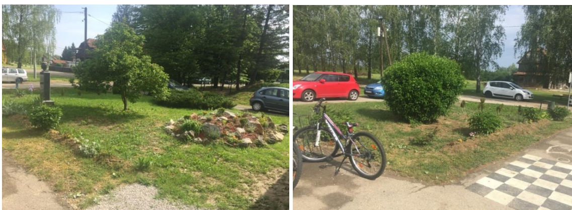
Slika 10. Cvjetnjak ispred Područne škole Buševac

U Područnoj školi Buševac , intervju je obavljen s učiteljicom Natalijom Bobesić te učiteljicom Dunjom Katulić koja je voditeljica cvjećarske grupe. Na lijevoj i desnoj strani od ulaza u školu nalazi se školski vrt, odnosno cvjetnjak kojeg razdjeljuje ulaz u školu.