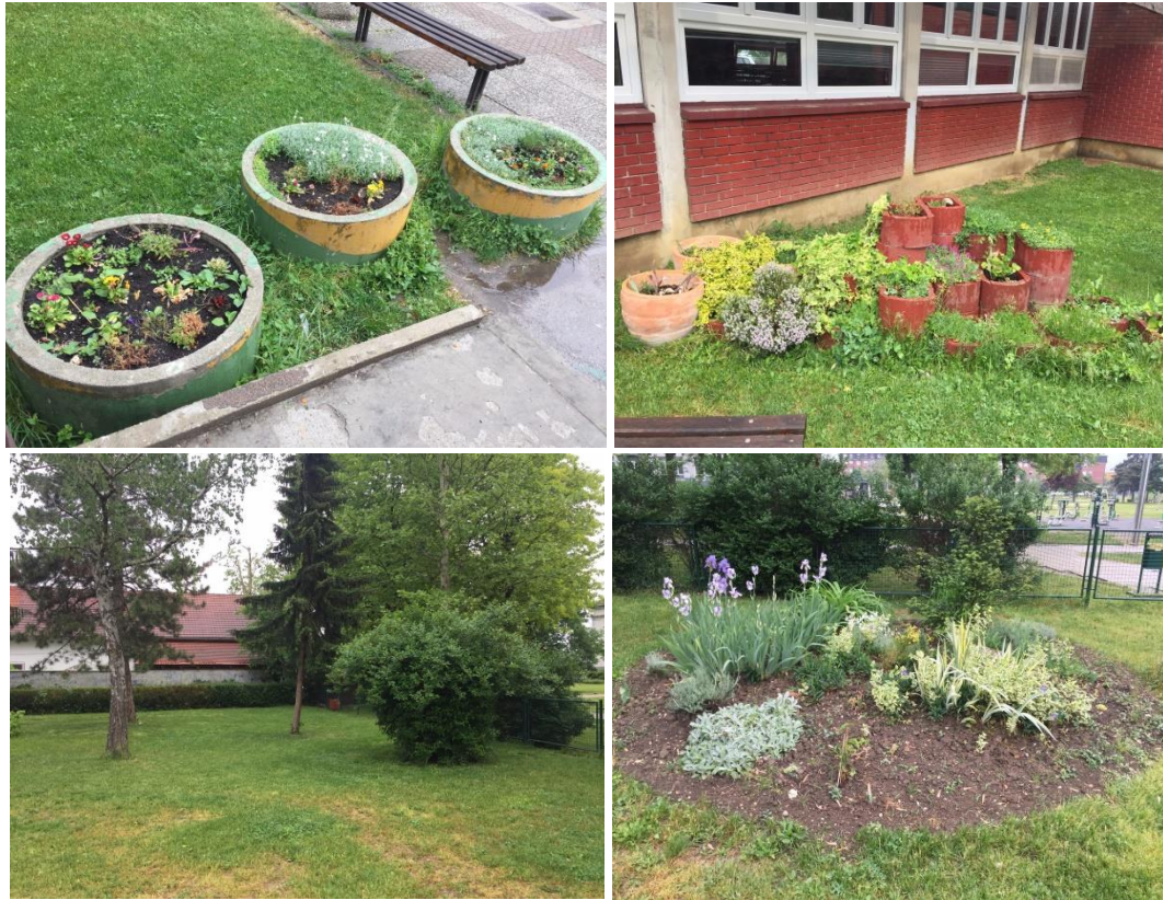
Slika 21. Školski vrt Osnovne škole Eugena Kumičića ispred škole

biljke. Učenici su iznimno aktivni i brzi te sami siju, sade, presađuju, zalijevaju i plijeve. Najveći problem koji imaju su učenici koji preko vikenda unište cvijeće. Nedavno im je uništen velik broj tulipana što djeluje demotivirajuće na učiteljice, ali i na učenike škole.