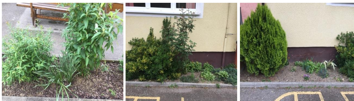
Slika 23. Cvjetnjak ispred Područne škole Dubranec

Područna škola Dubranec također je bila na edukaciji koju je provodio ZMAG u Vukomeriću i na popisu za europske fondove. Škola ima maleni cvjetnjak ispred ulaza u školu u kojem se nalaze maćuhice i druge trajnice, pustinjske ruže te različite vrste grmolikih biljki. Učenici u sklopu izvannastavne aktivnosti Cvjećari održavaju biljke. Nemaju konkretnu satnicu nego brinu o biljkama prema potrebama. Učiteljica Martina Mamić je izjavila kako trenutno nažalost nemaju uvjeta i prostora za proširenje. Nadali su se kako će dobiti sredstva od Europske Unije, ali to se nažalost nije ostvarilo.