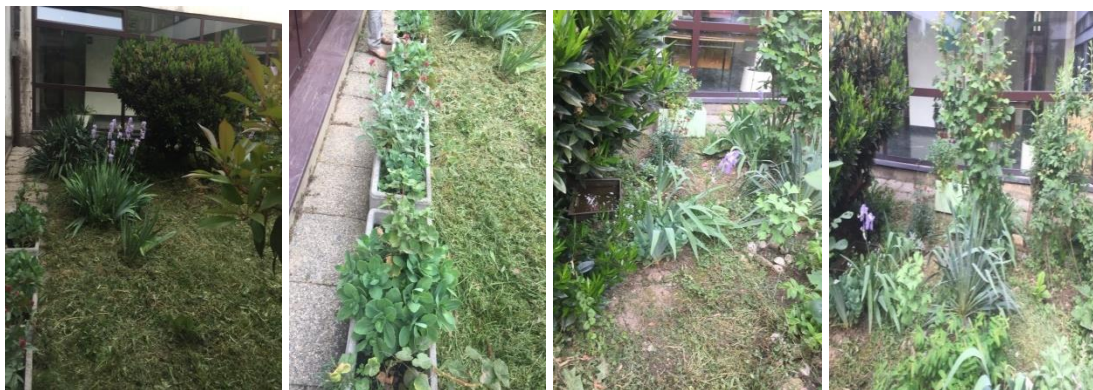
Slika 5. Školski vrt Osnovne škole Nikole Hribara