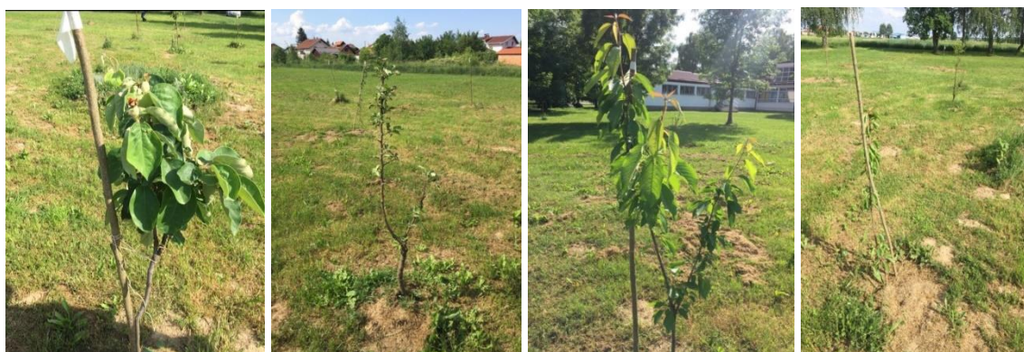
Slika 7. Voćnjak iza Osnovne škole Vukovina