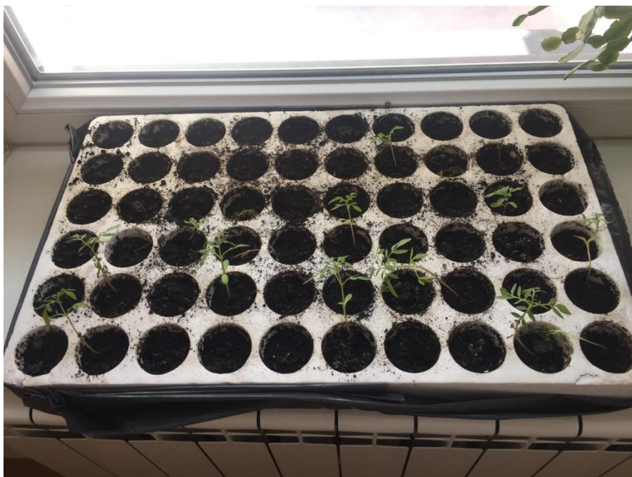
Slika 6. Primjer uzgoja vlastitih sadnica u Osnovnoj školi Novo Čiče Snimila: Božurić, V., 2018.

Razlog sadnje školskog vrta može biti i taj da učenici teorijska znanja spoznaju u praksi i da kroz praktične vježbe spoznaju nova teorijska znanja. Primjerice kod upoznavanja dijelova biljke važno je biljku, osim na slici, vidjeti i uživo te dodirnuti i proučiti svaki dio biljke kako bi učeniku bilo što jasnije kakva je građa biljke. Školski vrt kod učenika može pridonijeti i razvoju vještina i pozitivnih osobina ličnosti. Školski vrt pridonosi razvoju odgovornosti, discipliniranosti, upornosti, točnosti, preciznosti, razvoju osjećaja za lijepo, važnosti uloge biljnih vrsti za život čovjeka i njihovo očuvanje, razvoju timskog rada, suradnje, slušanja uputa i dr. (De Zan, 2015). Učitelj je taj koji bi učenike trebao poticati i motivirati za rad u školskom vrtu te omogućiti razvoj svih ovih osobina.