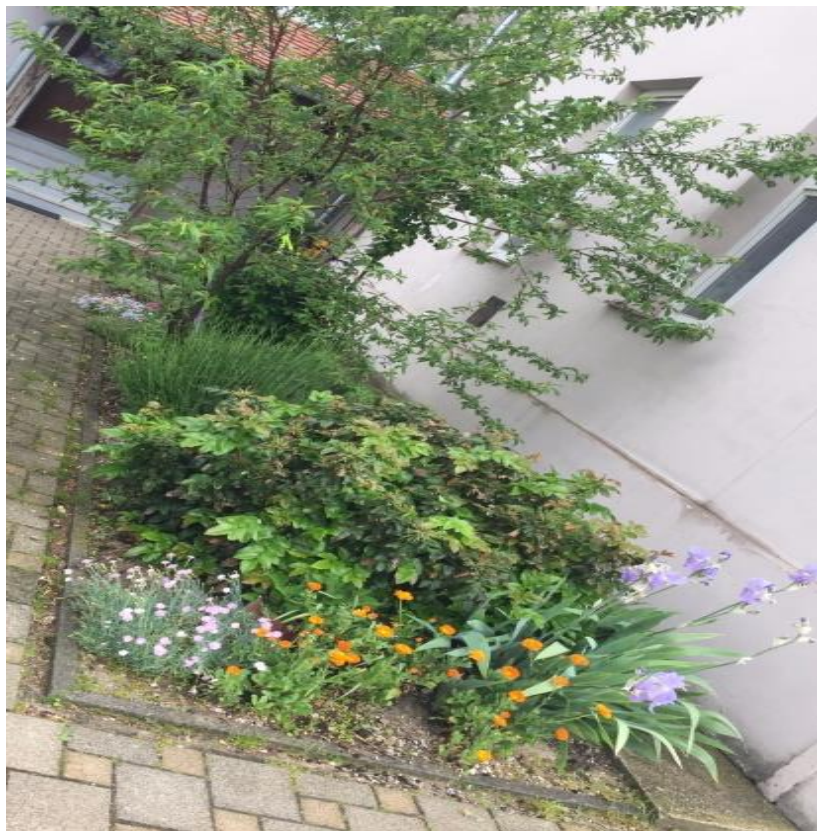
Slika 18. Cvjetnjak u Područnoj školi Donja Lomnica

maćuhice, potočnice, tulipani, lavanda i dr. Svo cvijeće su donirali roditelji, a u okolišu škole nalaze se i voćke (dvije breskve i jedna trešnja).