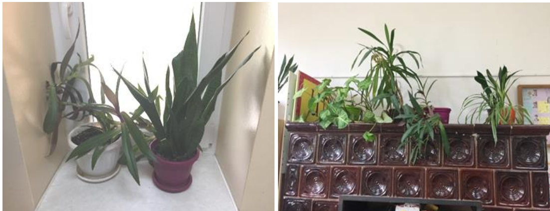
Slika 1.: Primjer živog kutića u Područnoj školi Lukavec

S obzirom na izgled i oblik školskog prostora, prilagoditi treba i biljke. Grudiček (2005) donosi podjelu vrtova na male i velike. Mali vrtovi se mogu oblikovati na način da imaju gredice (gredice s pozadinom koje mogu biti gredice s trajnicama, gredice s grmljem ili miješane gredice) koje imaju geometrijski izgled, nepravilan oblik, povišenu gredicu ili šljunčanu gredicu. Mali vrtovi se također mogu zasaditi na travnatim površinama tako da se na travnjak zasadi nekoliko solitera ili grmova. Isto tako biljke se mogu zasaditi na uzvišenim dijelovima uz pomoć penjačica na rešetkama, potpornjima ili tako da se ispred ili unutar škole postave posude i žardinjere u kojima će se zasaditi biljke. Manje škole koje nemaju mnogo vanjskog prostora, iskorištavaju unutarnji prostor, odnosno živi kutić u kojem uzgajaju biljke.