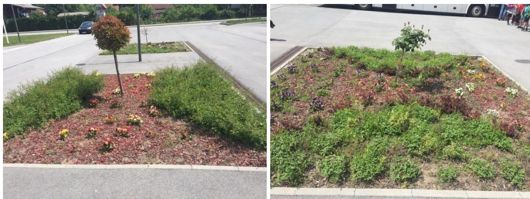
Slike 14. Cvjetnjak ispred Osnovne škole Novo Čiče