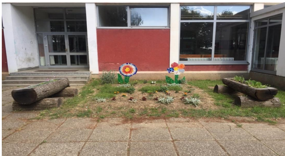
Slika 8. Cvjetnjak ispred Osnovne škole Vukovina

Profesor navodi kako je najvažniji razlog zbog kojeg se odlučio na sadnju voćnjaka ekološka prehrana djece jer će u idućih nekoliko godina djeca moći doći u voćnjak pod odmorom i ubrati voće za užinu koje će biti ekološki prihvatljivo i neće biti štetno za zdravlje. U sadnji su im najviše pomagali domari, pogotovo oko poslova gdje je bio potreban alat. Još jedan od razloga sadnje voćnjaka bio je i planiranje učionice na otvorenom. Kada voćke narastu, moći će svojim krošnjama stvarati hlad i tada će načiniti idealno mjesto za izgradnju učionice koja bi se mogla smjestiti na sredini voćnjaka. Profesor ističe kako veliku ulogu ima i ravnatelj koji je uvijek zainteresiran i prihvaća ovakve vrste projekata. Drugi dio školskog vrta čini cvjetnjak za koji je zadužena profesorica Biologije, a nalazi se lijevo od samog ulaza u školu.