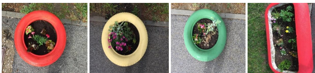
Slika 17. Cvjetnjak u Područnoj školi Gradići