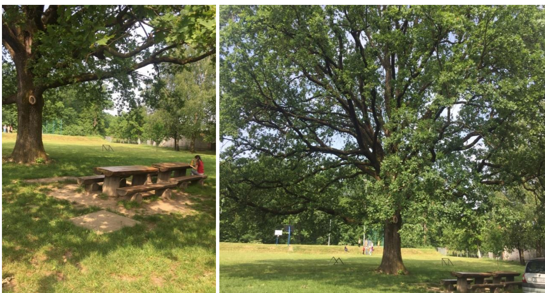
Slika 12. Učionica na otvorenom i hrast iza Područne škole Rakitovec

Djeca će plodove moći konzumirati, ali i ponijeti kući (posebno učenici slabijeg imovinskog statusa). Također će se posaditi i više vrsti od svake povrtnice (npr. rajčice) kako bi učenici spoznali da postoji više sorti određene vrste povrća. Ispod jabuke koja je stara preko 60 godina planiraju napraviti spiralnu gredicu u koju će posaditi začine koje su za sada u učionici: bosiljak, origano, menta, majčina dušica, matičnjak, mažuran, smilje, ružmarin, a planiraju im dodati i kamilicu. Ispred škole je i cvjetnjak koji je tamo već 30-ak godina te u njega planiraju dodavati i poneki cvijet po potrebi. Imaju i božur koji sada već broji i 30 godina. Imali su i grmove šimšira koje je napao moljac pa su ga morali iščupati, a pelin, koji su posadili prije nekoliko godina pojeli su puževi. Čemprese i smreku dobili su kao donaciju prije nekoliko godina. Iza škole nalazi se učionica na otvorenom i hrast koji je star preko 90 godina te orasi i jabuke koje broje već 30 godina.