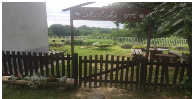
Slika 3. Školski vrt u Osnovnoj školi Slavka Kolara, Kravarsko – primjer školskog vrta s biljnim vrstama na jednome mjestu