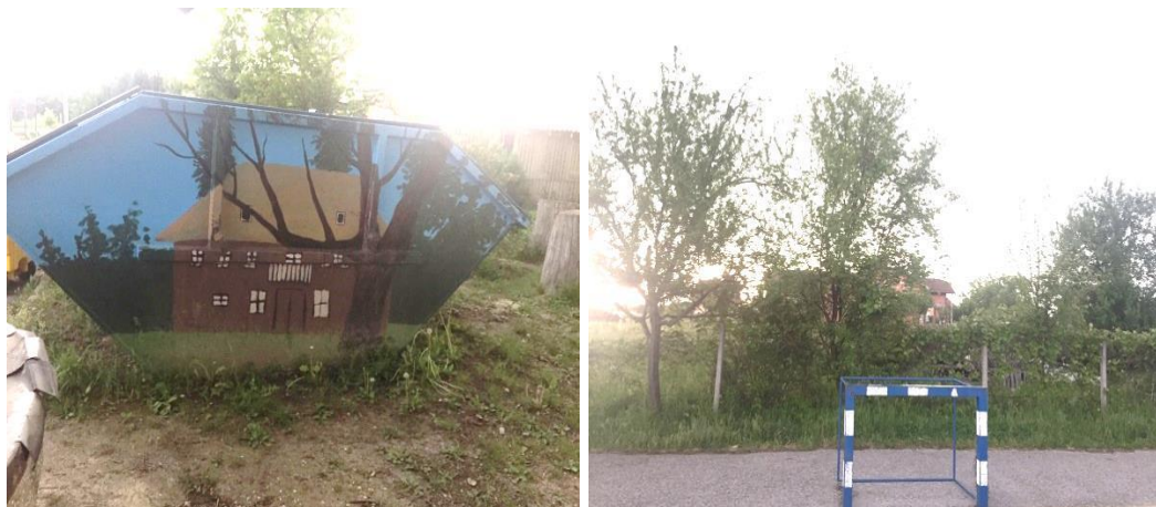
Slika 24. Komposter i školski vrt Područne škole Velika Buna

Buna ima jedan manji cvjetnjak u kojemu se nalaze jaglaci, tulipani, mućuhice, perunike, ruže, karanfili, sibirske potočnice i puzavice. Izbornu aktivnost nemaju nego o biljkama brinu za vrijeme Sata razrednika i za vrijeme obilježavanja Dana Jurjeva (s obzirom na to da im osnovna škola nosi ime Jurja Habelića). Prijašnjih godina su intenzivnije radili na stvaranju školskog vrta, a sada ga uglavnom samo održavaju. Biljke dobivaju kao donacije roditelja, a ove godine su posadili i nešto jagoda koje su uspjele. Također imaju i nekoliko voćki (šljiva kod igrališta, šipak iza nogometnog gola na igralištu), a namjera im je posaditi i jabuku. Svi učenici sudjeluju u brizi oko biljki, a nedavno su i oslikali komposter koji će im idućih godina služiti kao pomoć u uzgoju biljki. Učiteljica Melita Zagorec navodi kako se nada da će se idućih godina školski vrt prošiti još više te da će moći dodati i još neke nove vrste koje trenutno nemaju.