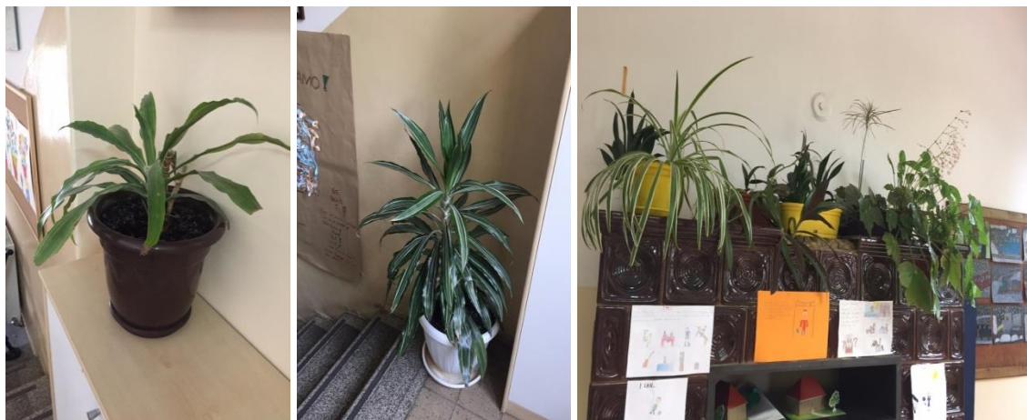
Slika 22. Živi kutić Područne škole Lukavec

njih jer nemaju dovoljno sredstava. Na prvom mjestu im je da kupe nove klupe jer ih nemaju dovoljno, a željeli bi kupiti i nove laptopove te bolje opremiti učionice.