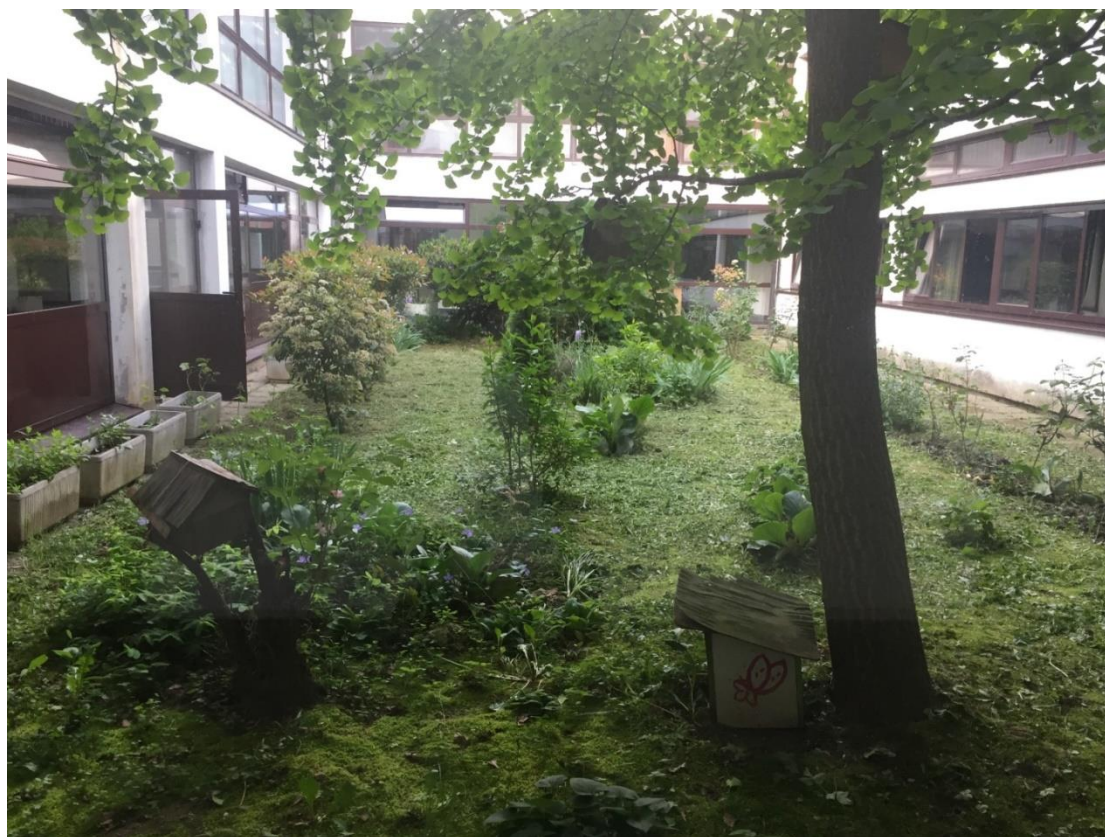
Slika 16. Školski vrt u međuprostoru Osnovne škole Nikole Hribara

Također su posadili i začinsko bilje od kojih se neko nalazi u učionicama, a drugo u međuprostoru škole: metvica, smilje, lavanda, menta. U međuprostoru škole nalaze se još: pustinjske ruže, potočnice, ruže, agava, forzicija, ginko, različite vrste grmolikog bilja i dr.