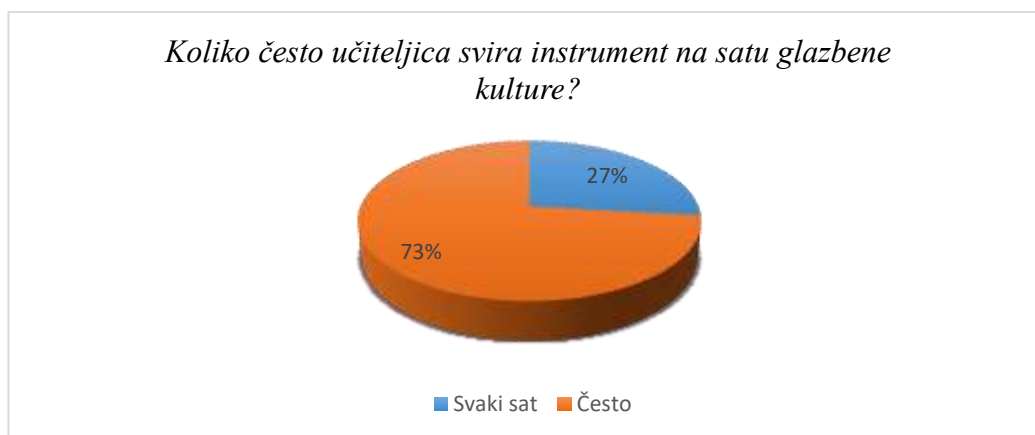
Slika 5. Učestalost učiteljevog sviranja instrumenta na satu glazbene kulture

Ispitanici ni u ovom pitanju nisu sakrili oduševljenje koje imaju prema nastavi glazbe. Gledajući prikaz (Slika 4.) primjećuje se da 89% učenika voli vidjeti i čuti sviranje instrumenta na satu glazbenog dok njih 11% to ne voli. Nažalost, od 4 škole, učiteljice samo dviju škola sviraju instrument na satu glazbene kulture. Ta je brojka poražavajuća, s obzirom na činjenicu da je za neku djecu redovna nastava jedino mjesto gdje se mogu susresti s instrumentima i učiti o vrijednosti i ljepoti sviranja instrumenta. Svaki je učitelj u toku svog fakultetskog obrazovanja bio osposobljen za sviranje jednog instrumenta, na razini koja je za sviranje u razrednoj nastavi dovoljna, stoga je otužno vidjeti brojku koja govori o tome koliko često učitelji u nastavi zapravo sviraju instrument.