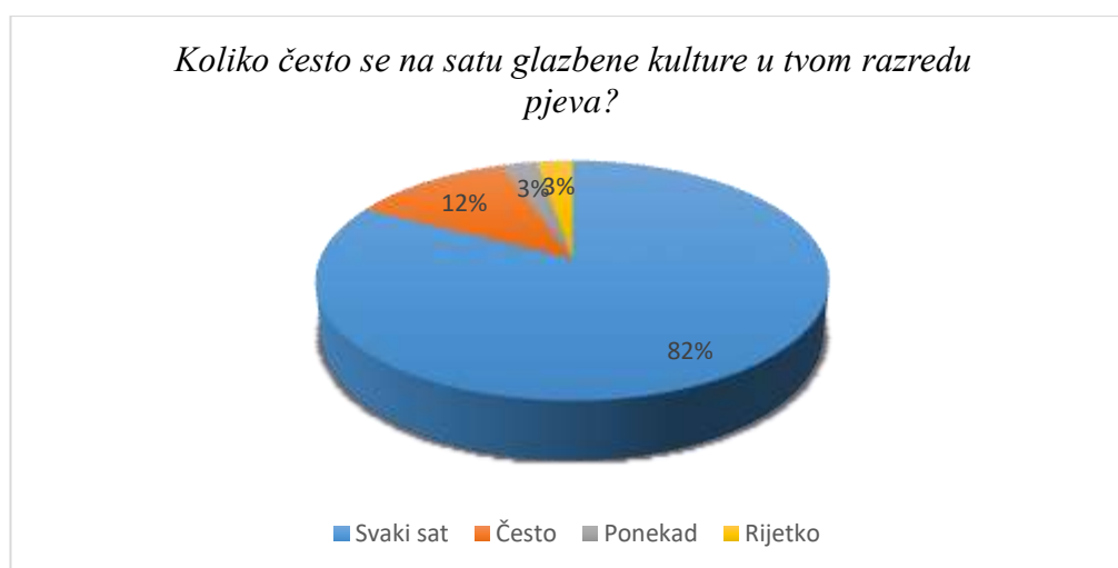
Slika 3. Učestalost pjevanja na satu glazbene kulture

Iz ovog prikaza (Slika 3.) može se zaključiti da je učiteljima, jednako kao i učenicima, omiljeno nastavno područje nastave glazbene kulture pjevanje. Budući da prema