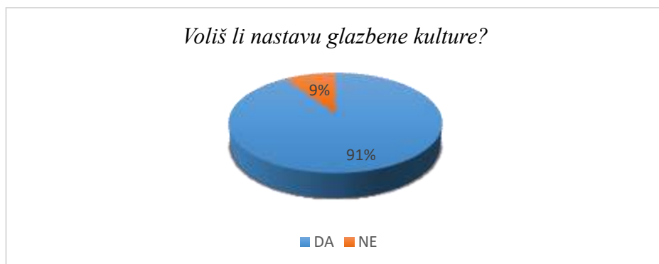
Slika 1. Ljubav prema nastavi glazbene kulture

Prema rezultatima dobivenima u anketama, iz prikaza (Slika 1.) se može vidjeti da 91% ispitanika voli nastavu glazbene kulture, dok svega 9% ispitanika nastavu glazbe ne voli. Ljubav prema glazbi opada tek u četvrtome razredu u kojemu je čak 29% ispitanika odgovorilo kako nastavu glazbene kulture ne voli. Razlog tome može biti zahtjevniji nastavni sadržaj koji se u tom razredu obrađuje ili promjena učitelja, budući da u četvrtome razredu nastavu glazbene kulture predaje nastavnik. Za razliku od četvrtog razreda, ispitanici u prva tri razreda drže konstantu u odgovorima te 96% ispitanika odgovara potvrdno na pitanje o ljubavi prema nastavi glazbene kulture. Ispitanici uglavnom gaje pozitivne osjećaje prema nastavi glazbene kulture. 78. 67% ispitanika izjavilo je kako se na nastavi glazbene kulture osjeća veselo. Razlozi zbog kojih ispitanici razvijaju uglavnom pozitivne osjećaje prema nastavi glazbe su razni, a najčešći su navedeni u grafu (Slika 2).