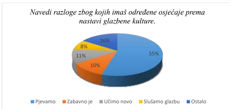
Slika 2. Razlozi pozitivnog stava prema nastavi glazbene kulture

Prema rezultatima dobivenima u anketama, iz prikaza (Slika 1.) se može vidjeti da 91% ispitanika voli nastavu glazbene kulture, dok svega 9% ispitanika nastavu glazbe ne voli. Ljubav prema glazbi opada tek u četvrtome razredu u kojemu je čak 29% ispitanika odgovorilo kako nastavu glazbene kulture ne voli. Razlog tome može biti zahtjevniji nastavni sadržaj koji se u tom razredu obrađuje ili promjena učitelja, budući da u četvrtome razredu nastavu glazbene kulture predaje nastavnik. Za razliku od četvrtog razreda, ispitanici u prva tri razreda drže konstantu u odgovorima te 96% ispitanika odgovara potvrdno na pitanje o ljubavi prema nastavi glazbene kulture. Ispitanici uglavnom gaje pozitivne osjećaje prema nastavi glazbene kulture. 78. 67% ispitanika izjavilo je kako se na nastavi glazbene kulture osjeća veselo. Razlozi zbog kojih ispitanici razvijaju uglavnom pozitivne osjećaje prema nastavi glazbe su razni, a najčešći su navedeni u grafu (Slika 2).