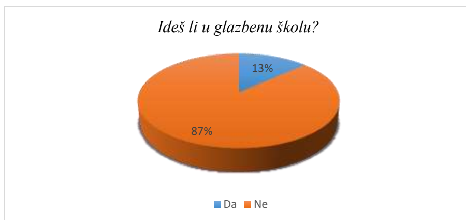
Slika 9. Pohađanje glazbene škole

Iz grafa (Slika 9.) se iščitava podatak da svega 13% učenika pohađa glazbenu školu. To je ukupno 10 od 75 ispitanih učenika. Od tih 10 učenika, njih troje u glazbenoj školi svira klavir, po dvoje gitaru i violončelo, a po jedno violinu, saksofon i harmoniku. Na pitanje zašto idu u glazbenu školu njih petoro odgovorilo je da voli svirati taj instrument, četvero voli pjevati, a dvoje je reklo kako želi naučiti svirati određeni instrument.