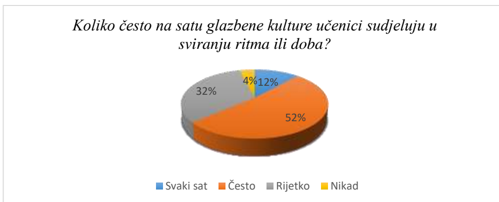
Slika 6. Učestalost učeničke aktivnosti u nastavnom području sviranja

12% učenika svira na svakom satu glazbene kulture (u vidu sviranja ritma i doba); često to radi 52% ispitanika, 32% njih reklo je da na satu svira rijetko, a 4% nikad. Prema rezultatima anketa, ova se aktivnost najrjeđe provodi u prvom razredu; čak 64. 71% ispitanika odgovorilo je kako rijetko svira na satu glazbene kulture, a za prvim razredom slijedi četvrti razred u kojem 58. 83% ispitanika odgovara isto.