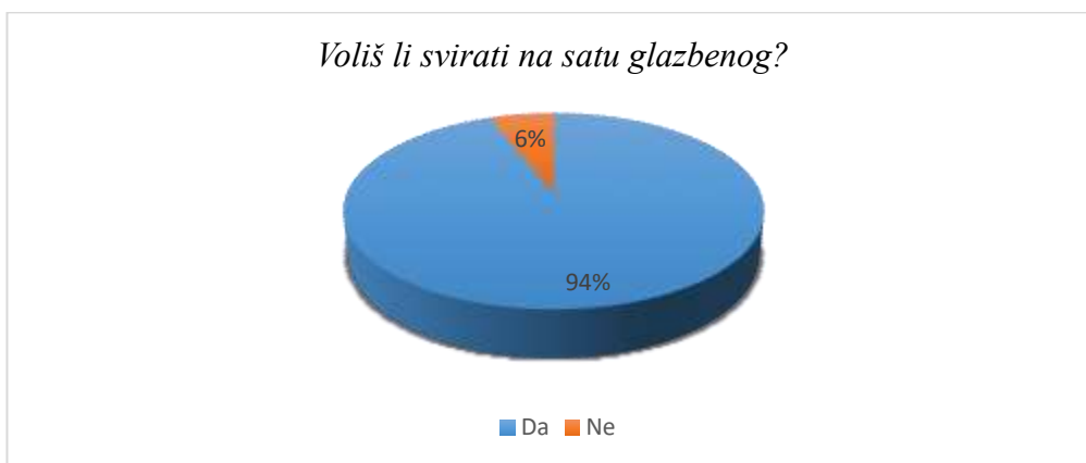
Slika 7. Osjećaji učenika prema sviranju na satu glazbene kulture

12% učenika svira na svakom satu glazbene kulture (u vidu sviranja ritma i doba); često to radi 52% ispitanika, 32% njih reklo je da na satu svira rijetko, a 4% nikad. Prema rezultatima anketa, ova se aktivnost najrjeđe provodi u prvom razredu; čak 64. 71% ispitanika odgovorilo je kako rijetko svira na satu glazbene kulture, a za prvim razredom slijedi četvrti razred u kojem 58. 83% ispitanika odgovara isto.