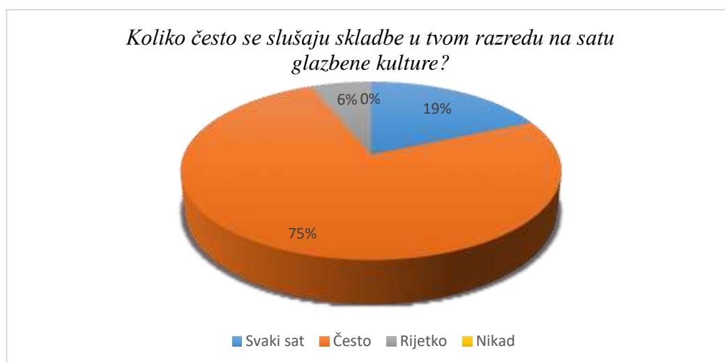
Slika 8. Učestalost slušanja skladbi na satu glazbene kulture

Nastavno područje slušanja i upoznavanja glazbe jedino je obvezno nastavno područje u nastavi glazbene kulture prema Nastavnom planu i programu. 19% ispitanika odgovorilo je kako svaki sat slušaju skladbe, njih 75% često, a 6% rijetko. Glazbeni pedagozi zagovaraju slušanje skladbi na svakom satu glazbene kulture te ga danas smatraju neizostavnim dijelom sata glazbene kulture jer kažu da učenici samo slušanjem glazbe mogu dobro upoznati glazbu te stvoriti kritičko mišljenje prema njoj.