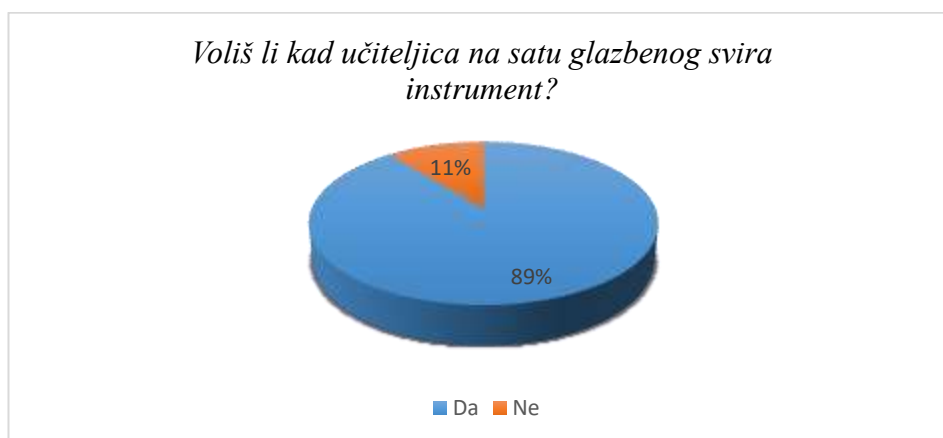
Slika 4. Učestalost učiteljevog sviranja instrumenta na satu glazbene kulture

Ispitanici ni u ovom pitanju nisu sakrili oduševljenje koje imaju prema nastavi glazbe. Gledajući prikaz (Slika 4.) primjećuje se da 89% učenika voli vidjeti i čuti sviranje instrumenta na satu glazbenog dok njih 11% to ne voli. Nažalost, od 4 škole, učiteljice samo dviju škola sviraju instrument na satu glazbene kulture. Ta je brojka poražavajuća, s obzirom na činjenicu da je za neku djecu redovna nastava jedino mjesto gdje se mogu susresti s instrumentima i učiti o vrijednosti i ljepoti sviranja instrumenta. Svaki je učitelj u toku svog fakultetskog obrazovanja bio osposobljen za sviranje jednog instrumenta, na razini koja je za sviranje u razrednoj nastavi dovoljna, stoga je otužno vidjeti brojku koja govori o tome koliko često učitelji u nastavi zapravo sviraju instrument.