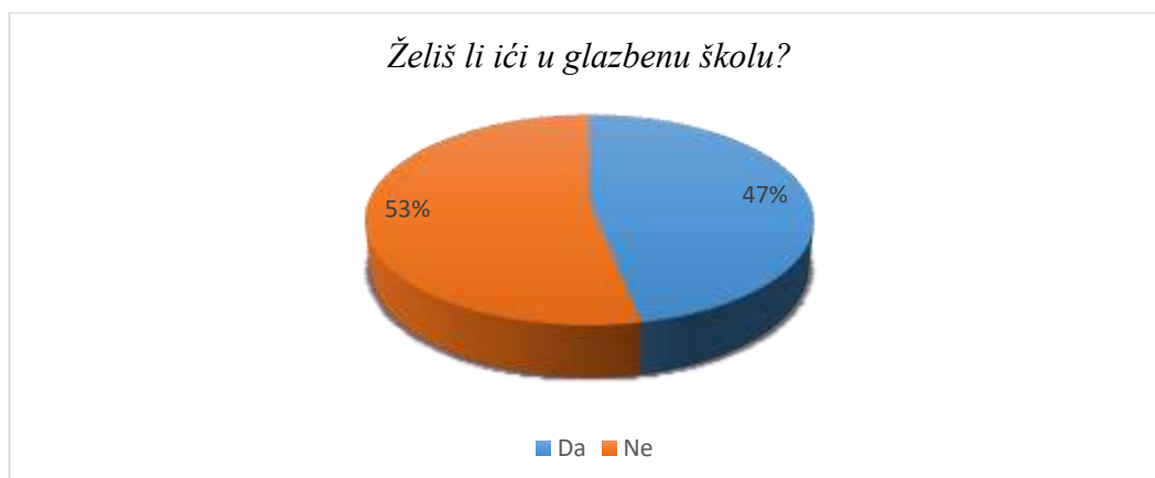
Slika 10. Želja za pohađanjem glazbene škole

U željama za pohađanjem glazbene škole postotci su gotovo izjednačeni. 47% ispitanika koji ne pohađaju glazbenu školu izrazilo je želju za pohađanjem, a 53% to ne bi htjelo.