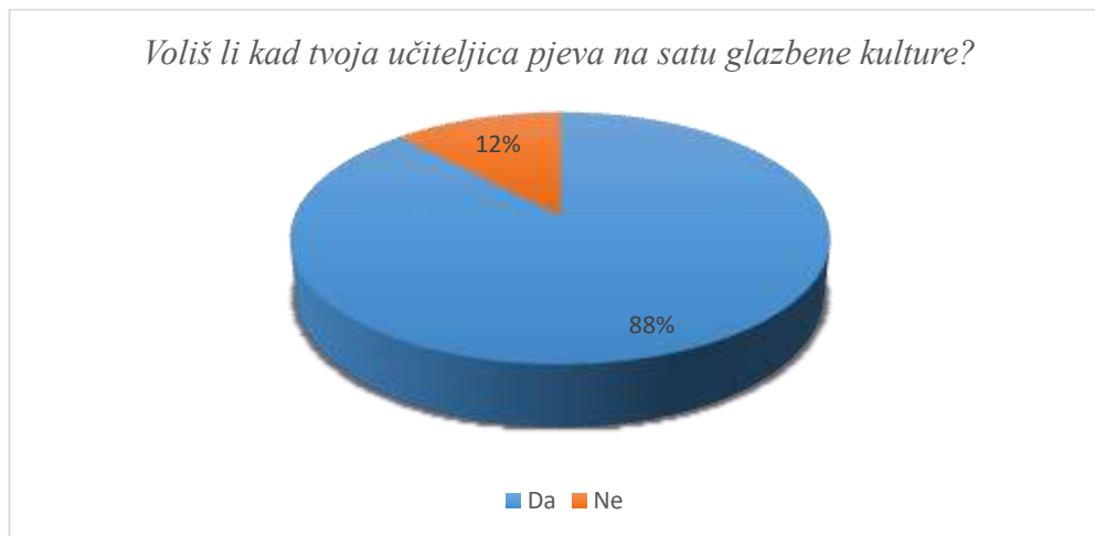
Slika 4. Osjećaji prema pjevanju učitelja u nastavi glazbene kulture

Učenici u većinskom broju uživaju kad su njihovi učitelji, u ovom slučaju učiteljice, također aktivni u nastavi pa stoga 88% ispitanika voli kada učiteljica pjeva na satu glazbene kulture, a 12% učenika tu aktivnost ipak ne voli. U prva tri razreda učenici u gotovo maksimalnom postotku izražavaju ljubav prema učiteljičinom pjevanju, dok u četvrtom razredu, kada (kao što je već spomenuto) ljubav prema nastavi glazbene kulture opada, čak 41% ispitanika odgovara na ovo pitanje negativno.