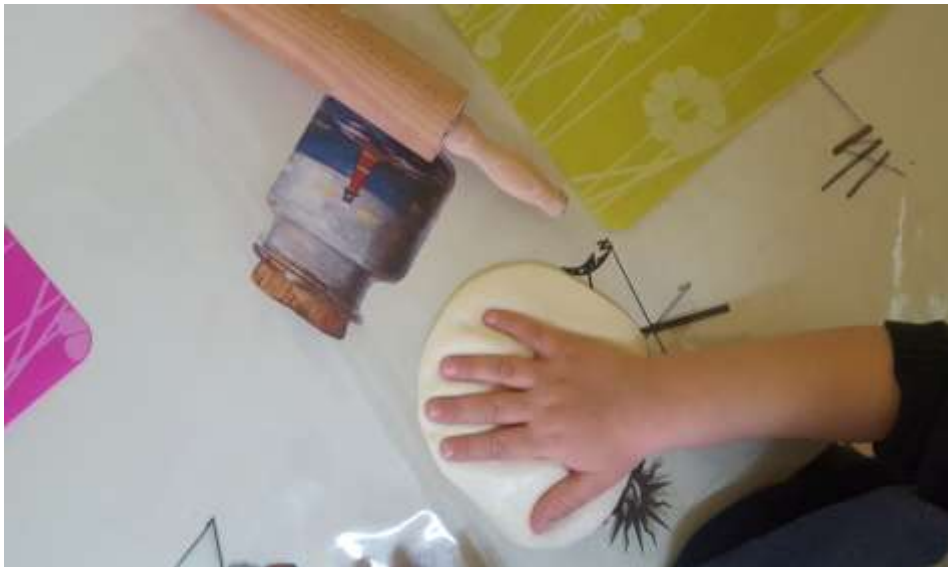
Slika 14. Otisak dlana u manjoj masi slanog tijesta