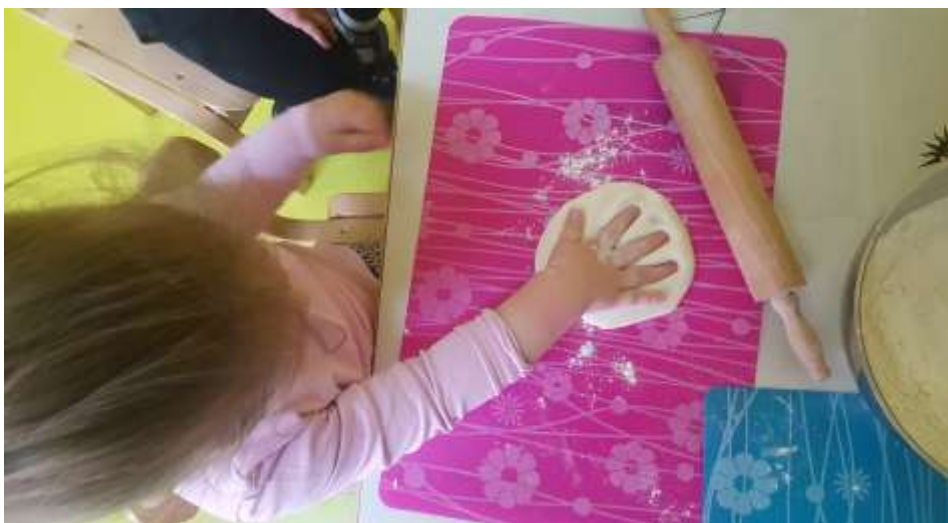
Slika 15. Prikaz ruke u slanom tijestu