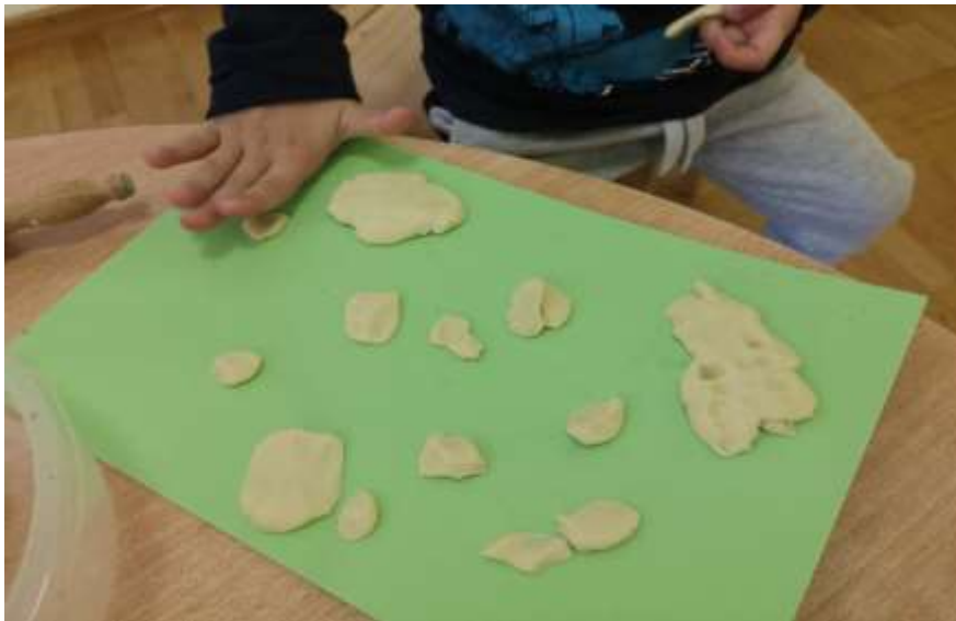
Slika 11. Pritiskanje tijesta s dlanom