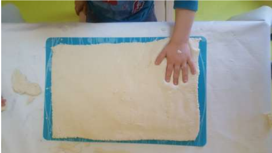
Slika 13. Otiskivanje dlana na velikoj masi slanog tijesta