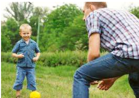
Slika 5. i 6. Roditelji i djeca u sportu.