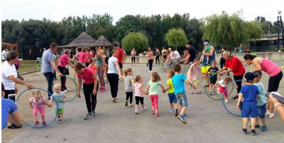
Slika 4. Mladi i stari u tjelesnoj aktivnosti.

Uzmimo da zdravlje predstavlja optimalno do barem prihvatljivog stanja cijelog organizma te funkcije svih sustava ljudskog organizma, dok prema WHO (svjetskoj zdravstvenoj organizaciji) zdravlje nije samo odsustvo bolesti ili oronulosti već stanje potpunog tjelesnog, psihičkog i socijalnog blagostanja. Mnoga istraživanja pokazuju da je primjerena tjelesna aktivnost učinkovita u unapređivanju i zaštiti zdravlja te kao takvo nezamjenjivo sredstvo za održavanje istog, u ova moderna vremena. Tjelovježba ima pozitivan učinak na ljudsko biće kroz čitavu povijest: "Mišićna aktivnost je bila važna za evolucijski razvoj, jednako je važna i za razvoj pojedinca. Najvažnija je u ranoj fazi, fazi djetinjstva." (Prskalo, 2004). Ipak, važno je razlikovati igru od vođene tjelesne aktivnosti i nadalje, bavljenje nekim sportom. Djecu treba pažljivo uvoditi u neku konkretnu sportsku aktivnost na način da dotična bude prilagođena djetetovoj zrelosti i tjelesnim sposobnostima jer bavljenje sportom ima i drugu stranu, a to je da se dijete može osjetiti manje vrijednim ako je manje uspješno od svojih vršnjaka te fizičke ozljede.