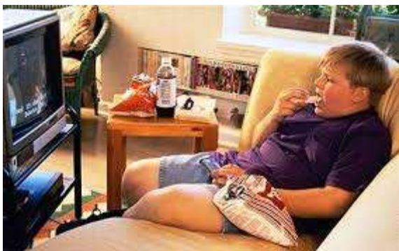
Slika 3. Neaktivnost + nezdrava prehrana = dječja pretilost!

Iako nam je znanost, s modernizacijom društva putem razvoj tehnologije, olakšala život te ga učinila udobnijim, s druge strane nam je ugroženo psiho-fizičko zdravlje. Zbog navedenih znanstvenih postignuća, razina tjelesne aktivnosti nam je niska (i kod odraslih i kod djece) te se smatra uzrokom raznih bolesti. Ako uzmemo u obzir i nezdrave prehrambene navike, rezultat je katastrofalan = razna oboljenja kao posljedica pretilosti (od tromboze, oboljenja mišićno-koštanog sustava, oboljenja krvožilnog sustav, problem u dječjoj posturi, metabolički poremećaji itd.)! Navedeno se da spriječiti i tu nastupaju roditelji. Oni su dužni usaditi djetetu zdrave životne navike pošto imaju najveći utjecaj na njega, odnosno dječje slobodno vrijeme ovisi o izboru roditelja pa tako ti isti roditelji ne smiju zanemariti tjelesnu aktivnost bez obzira na svoje psiho-fizičko stanje uvjetovano raznim vanjskim utjecajima (posao, međuljudski odnosi itd.).