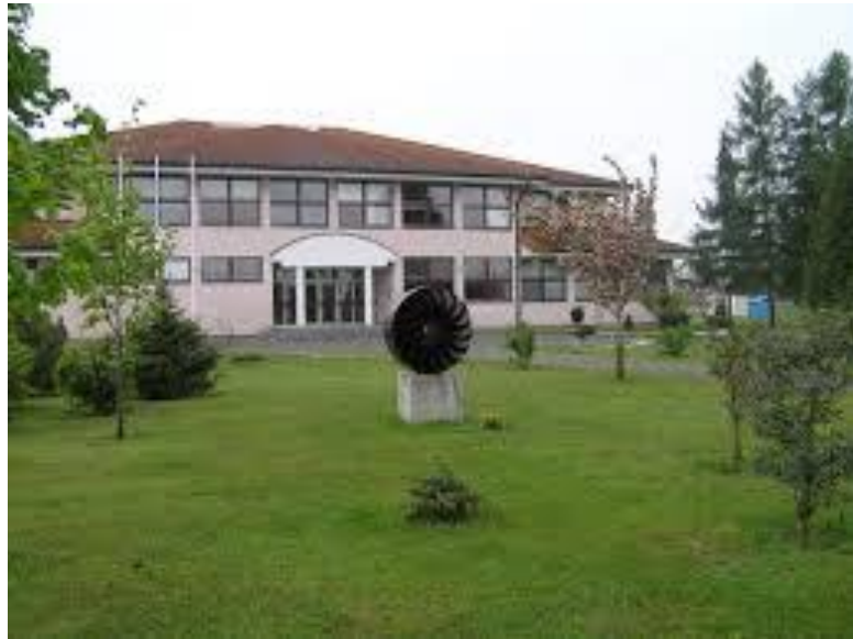
Slika 5. Osnovna škola Ivanovec (os.Ivanovec.skole/hr)

opetovnica, tečajna nastava za učenike koji su završili 4 razred dva puta tjedno. Provodila se sve do II. svjetskog rata, točnije 1941. Osmogodišnje obrazovanje učenika počelo se provoditi od 1955. g. Te je godine otvorena i školska kuhinja. Za nastavu su se koristile prostorije zadrugnog doma. Odlukom skupštine grada Čakovca, OŠ Ivanovec je 1967. pripojena OŠ M. Puštek Čakovec (današnja II. osnovna škola).