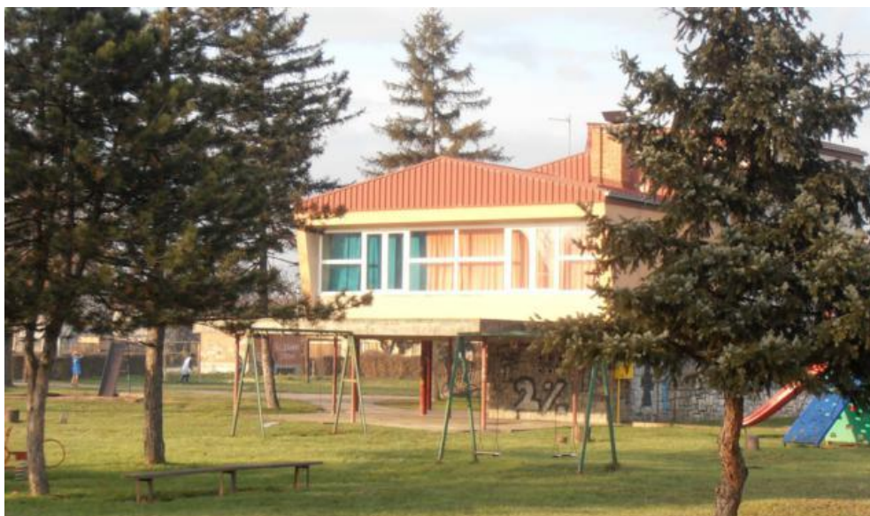
Slika 3. Dječji vrtić Pčelice (www.dvck.hr/pcelice)

Ovaj je vrtić sagrađen sada već daleke 1982. godine. Zgrada ima poseban prostor koji se sastoji od dviju soba za dječji boravak, hodnika, kuhinje i sobe za odgajatelje i sanitarnih čvorova.