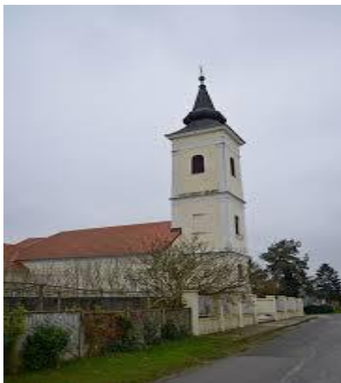
Slika 6. Crkva u Ivanovcu