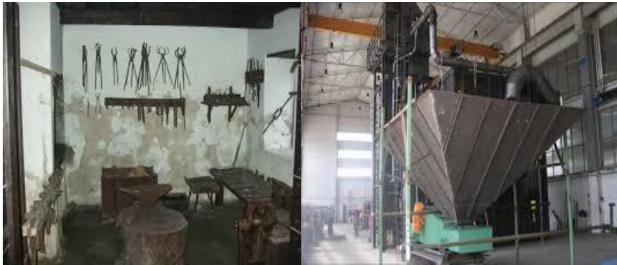
Slika 2. Razlika gospodarstva nekada i sada

U poslove obrta spadalo je tkanje domaćeg platna od obrađivanog lana i konoplje. To je bio dosta kompliciran i dugotrajan posao. Takvih obrtnika bilo je nekoliko. Šusteri su popravljali obuću koja se nabavljala na sajmu. Obrtnički radovi i razni popravci obavljali su se unutar sela i domaćinstva. Sve je bilo jednostavnije i skromnije.