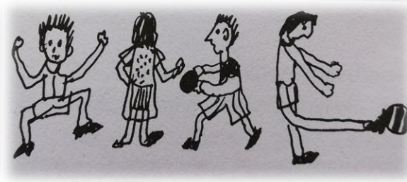
5. Prikaz crteža čovjeka