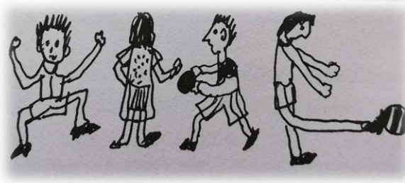
5. Prikaz crteža čovjeka