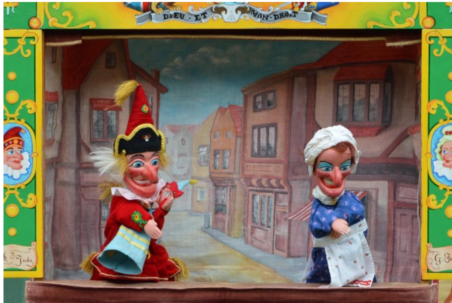
3. slika: Punch and Judy 4

Autor Henryk Jurkowski u svome djelu Povijest europskog lutkarstva (2005) navodi kako se na početku 19. st. pojavio novi lik, izdanak komedije ručne lutke. Bio je to „Guignol“ koji je danas kod nas sinonim za ručnu lutku.