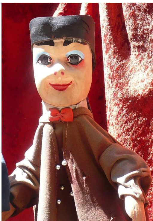
1. slika: Guignol 2

2009:17). U predstavama su se pojavljivali stalni protagonisti. Obično je glavni karakter bio muški lik koji je bio lukav, domišljat, snalažljiv, komičan, prgav, lijen i slično, no pozadina tog lika je bila mnogo složenija jer je on zapravo zastupao narod i njegove potrebe te je zato bio omiljen među pukom. Lik kao takav izmamio bi osmijeh na licima publike gdje god bi se pojavio, prkosio je bilo kakvoj vlasti, ugnjetavanju i nepravdi, a zbog toga je vrlo često bio i proganjan od istih. Ako uzmemo u obzir povijesni repertoar pučkih predstava i njihovih protagonista, vidimo da postoji puno karakternih i idejnih sličnosti, samo si se mijenjala imena likova. U Italiji imamo, najpoznatijeg Pulcinellu , koji je u Engleskoj postao Punch . Slični su navedenim karakterima i njemački Hanswurst , a kasnije Kasperl , ruska Petruška , a u Francuskoj se pojavljuje Polichinelle te potom Guignol (Županić Benić, 2009).