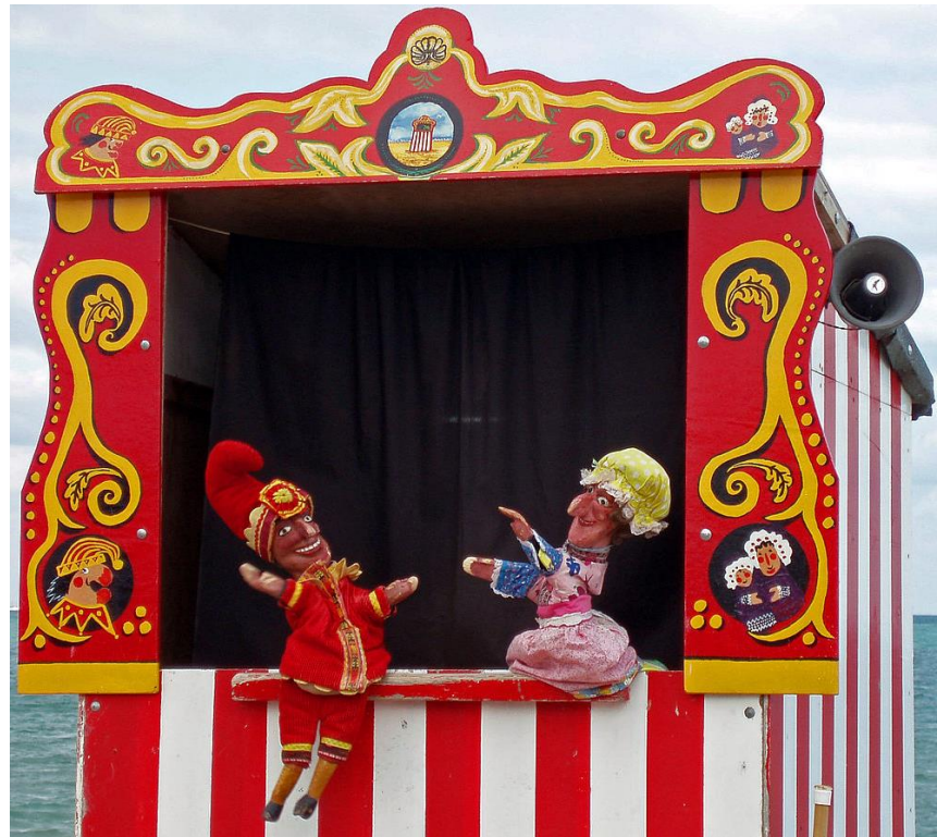
5. slika: Pozornica za ginjole 6

Lutkarska pozornica ( booth ) za ručne lutke je visoka i ima prozor koji je smješten iznad lutkareve glave. Pozornica za ginjole se nalazi na vrhu prednjeg paravana, a lutke se pojavljuju na scenu odozdo te jednako tako i odlaze. Okvir scene je najčešće ukrašen i ima zastor koji se pomiče na početku predstave i zatvara na kraju. Obično se s donje strane okvira nalazila daska na koju bi lutka mogla ostaviti neki rekvizit. S unutarnje strane paravana, postavljene su kukice kako bi lutkar mogao objesiti lutke koje mu nisu u tom trenutku potrebne na sceni. Unutar ove „lutkarske kutije“ nema puno prostora, stoga se unutra obično nalazio jedan lutkar koji je animirao različite likove (Županić Benić, 2009).