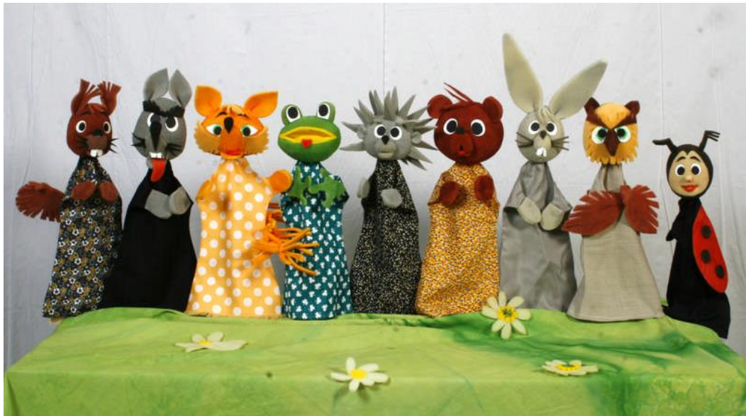
4. slika: Ginjol lutke 5

karikirani, no to nije zakonitost koju treba slijepo slijediti. Osoba koja lutku pokreće određuje kakva će ona biti i dodjeljuje joj karakter. Važan je položaj ruke, ritam hoda i intonacija glasa. Osnova kostima je rukavica s tri prsta. Kostim lutke treba biti jednostavan tj. neupadljiv kako bi do izražaja došle ruke i lice. Duljina kostima koji je navučen na ruku glumca lutkara trebala bi sezati gotovo do lakta. Ako želimo da lutka ima trbuh može se napraviti kostim čiji je prednji dio dvostruk, poput džepa, pa se može ispuniti vatom. Ista stvar je i za grbu na leđima. Kostim se izrađuje od tkanine koja je mekana i podatna kako bi glumac lutkar nesmetano mogao pokretati lutku (Županić BeniĆ, 2009).