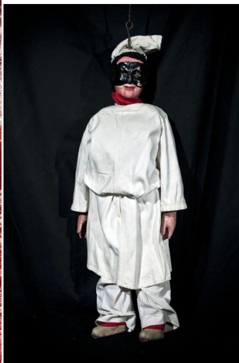
2. slika: Pulcinella 3