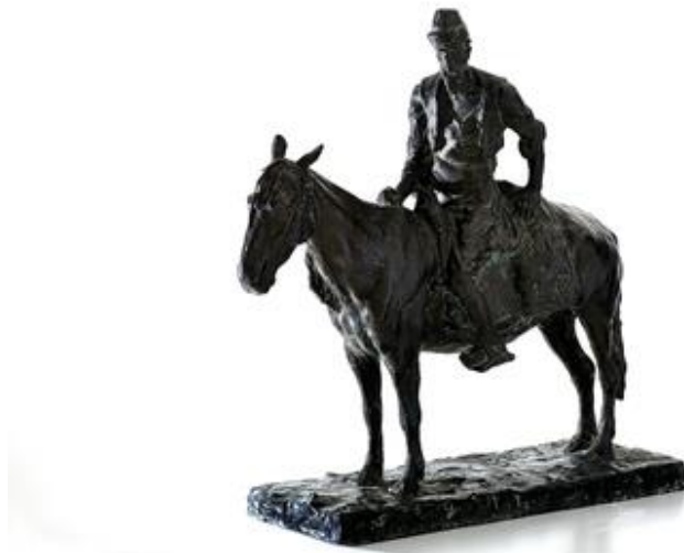
Slika 1. Branislav Dešković, Turčin na konju 1

slikovni materijal, odnosno prikaz skulpture Branislava Deškovića, a na dječji likovni izražaj utjecat će i proživljeno iskustvo životinje.