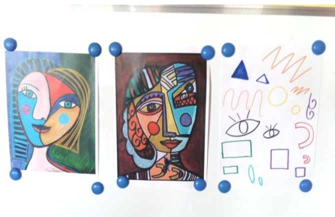
Slika 1. Poticaj

Kako bih uvela djecu u aktivnost i motivirala ih za daljnji razgovor i suradnju, pripremila sam poticaje. Poticaji su se nalazili na ploči na kojoj su bile imitacije djela portreta glave žene Pabla Picassa. Za poticaj sam stavila i papir na kojem su bile nacrtane linije sa raznim linijama i oblicima sa kubističkih kompozicija.