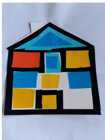
Slika 21. Dječak L.A. „Ovako će izgledati moja kuća.“