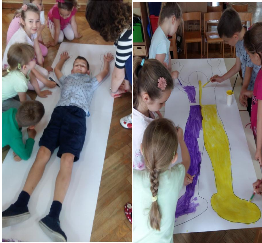
Slika 11. Slikanje ljudskog lika u pokretu, ljubičasta-žuta