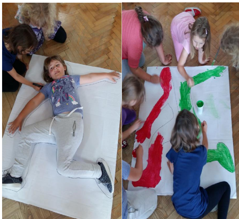
Slika 13. Slikanje ljudskog lika u pokretu, crvena-zelena