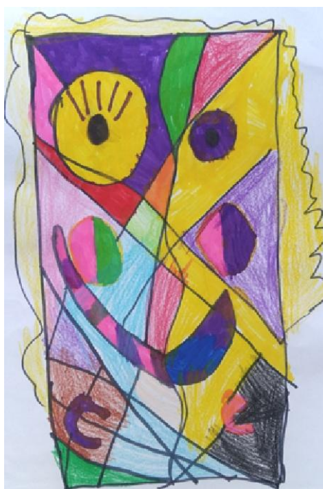
Slika 6. Djevojčica A.A. „Ja sam ovoj ženi nacrtala plavu kosu, tako da izgleda kao moja mama.“