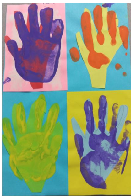
Slika 29. Dječak N.A. „Meni se moj rad baš sviđa jer je jako šaren i boje su jedna preko druge.“