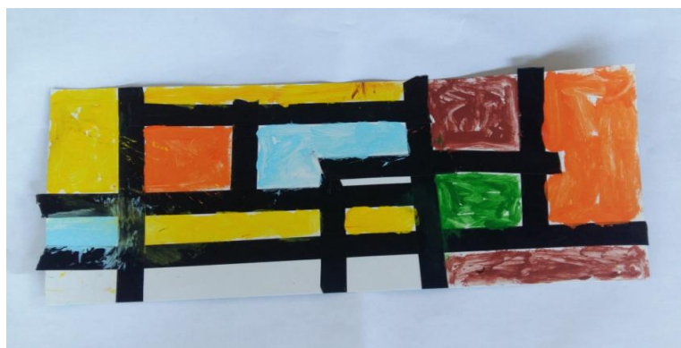
Slika 20. Dječak K.I. „Meni se moj rad baš sviđa, a najviše mi se sviđa kako sam zalijepio crnu traku.“