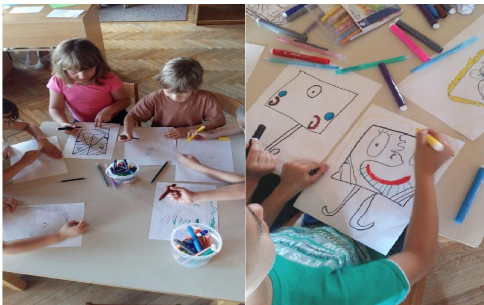
Slika 2. Tijek procesa, pastele i flomasteri

Nakon uvodnog dijela aktivnosti i razgovora o umjetniku i prikazanim slikama, djeca su pristupila individualnom radu. Pastele i flomasteri su ponuđene likovne tehnike koje su djeca imala na izbor te su krenula u realizaciju likovne aktivnosti. Na ploči su ostavljeni poticaji spomenutih djela Pabla Picassa.