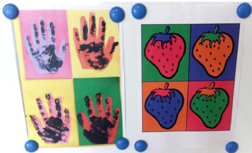
Slika 23. Poticaji

Aktivnost je započeta promatranjem reprodukcija djela Andya Warhola. Kao poticaji su prikazana dva primjera kojima je cilj bio djeci objasniti što su to kontrasti.