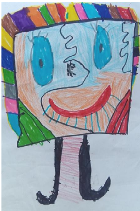
Slika 7. Dječak L.B. „Meni je na mom radu najljepša kosa i sviđa mi se crveni ruž koji sam nacrtao ovoj gospođi.“