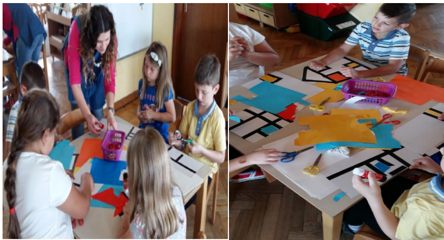
Slika 17. Tijek procesa, kolaž papir

dobili izolir traku pomoću koje su povlačili crne linije. Djeca su mogla sama odabrati koju likovnu tehniku žele koristiti u svom radu. Obradovalo ih je što na korištenje imaju izolir traku i sve boje te su krenuli stvarati svoja umjetnička djela.