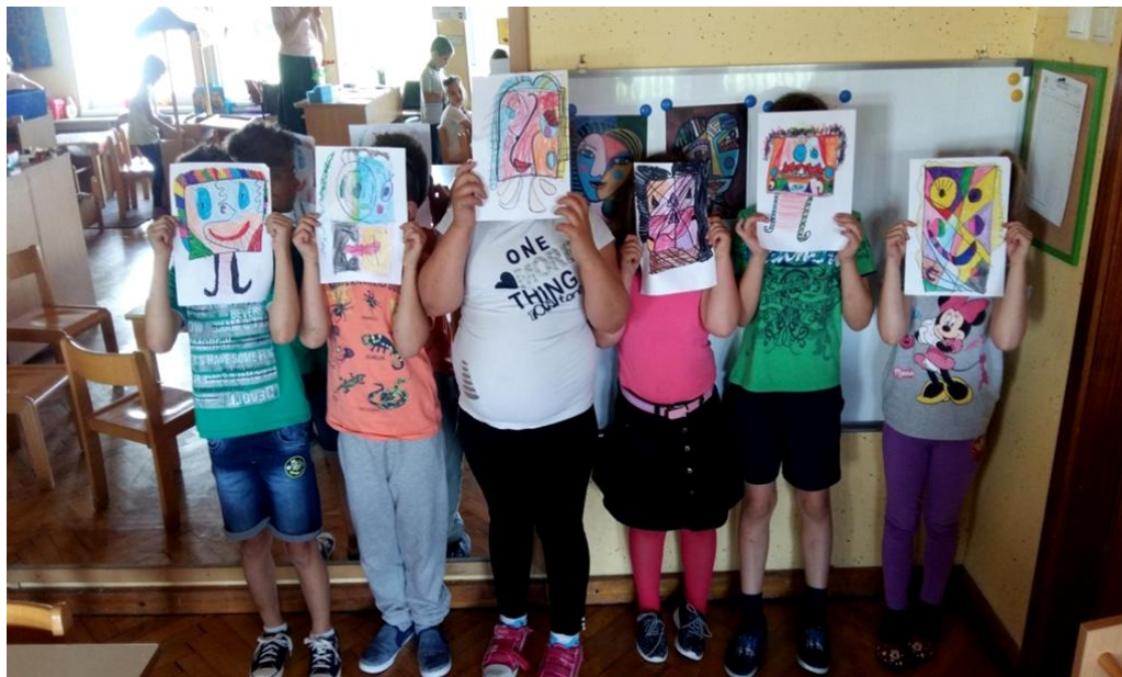
Slika 9. Izložba dječjih radova

Ideja djece je bila izabrati najljepše radove te su uslikani tako što su stavili svoje nacrtane portrete glave preko svoje prave glave.