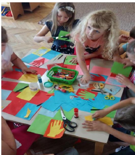
Slika 24. Tijek procesa, izrezivanje kolaž papira

Nakon uvođenja djece u aktivnost razgovorom, započela je izrada likovnih radova. Prethodno im je objašnjeno što će raditi. Pri izradi su koristili kolaž papir i tempere kojima su na kraju otisnuli svoje ruke. Tijekom izrade su neka djeca trebala malu pomoć pri izrezivanju.