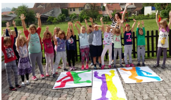
Slika 15. Izložba dječjih radova uz djecu u pokretu