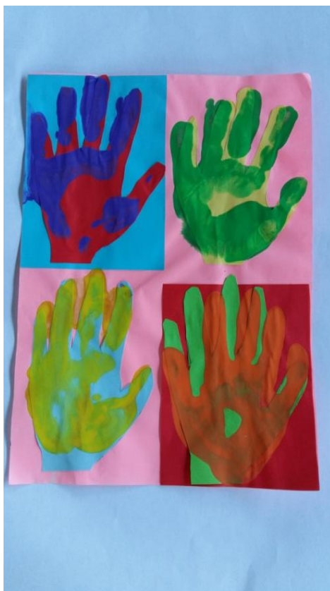
Slika 26. Djevojčica S.A. „Moj likovni rad je meni najljepši.“