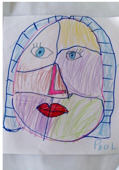
Slika 4. Djevojčica P.Č. „Ja sam nacrtala plave oči, tako da budu iste kao i moje.“

Djeca su pokazala veliko zanimanje i pozitivno pristupila radu. Rad sa flomasterima i pastelama im je bio i od prije poznat, stoga nije bilo nikakvih poteškoća tijekom izrade radova. Tijekom izrade djeca su zajedno komentirala svoje radove, pomagali su jedni drugima te je vladala opuštena atmosfera.