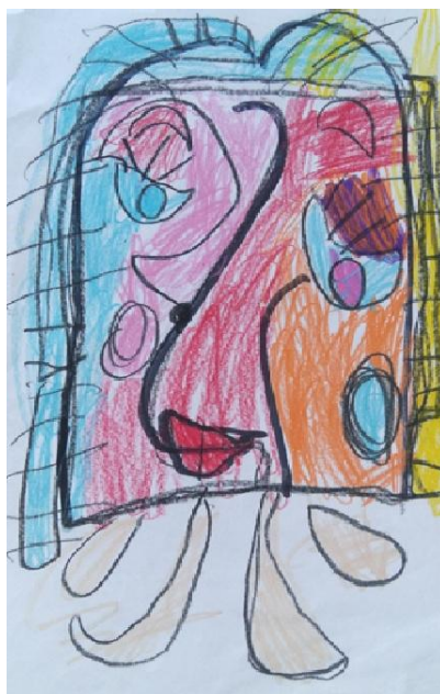
Slika 5. Djevojčica A.M. „Ja sam počela crtati kao pravi Picasso, meni je moj rad ljepši od njegovog.“