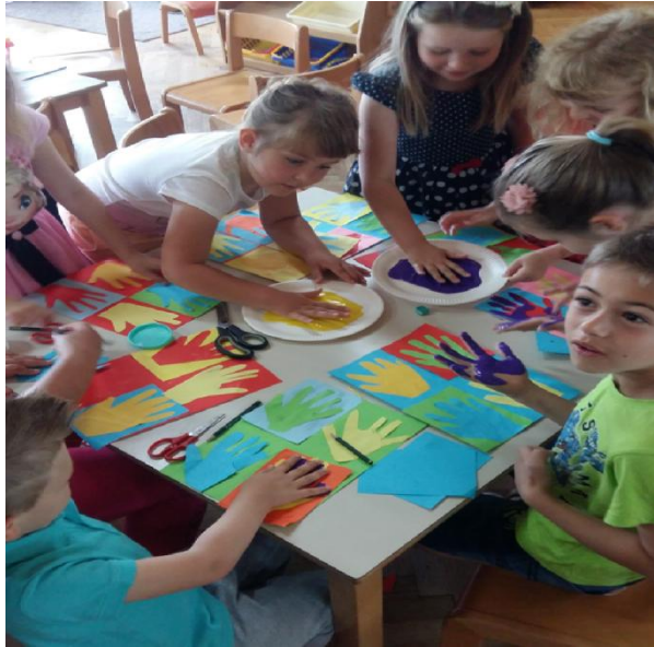
Slika 25. Tijek procesa, otiskivanje