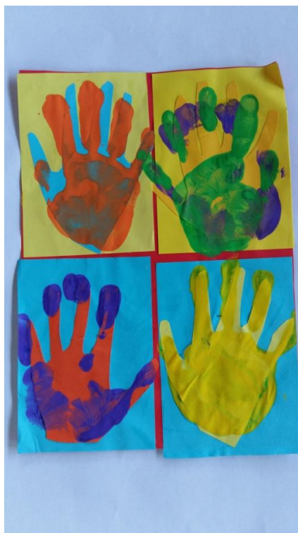
Slika 28. Dječak M.P. „Kada pogledam svoj rad vidim da su moje ruke zapravo baš velike.“