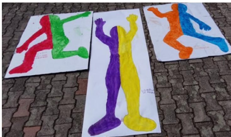
Slika 14. Izložba dječjih radova