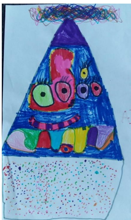
Slika 8. Djevojčica R.S. „Moja glava ima pet šarenih očiju.“