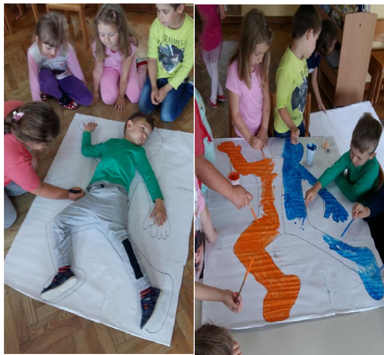
Slika 12. Slikanje ljudskog lika u pokretu, narančasta-plava