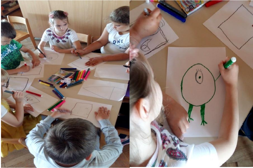
Slika 3. Tijek procesa, flomasteri