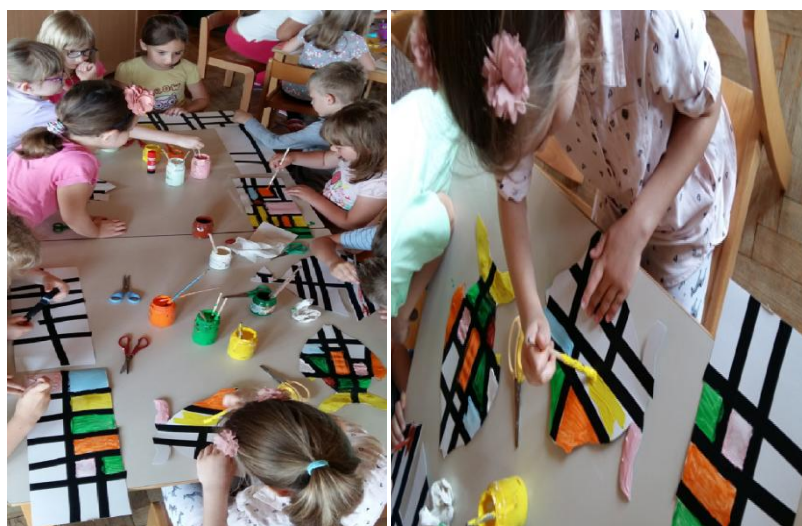
Slika 18. Tijek procesa, tempera