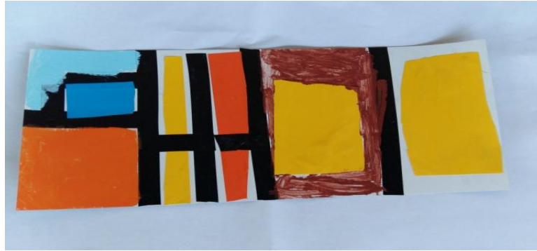
Slika 22. Djevojčica I.S. „Ja sam koristila i kolaž papir i temperu tako da moj rad bude drugačiji.“