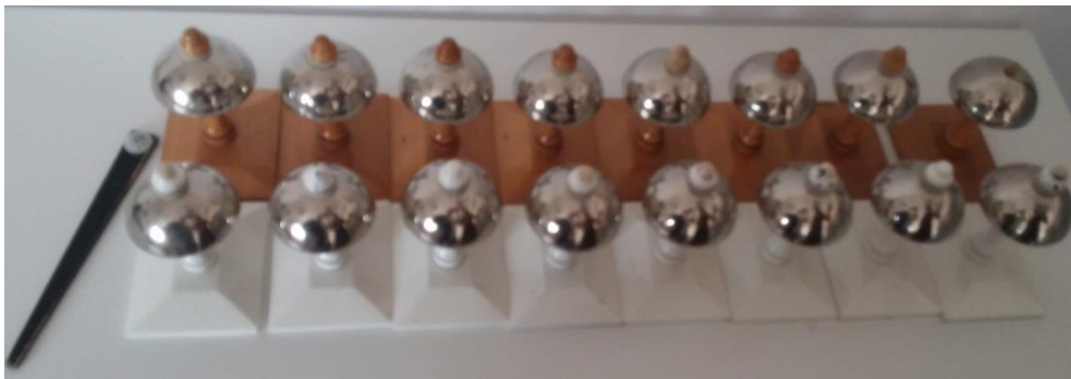
Slika 4. Montessori zvona

Nastoji se pjevati što češće i u tu aktivnost uključiti svu djecu. Također, u svim skupinama koriste se glazbeni instrumenti kao što su: razne vrste udaraljki, trijangleri, bubanj, gong, metronom, činele, Montessori zvona i tzv. „Kiša“. Kiša je cijevasti instrument u kojem se nalaze prepreke kroz koje prolazi sitni materijal koji proizvodi zvuk kada se instrumentu promjeni položaj. Zove se Kiša jer zvuk koji proizvodi ovaj instrument zvuči kao udaranje kapljica kiše po čvrstoj površini.