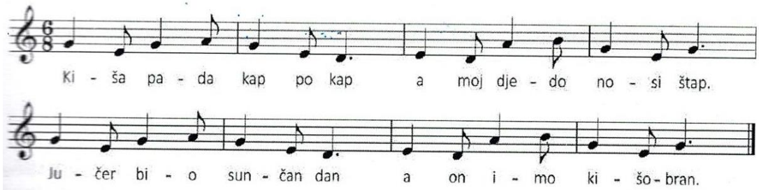
Slika 3. Notni zapis pjesme „Kiša pada“ koja se pjeva u jasličkoj skupini u sklopu projekta „Jesen“

Nastoji se pjevati što češće i u tu aktivnost uključiti svu djecu. Također, u svim skupinama koriste se glazbeni instrumenti kao što su: razne vrste udaraljki, trijangleri, bubanj, gong, metronom, činele, Montessori zvona i tzv. „Kiša“. Kiša je cijevasti instrument u kojem se nalaze prepreke kroz koje prolazi sitni materijal koji proizvodi zvuk kada se instrumentu promjeni položaj. Zove se Kiša jer zvuk koji proizvodi ovaj instrument zvuči kao udaranje kapljica kiše po čvrstoj površini.