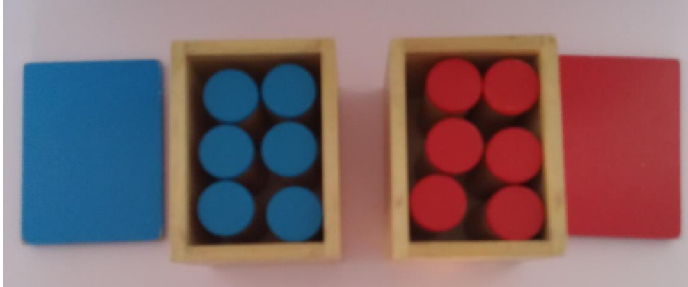
Slika 5. Drvena kutija s valjčićima u kojima je različita količina graha

Vježbe se izvode po knjizi mr. sc. Valerije Majsec Vrbanić, Slušamo pjevamo plešemo sviramo . Također se slušaju izabrana djela poznatih svjetskih autora, a nekada ona budu tiha pozadina za rad. Odgojiteljica ističe kako pripremljena okolina kao jedno od načela Montessori pedagogije podrazumijeva da se u svakoj skupini nalaze odmah dostupni instrumenti što znatno olakšava bavljenje glazbenim aktivnostima. Načelo discipline se također primijeti u tijeku samoga rada kada djeca strpljivo čekaju red, što je vrlo bitno kada se glazbena aktivnost provodi uz pomoć glazbala u skupini.