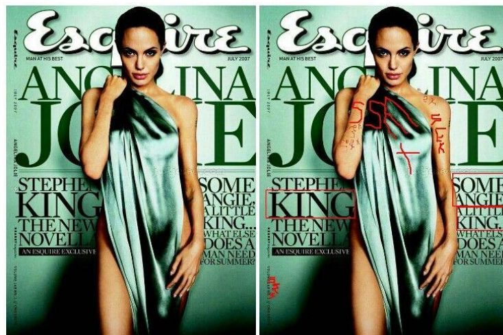
Slika 3 . Naslovnica časopisa Time sa subliminatima sex