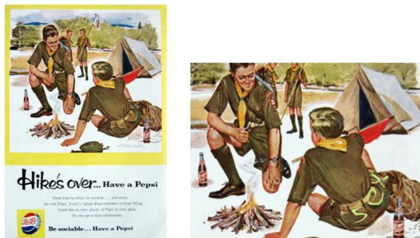
"Be Sociable" by Pepsi.