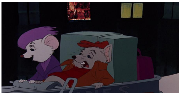
Slika 4 . Prikaz primjera iz animiranog filma ' The Rescuers'

O čemu se točno radi valja isčitati iz primjera koji slijede. „Crtana uspješnica ‘Spasitelji’ (engl. ‘The Rescuers’) animirani je film iz 1977. godine, dvadeset i treći po redu. Iako smo svi u djetinjstvu gledali taj uradak, danas je najpoznatiji po kadru u kojem se prsata gospodična presvlači pred otvorenim prozorom. Ta ‘pogreška’ uočena je tek 1999. godine, te je iz prodaje povučeno 3.4 milijuna kopija videokazeta zbog ogromnog pritiska javnosti. Problem je bio taj što je frame iznosio tek 1/30 sekunde i bio je neuočljiv svjesnoj percepciji te je spadao u domenu polulegalnih subliminala. Produkcija je priznala sporne kadrove, no ne i tko je iste implementirao u video, a istraga nikada nije pokrenuta“ (Martinović, https://blog.vecernji.hr/ratko-martinovic/okultni-crtani-filmovi-1-gledaju-li-vasa-djeca-skrivene-poruke-pornografije-i-sotonizma-3978 , 23.8.2018).