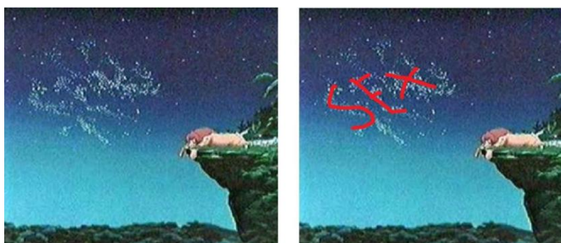
Slika 7 . Prikaz primjera iz animiranog filma 'Kralj lavova'

(izvor: https://www.pinterest.com/pin/422071796312596551/ , 23.08.2018)