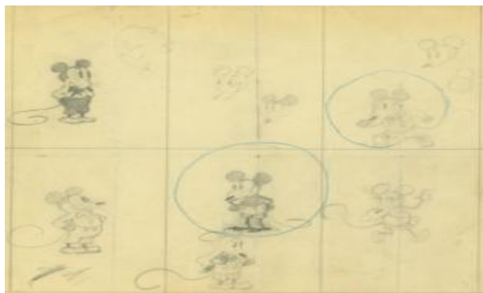
Slika 1. Prvi nacrti Mickeya Mousea