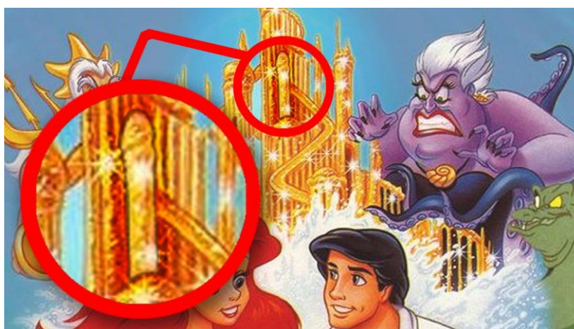
Slika 5 . Prikaz primjera iz animiranog filma ' Mala sirena'