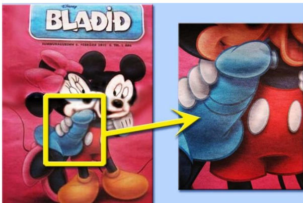
Slika 10. Prikaz slike 'Mickey i Minnie'