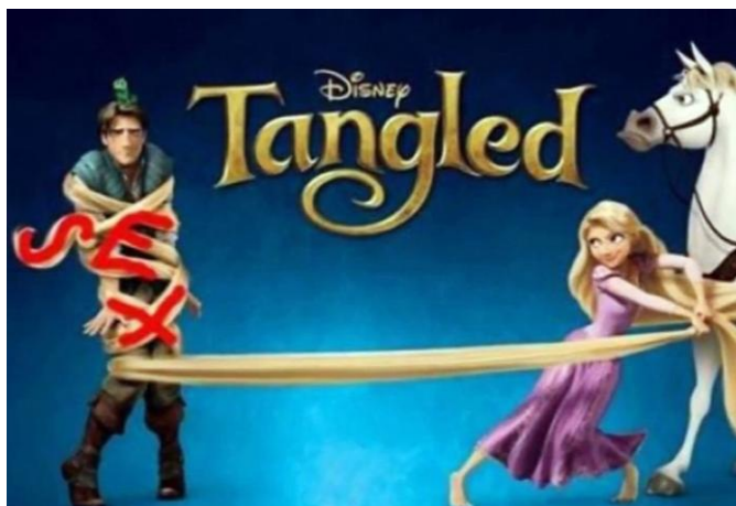
Slika 6 . Prikaz primjera iz animiranog filma ' Tangled'