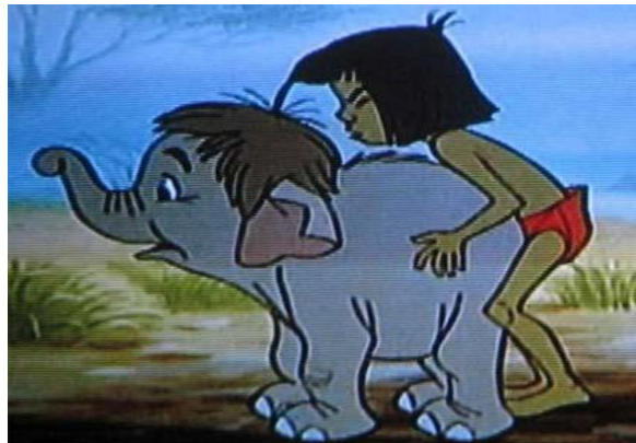
Slika 9 . Prikaz scene sa 'Mowglijem i slonom'