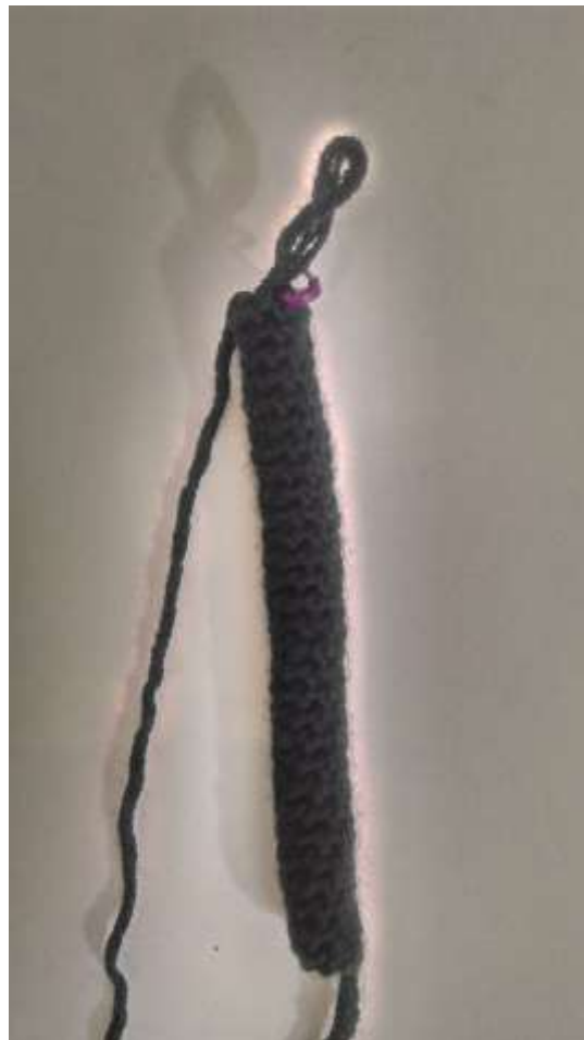
Slika 12 Prva noga