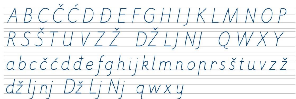
Slika 2. Školsko formalno koso pismo

Slično je i s inačicama rukopisnoga kosog pisma, također postoje dvije – velika rukopisna slova i mala rukopisna slova. Definirana su kao slova namijenjena stvaranju osobnoga rukopisa te ga je važno prilagoditi dječjoj anatomiji, objašnjava Reberski (2014).