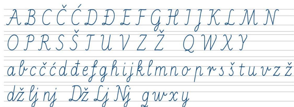
Slika 3. Školsko rukopisno koso pismo

Slično je i s inačicama rukopisnoga kosog pisma, također postoje dvije – velika rukopisna slova i mala rukopisna slova. Definirana su kao slova namijenjena stvaranju osobnoga rukopisa te ga je važno prilagoditi dječjoj anatomiji, objašnjava Reberski (2014).