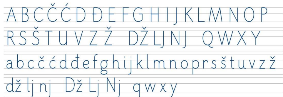
Slika 1. Školsko formalno uspravno pismo

Formalno uspravno pismo služi početnom učenju čitanja i pisanja te se manifestira kroz dvije inačice, a to su velika formalna slova i mala formalna slova.