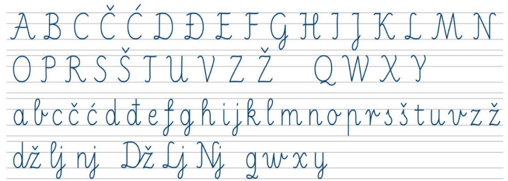
Slika 4. Školsko rukopisno uspravno pismo

Reberski (2014) predlaže grafitnu olovku kao najadekvatniju pisaljku za početak učenja pisanja slova.