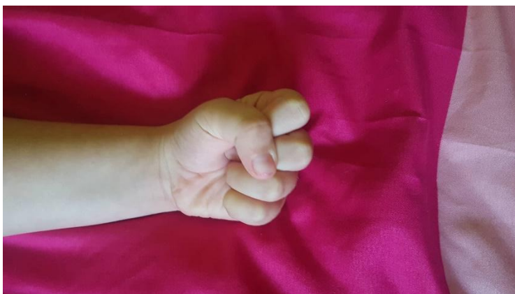
Slika 19 Slika ruke