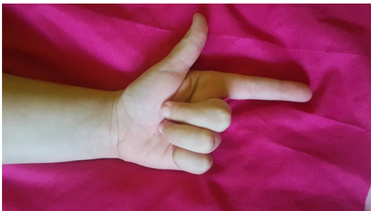
Slika 17 Slika ruke