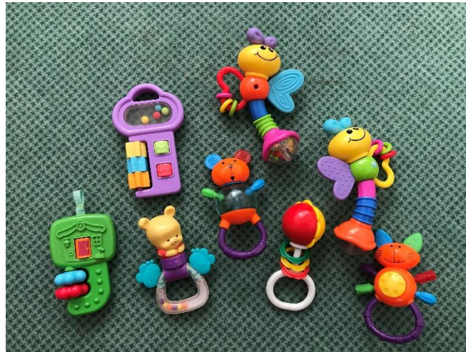
Slika 3. Prikaz zvečki

One su smještene na polici između centra za građenje i obiteljskog centra. Velik broj tih igračaka trebao bi raditi na baterije ali u većini igračaka baterija nije bilo. Tako mala plastična gitara i radio ne rade. Djeca su svjesna da dugmad na igračkama nečemu služi i da će se pritiskom na dugme nešto dogoditi. Ukoliko se ništa ne dogodi, taj predmet djetetu najčešće više neće biti zanimljiv. Kod djeteta rane dobi "neispravnost" igračke lako može izazvati osjećaj frustracije, pogotovo ako je igračka jučer radila, a danas više ne radi. Bitno je paziti na ovakve stvari jer su takve igračke namijenjene tome da dijete osjeti zvukovni podražaj nakon pritiska na dugme.