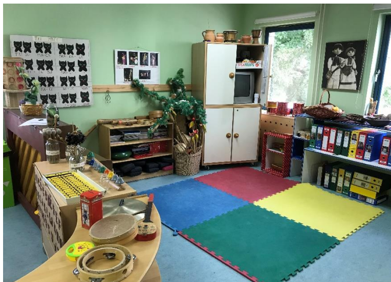
Slika 10. Prikaz glazbenog centra skupine "Zvezdice"