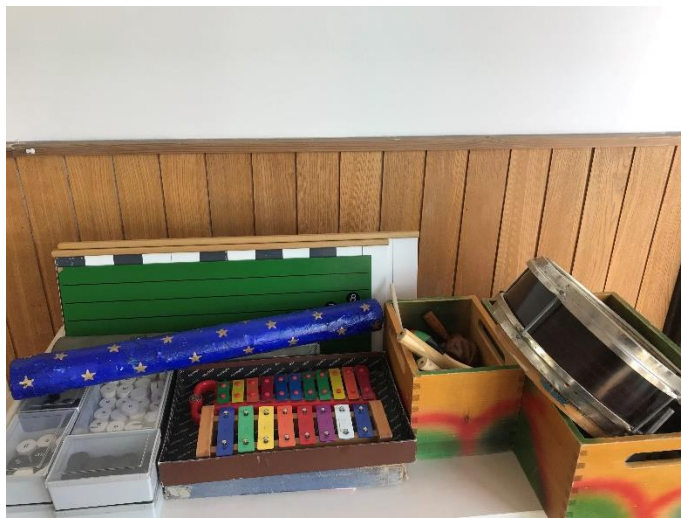
Slika 13. Prikaz instrumenata u skupini "Ribice"

Mješovita odgojno-obrazovna skupina "Ribice" skupina je koja temelji svoj rad na Montessori programu stoga se pri samom ulasku u grupu vidi da djeca sjede na malim tepisima i da se svako dijete bavi određenom aktivnošću (pretakanjem vode iz čaše u čašu kapaljkom, prijenos pijeska iz kutije u čašu uskog grla...). Na samom kraju skupine nalazi se maleni glazbeni centar sa ksilofonima (x2), metalofonima (x2), velikom zvečkom, defovima (x2), štapićima (x2), zvečkama (x5), trokutićima (x3), kastanjetama (x4) i praporcima (x2) te velikom pločom na kojoj je ucrtano crtovlje na koje se mogu staviti tonovi u obliku kuglica koje se nalaze u kutiji sa strane. Osim toga, u skupini se nalazi i sintetizator zvuka. Ribice najviše njeguju aktivnosti u krugu pa se sukladno tome najčešće bave obradom pjesme i igrama s pjevanjem.