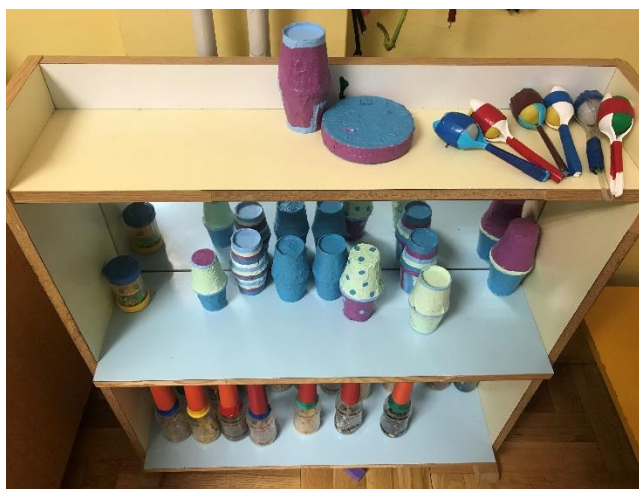
Slika 2. Prikaz zvečki izrađenih od strane odgojitelja

Na drugom ormaru većinom su smještene zvečke. Na svakoj od polica jedna je vrsta zvečki te su sve izrađene od strane odgojitelja. Čvrste su, estetski privlačne te zaobljenih rubova kako se dijete ne bi ozlijedilo. Na donjoj polici ponovno bočice, no ovaj put sa crvenim plastičnim držačem. Kao i bočice na drugom ormaru, ove su napunjene materijalima koji su vidljivi (cornflakes, lan, tjestenina, kestenje...). Na srednjoj polici također ponovno slagarica od kaširanih čaša (x10), dvije duguljaste zvečke izrađene od kartona te, djeci vrlo zanimljive i lake za uporabu, plastične zvečke od žlica i kutijice u sredini koja je napunjena materijalima. Ove su zvečke vrlo praktične, lagano ih je držati u ruci (s obzirom da jaslčari imaju sitne dlanove) pa ih sukladno tome djeca stalno koriste. Dakle, sviranje na udaraljka je aktivnost koja se najčešće provodi u ovoj skupini sukladno materijalnoj opremljenosti (većinu instrumenata čine zvečke).