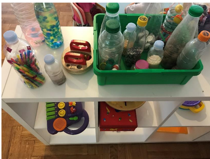
Slika 11. Prikaz bočica s materijalima u skupini "Leptirić"

Mlađa odgojno obrazovna skupina "Dunje" većinu svojih instrumenata smjestila je u džepove sašivene na tkaninu. U njima se nalazi deset štapića, tri defa, osam različitih zvečki i pet kastanjeta s drškom. Na ormariću pored leže ksilofon, osam činela i košarica s raznim sitnim instrumentima. Na zidu su nalijepljeni mali plakati s pjesmicama i brojalicama uz crteže (Pi, pi pi, Pliva patka i Iš, iš, iš). Najvažniji instrument u ovoj skupini je harmonika koju svira odgojiteljica i nju pretežito koristi u radu s djecom i glazbenom odgoju.