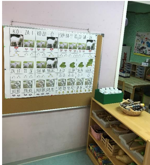
Slika 8. Prikaz glazbenog centra skupine "Mace"

Najzanimljivija je glazbena torba koja je popunjena instrumentima. Radi se o dvadeset i dva štapića, devet trokutića, dvije kastanjete, četiri činele i pet malih bubnjeva.