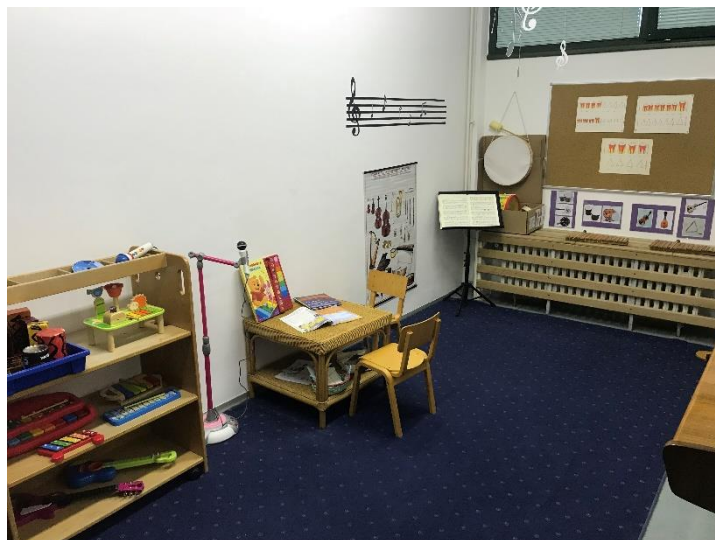
Slika 12. Prikaz glazbenog centra skupine "Trešnjice"