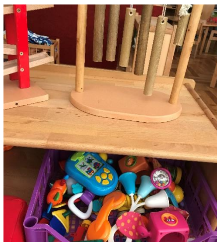
Slika 4. Prikaz bambusovih visilica

Uz "zvukovne" igračake koje u aktivnostima mogu poslužiti kao zvečke na ormaru se mogu pronaći bambusove visilice, no djeca ih jedva mogu dosegnuti rukama.