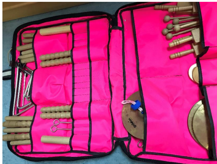
Slika 9. Prikaz "glazbene torbe"

Najzanimljivija je glazbena torba koja je popunjena instrumentima. Radi se o dvadeset i dva štapića, devet trokutića, dvije kastanjete, četiri činele i pet malih bubnjeva.