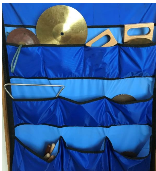
Slika 7. Prikaz tkanine s džepovima u kojima su instrumenti

U dvjema starijim skupinama ne postoje nikakvi materijali vezani uz glazbu osim metalnih visilica u jednoj od skupina.