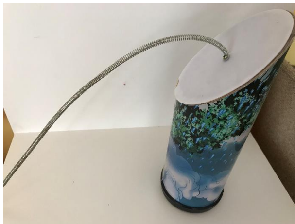
Slika 5. Prikaz instrumenta čiji zvuk oponaša zvuk grmljavine

U prizemlju vrtića nalazi se zanimljiva jaslička skupina u kojoj se nalaze razni poticaji koji podražuju sva djetetova osjetila. Dijete putem osjetila svakodnevno prima informacije koje se obrađuju u mozgu i na taj način uči. Zbog toga su pokret, glazba, pjevanje i ples neizostavan dio djetetova odrastanja. Ova skupina zaista je puna materijala, čak se u sredini prostorije nalazi tobogan koji vodi do bazena s lopticama u kojeg se djeca mogu spuštati. Prvo što se zamjećuje je gitara koja je pravo osvježanje s obzirom da odgojitelji, ako uopće sviraju, većinom sviraju klavir. U razgovoru s odgojiteljicom saznaje se da gitara najviše služi kao priprema za jutarnju tjelovježbu koja se svakodnevno provodi na tepihu. Ona također daje informaciju o učestalom održavanju radionica, posebno onih za izrađivanje glazbenih instrumenata. Pokraj ulaza vidljiv je mali glazbeni centar u kojem se može pronaći ksilofon, plastični def, dječji sintetizator zvuka, 30ak različitih vrsta udaraljki (najviše zvečke i štapići), instrument koji u sebi sadrži ksilofon i tri materijala pričvršćena na veliko drvo itd. Ono što je u ovoj skupini najzanimljivije to je instrument koji proizvodi zvuk sličan grmljavini stoga se može koristiti u raznim igrama oponašanja oluje.