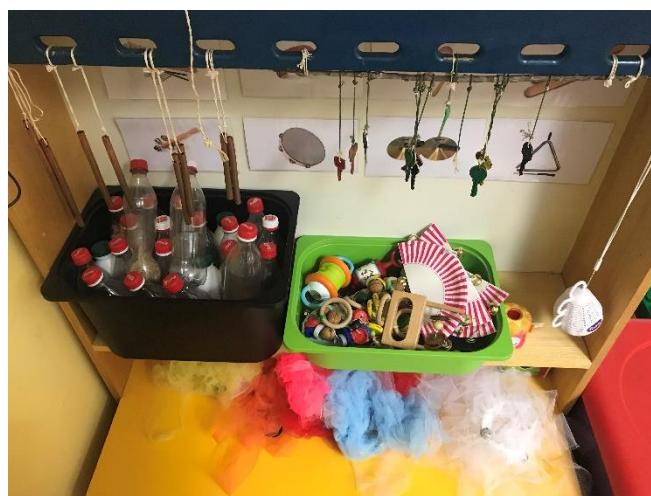
Slika 1. Prikaz visilica, zvečki, bočica, suknjica i fotografija