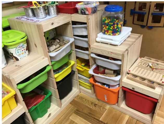
Slika 6. Prikaz centra aktivnosti u kojem su smješteni instrumenti

U posljednjoj jasličkoj skupini vlada poprilično oskudna situacija kada se govori o materijalnim uvjetima za provođenje glazbenih aktivnosti. Naime, u ovoj skupini ne postoji glazbeni centar u kojem bi se mogli pronaći instrumenti. Na početku sobe nalazi se polica na kojoj su smještene plastične kutije u kojima se nalaze predmeti koji nemaju svoje mjesto pa su se našli ovdje. Tako se u jednoj od kutija može pronaći potrgani ksilofon, mali def i tjestenina koja je (prije nego što se potrgala) bila pričvršćena za užu kako bi tvorila zvečku. Na polici se nalaze zvečke izrađene od žlica (kao što je opisano u "Krijesnicama"), oko dvadeset komada te glazbena slagarica. Većina je, dakle, instrumenata smještena na mjesto na koje djeca ne zalaze pa i ono što ova skupina posjeduje biva "sakriveno". Ipak, u ovoj je skupini CD player vrlo bitna stvar jer odgojiteljica obrađuje pjesme zajedno s djecom, no slično kao u prethodno navedenim skupinama, najveći poticaj su tijelo i pokret.