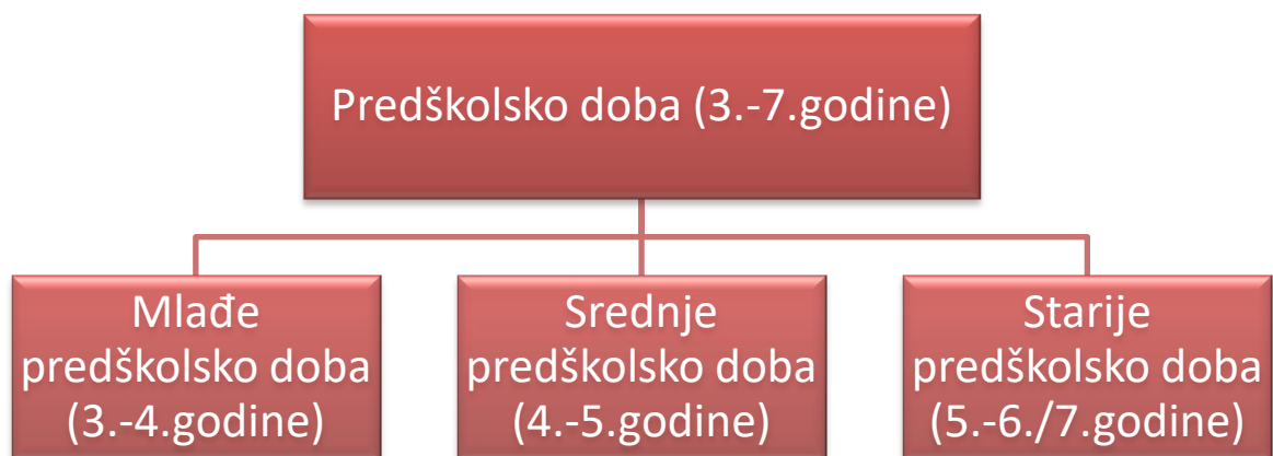
Slika 1. Podjela predškolskog doba (Findak, 1995).

Prethodno navedene granice između pojedinih razdoblja nisu točno određene jer se svako dijete razvija različitom dinamikom. Neki stručnjaci tvrde da navedeni redoslijed jest jednak kod sve djece, ali ono što se zapravo razlikuje je vremensko pojavljivanje i trajanje. Kao dokaz da se djetetov organizam u mnogočemu razlikuje od organizma odraslog čovjeka jest činjenica da se u djetetu predškolske dobi događa više promjena tijekom šest mjeseci, nego kod odraslog čovjeka tijekom 10 godina. Taj veliki broj promjena u malim vremenskim razdobljima zasnivaju se na povezanosti sustava antropološkog statusa djeteta. Odnosno jedan antropološki sustav prilikom razvijanja utječe na razvojne promjene u drugim sustavima. Upravo iz tog i drugih sličnih razloga se djetetov razvoj smatra toliko jedinstvenim i nerazlučivim (Neljak, 2009).