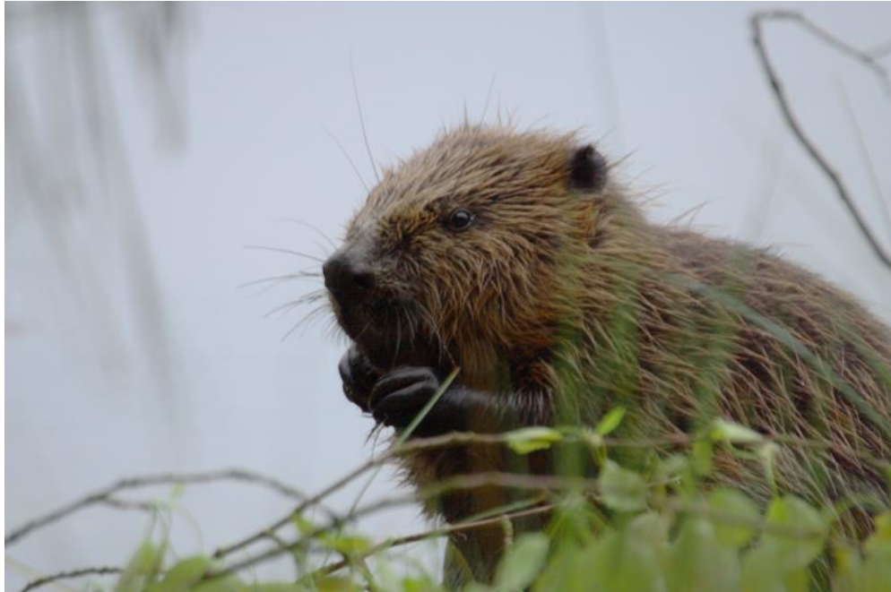
Slika 2. Europski dabar ( Castor fiber )