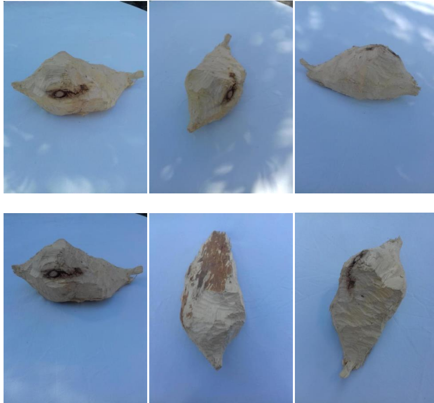
Slika 4. Izglodano stablo