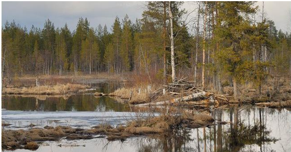
Slika 6. Stanište zimi