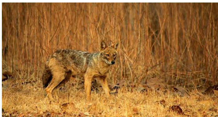
Slika 9. Čagalj ( Canis aureus L.)

Bokovi i bedra su svjetlije rumene do prljavo-žute boje, dok su trbuh i unutrašnje strane nogu svjetlije sivo-bijele boje (Tóth i sur., 2010). Boja krzna čagljeva koji obitavaju na području Hrvatske je najčešće smeđe-žuto-zlatna. U močvarnim i ravničarskim područjima je češće žuto-smeđa, dok je u primorskim i brdskim krajevima zlatno-žuta i smeđe-siva.