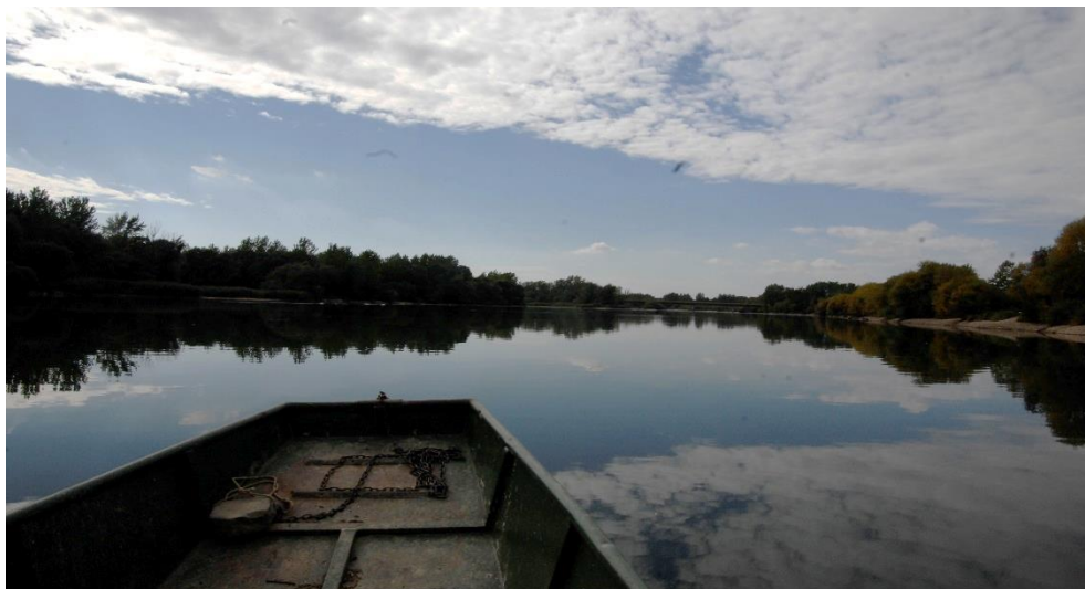
Slika 7. Stanište dabra na rijeci Dravi kod Preloga