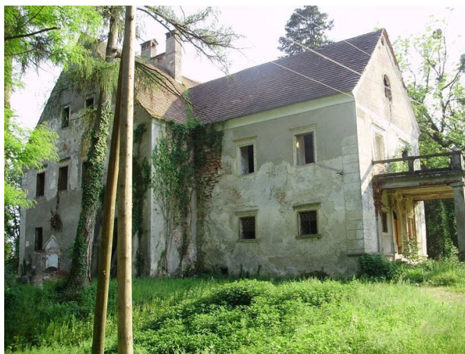
Slika 4. Današnji izgled dvorca Križovljan Grad, spomenika kulture 2. kategorije