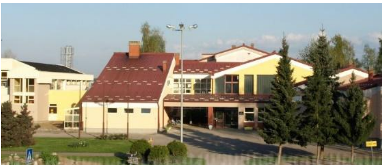
Slika 12. Osnovna škola Cestica

Izvor: http://www.frano.tv/wp-content/uploads/2016/02/os_cestica.jpg (4.8.2016.)