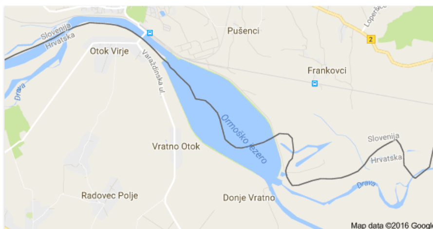
Slika 3. Položaj Ormoškog jezera