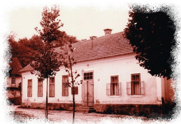
Slika 9. stara škola u Radovcu