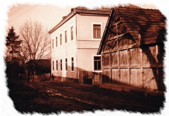
Slika 10. katnica u Radovcu

Dvogodišnjom postaje škola 1876. kada je u blizini izgrađena nova školska zgrada na kat, s dvije učionice i dva učiteljska stana (danas je na njenom mjestu trgovina), a stara je zgrada napuštena.