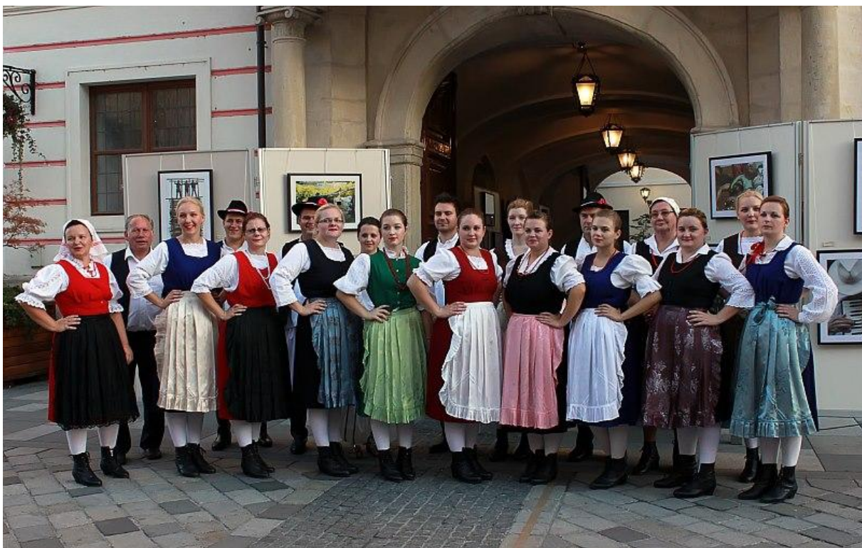
Slika 14. KUD Cestica