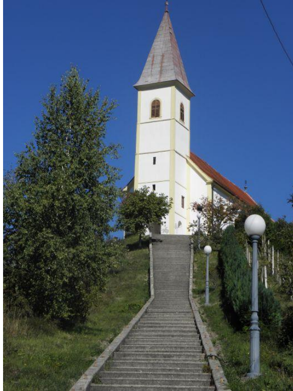
Slika 7. Crkva Sv. Barbare u Natkrižovljanu

Dravi. Crkva je barokna, u njoj je poznata drvena pietà – Majka Božja s mrtvim Isusom u naručju – napravljena po Michelangelovom uzoru i izrezbarena od jednog komada drva. 16