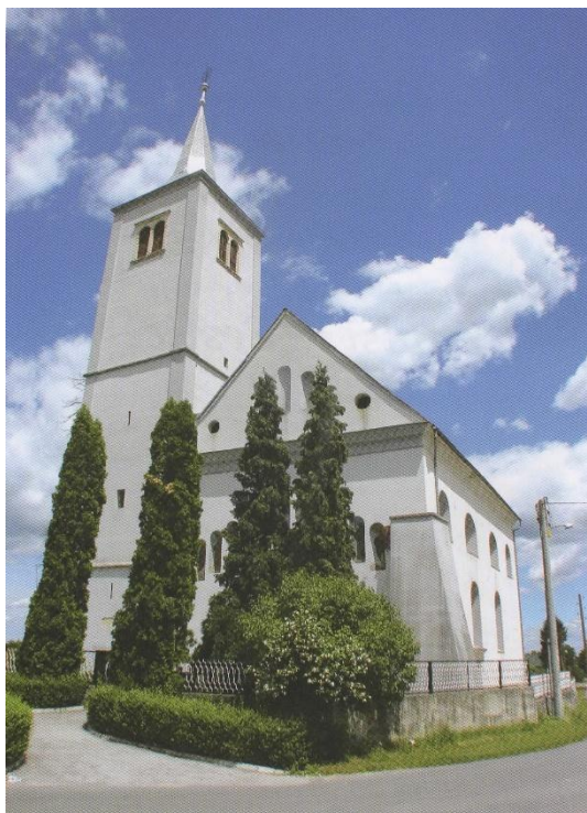
Slika 6. Crkva Uzvišenja Sv. križa u Radovcu