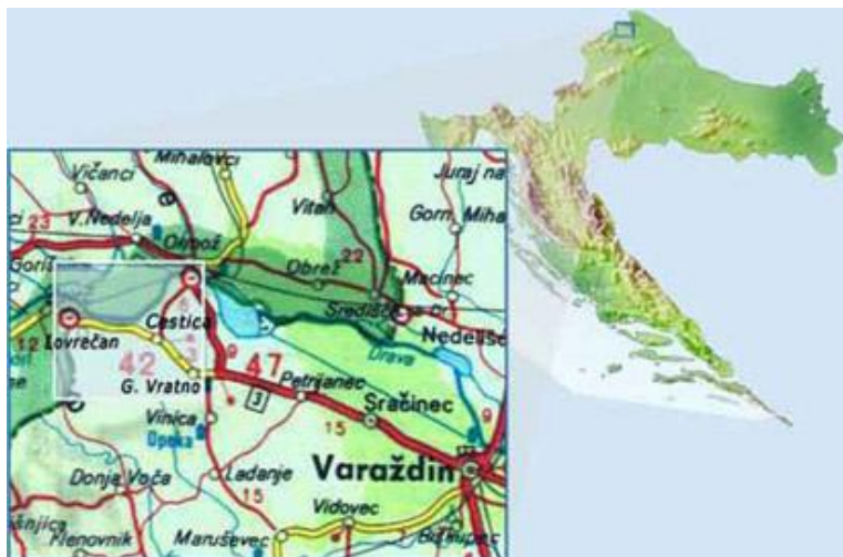
Slika 1. Zemljopisni položaj općine Cestica