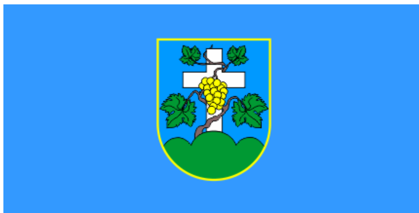
Slika 13. Zastava s grbom općine Cestica