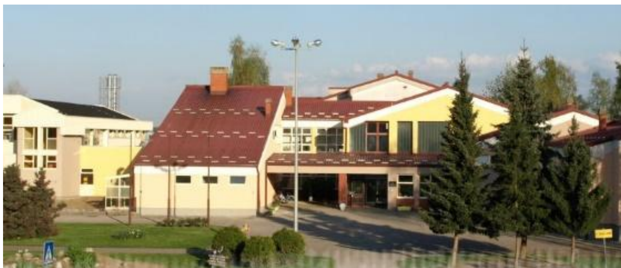
Slika 12. Osnovna škola Cestica

Izvor: http://www.frano.tv/wp-content/uploads/2016/02/os_cestica.jpg (4.8.2016.)