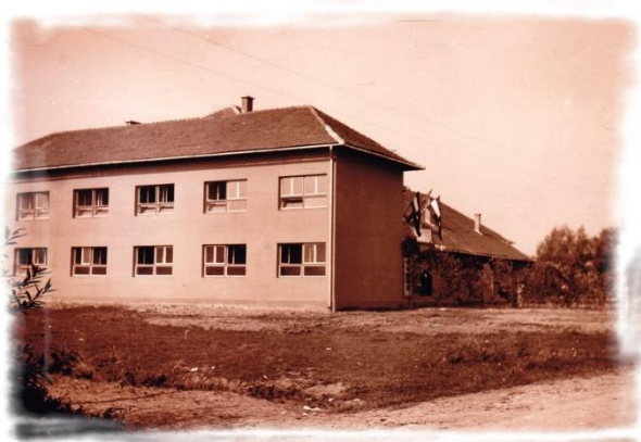
Slika 11. Osmogodišnja škola Babinec