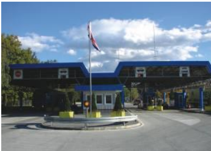
Slika 2. Granični prijelaz Dubrava Križovljanska

svoja dva međunarodna granična prijelaza prema Republici Sloveniji: Dubrava Križovljanska – Zavrč i Otok Virje – Ormož. Prema statističkim podacima granični prijelaz Dubrava Križovljanska- Zavrč godišnje prijeđe oko 2,5 milijuna domaćih i stranih putnika, a kroz granični prijelaz Otok Virje- Ormož godišnje prijeđe nešto manje od milijun putnika. 3