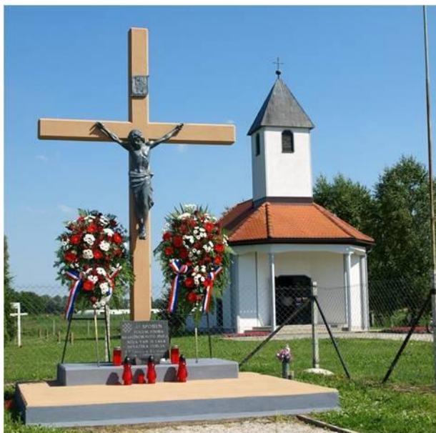
Slika 5. Spomen križ u Virje Otoku, u pozadini spomen kapelica posvećena kardinalu Alojziju Stepincu