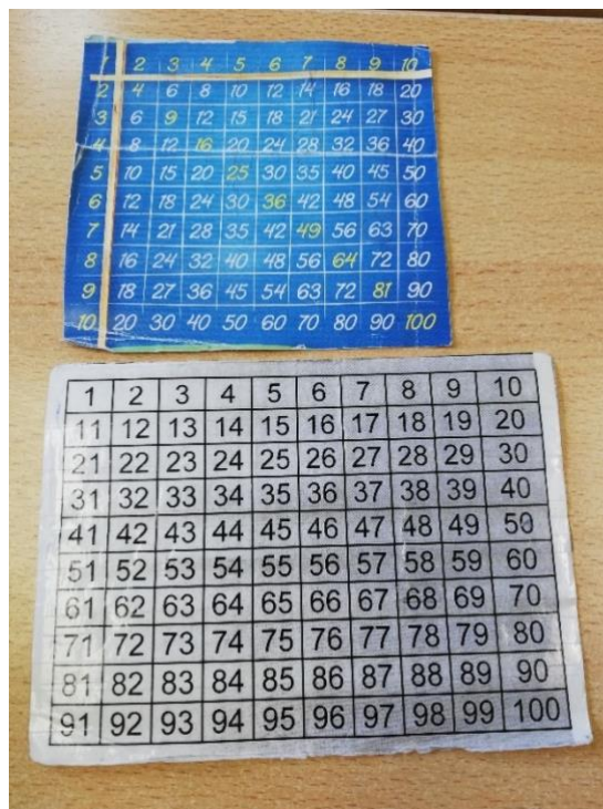
Slika 1: Nastavna sredstva koja učeniku pomažu u rješavanju matematičkih zadataka zbrajanja i množenja

Učeniku je, sukladno načelima individualiziranog pristupa, dopušteno korištenje svih nastavnih sredstava koja mu mogu pomoći, npr. tablice množenja, kalkulatora itd. i koja mu pomažu da bude što samostalniji u rješavanju zadataka (Slika 1).