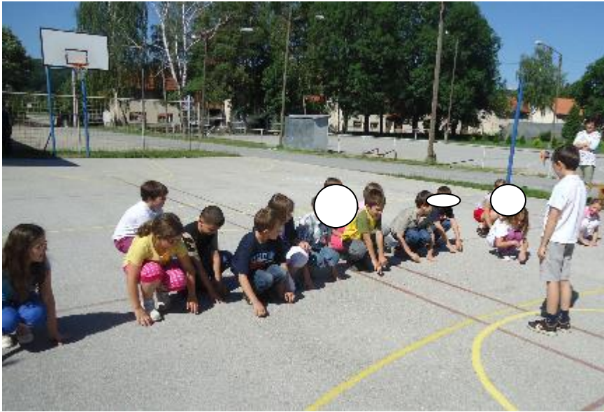
Slika 4. Igra „Care, care, gospodare“