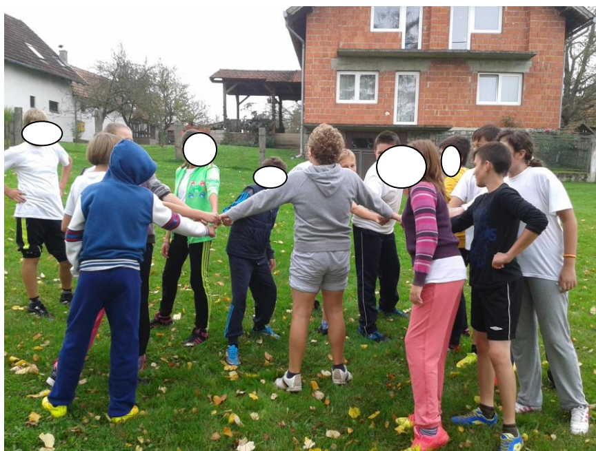
Slika 2. Igra „Ledena baba“