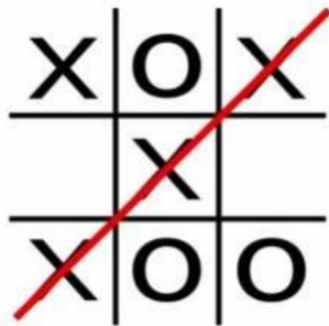
Slika 5. Igra „Križić, kružić“ i „Vješala“