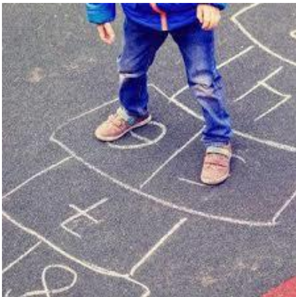
Slika 6. Igra „Školica“