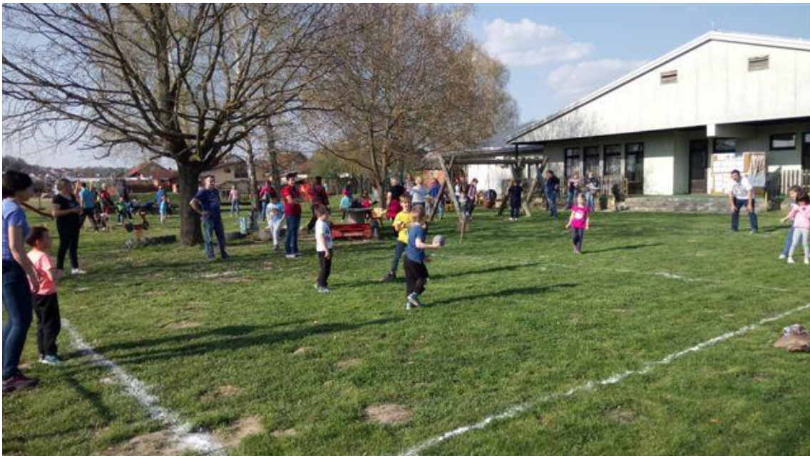
Slika 1. Igra „Graničar“