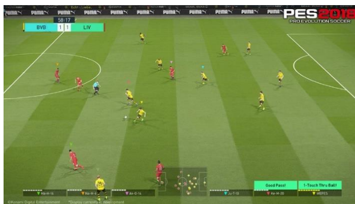
Slika 12. Igra Pro Evolution Soccer, izvor: Konami, preuzeto s https://www.konami.com/wepes/2018/eu/en/topic/new_feature_3 (12.6.2019.)

Sportske igre i naslovi sportske tematike izloženi su najvećem broju promjena u smislu kozmetičkih nadogradnji pa tako svaka nova verzija izgleda sve realističnije ili u smislu prelaska na novu konzolu (HCL Gaming Portal, 2019). Sportskim igrama cilj je simulacija određenog realnog sporta poput nogometa, košarke, skateboarding-a ili nekog drugog sporta. Neki od najpoznatijih naslova u ovoj kategoriji su FIFA , Tony Hawk , Wii Sports , Pro Evolution Soccer i mnoge druge.