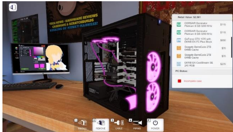
Slika 22. Igra PC Building Simulator