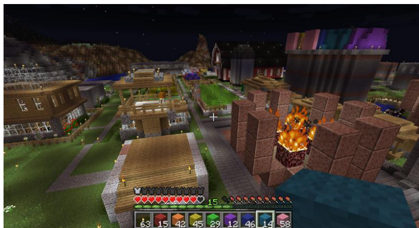
Slika 20. Igra Minecraft