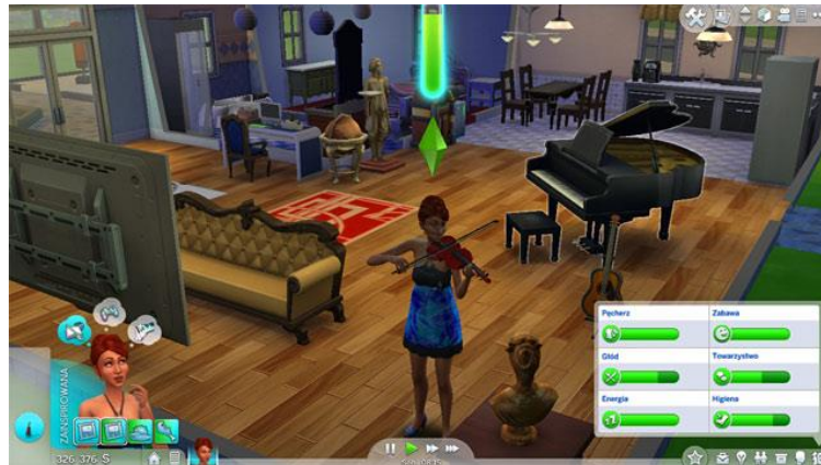
Slika 13. Igra The Sims, izvor: Gamepressure, preuzeto s https://guides.gamepressure.com/thesims4/guide.asp?ID=27383 (12.6.2019.)

U igrama simulacija kao što već i naziv govori simulira se određeni aspekt stvarnoga života pa tako postoji simulacija apsolutno svega, od simulacija života, simulacija vožnje kamiona, auta ili aviona, simulacija sastavljanja računala ili pljačkanja kuća po susjedstvu. Najpoznatiji serijali ovog tipa igara su The Sims serijali, Euro Truck Simulator, SimCity, Thief simulator, PC building simulator i dr.