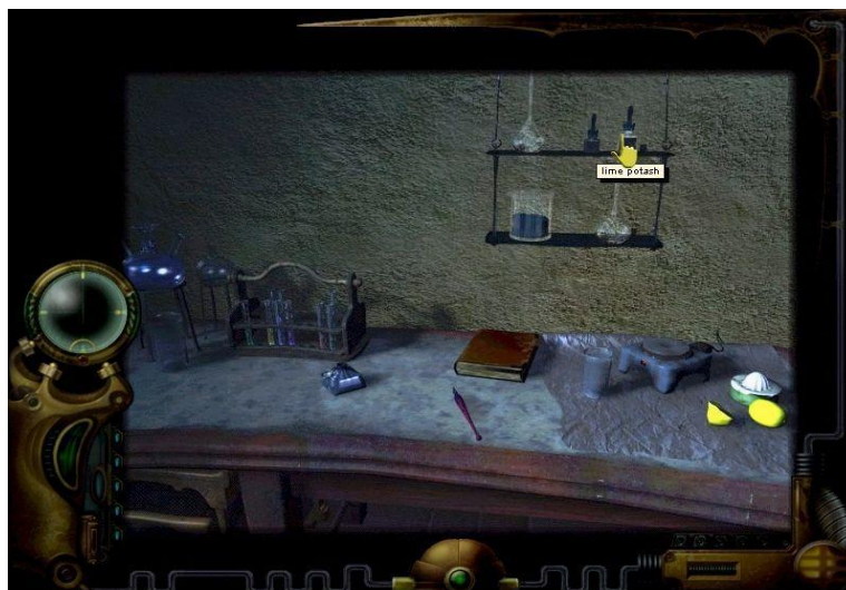
Slika 17. Igre Chemicus