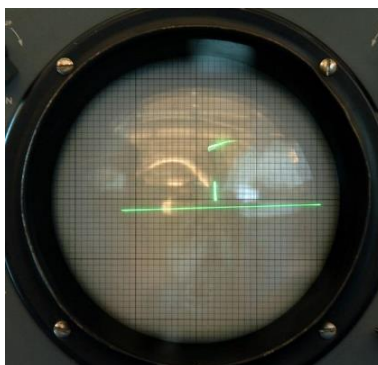
Slika 1. Igra Tennis for Two, izvor: Computer history, preuzeto s https://www.computerhistory.org/revolution/computer-games/16/187/778 (12.6.2019.)