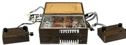
Slika 3. The Brown Box

Početakom 70-ih godina prošlog stoljeća počele su se proizvoditi i prve igraće konzole što je prouzrokovalo porast broja igara i njihovih proizvođača. Ovo desetljeće označavalo je rođenje video igara kao industrije i napravilo je put za razvoj igračih konzola sličnih onima koje koristimo danas. 1967. godine developeri Sanders Associates-a izradili su prototip igraće konzole koja se mogla spojiti na televiziju zvane The Brown Box. Konzola je sadržavala nekoliko jednostavnih igara kao što su tenis, odbojka, stolni tenis i šah (History, 2019).