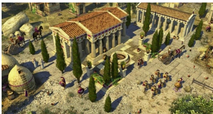
Slika 15. Igra Age of Empires, izvor: Strategygamer, preuzeto s https://www.strategygamer.com/articles/age-of-empires-4-0-ad-game/ (12.6.2019.)