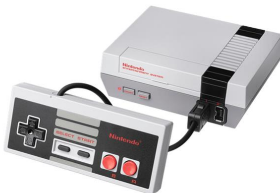
Slika 5. Nintendo Entertainment System igraća konzola