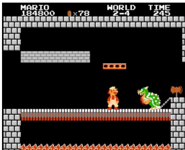
Slika 8. Igra Super Mario

Žanr akcijskih igara u sebi ima i nekoliko pod-žanrova među kojima su igre pucanja iz oružja (eng. Shooter games), borilačke igre (eng. Fighting games), igre igranja uloga (eng. Role-playing games) i igre preživljavanja (eng. Survival games). Najpoznatija akcijska igra svih vremena je Super Mario.