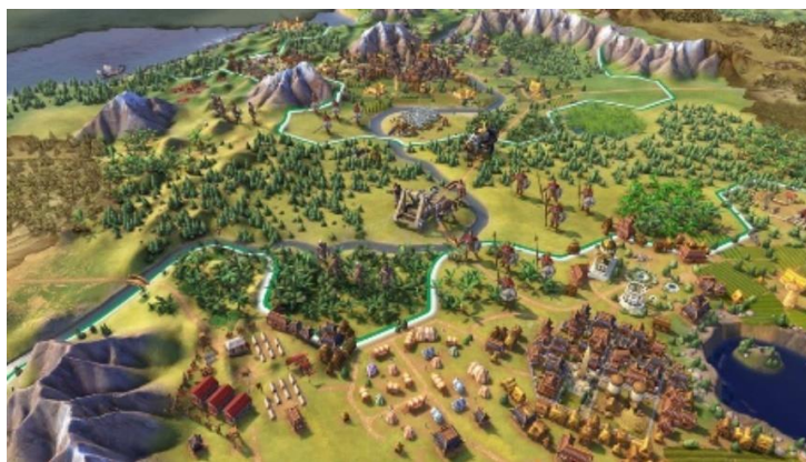
Slika 14. Igra Civilization