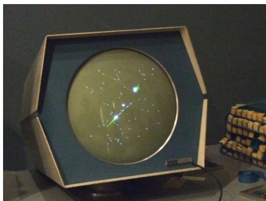
Slika 2. Igra Spacewar