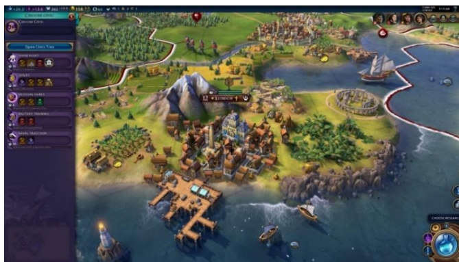
Slika 18. Igra Civilization