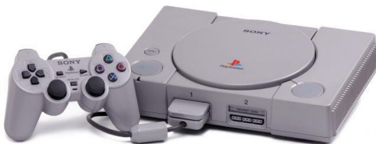
Slika 6. Sony Playstation 1 igraća konzola, izvor: Gameswelt, preuzeto s https://www.gameswelt.de/playstation/special/wie-alles-begann,233014 (12.6.2019.)

Pojavom 3D grafike javljaju se nove igre s elementima različitih žanrova poput akcijski i avanturističkih. Neke od igara koje su postale popularne u ovo doba su Half-Life, Mortal Kombat, Baldur's Gate, Warcraft, Star Craft i Tomb Raider, čiji je glavni lik Lara Croft postala prepoznatljiva ženska figura sve do danas.