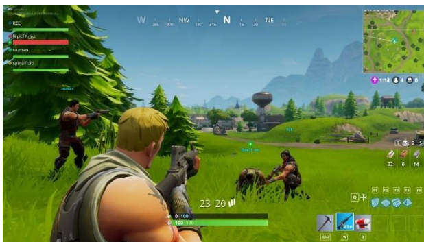
Slika 10. Igra Fortnite

Poznati naslovi iz ovog žanra su svakako Resident Evil i Silent Hill. U novije vrijeme pojavio se i tzv. Battle Royale survival, a radi se o konceptu igara gdje više igrača s minimalnim resursima i ikakvog oružja dolazi na veliku mapu kojoj se teritorij s vremenom smanjuje, na kojoj moraju preživjeti kroz istraživanje i stvaranje oružja kako bi porazili protivnike. Pobjednik je onaj koji zadnji ostane živ. U igre preživljavanja (eng. Survival igre) ubrajamo naslove poput Minecrafta, The Forest, Day Z, a najpoznatije Battle Royale igre su Player Unknown's Battlegrounds, Fortnite i Apex Legends.