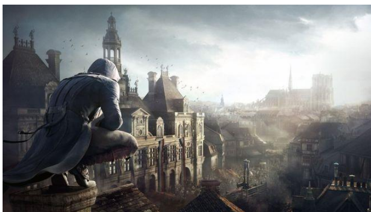
Slika 16. Igra Assassin's Creed