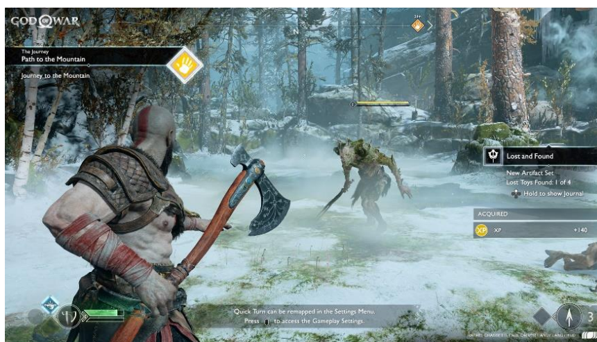
Slika 19. Igra God of War, izvor: Artstation, preuzeto s https://www.artstation.com/artwork/xgoQ2

Mitologija je često vrlo zahtjevno područje u sustavu obrazovanja koje se obradi samo površinski. Pogotovo iz razloga jer je puno knjižnih izvora, verzija svakog pojedinog mita, a i mitologije poput grčke, rimske ili nordijske se još same po sebi vrlo razlikuju. Zbog svog smještaja u fantastičan svijet, nordijska mitologija je teška za vizualiziranje, no tome vrlo dobro doskače igra God of War. Iako se zbog svog nasilnog sadržaja, scena borbe i oružja ne može koristiti u učionici, ova igra učenicima može približiti svjetove grčke i nordijske mitologije te pobuditi zanimanje za njihovo daljnje istraživanje.