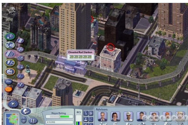
Slika 21. Igra The SimCity