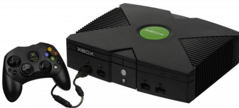
Slika 7. Microsoft Xbox igračka konzola

Najpopularnije i najprodavanije igre početkom 2000-ih godina su Final Fantasy XII, The Elder Scrolls IV, God of War, Mass Effect, Metal Gear Solid 2, World of Warcraft i The Sims koji je tada bio proglašen najprodavanijom igrom svih vremena.