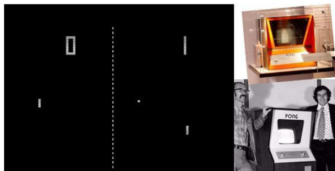
Slika 4. Atari Pong igraća konzola i video igra, izvor: Sound and Vision, preuzeto s https://www.soundandvision.com/content/flashback-1972-atari-tests-pong (12.6.2019.)