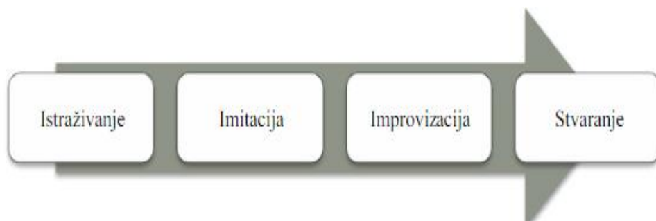
Slika 2. Faze dječjega glazbenoga razvoja u koncepciji Orff Schulwerk

Kao temelj glazbenog razvoja kod djece uzima se osjećaj za ritam koji se usvaja upravo izvedbom i nesputanom improvizacijom ritma na raznim udaraljka. To istraživanje zvuka i pokreta je prva faza glazbenog razvoja nakon koje slijedi faza imitacije. U toj fazi djeca razvijaju vlastite ritamske vještine ritmiziranim govorom, uporabom tijela kao instrumenta (pucketanje prstima, pljeskanje i sl.), slobodnim ili ritmiziranim tjelesnim pokretom u prostoru, pjevanjem te sviranjem instrumenata. Treća faza obilježena je improvizacijom u kojoj su djeca već samostalna i sposobna kreirati nove obrasce te ih kombinirati i integrirati u grupne aktivnosti. Zadnju fazu čini spoj usvojenih vještina iz prethodnih faza koje rezultiraju dječjim stvaralaštvom tako da se stvaraju nove male forme poput rondo, teme s varijacijama ili manjih suita (Svalina, 2010, prema Shamrock, 1997).