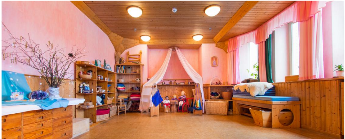
Slika 3 : Interijer waldorfskog vrtića 5

Koncept waldorfskog vrtića je takav da nema klasičnog plana i programa, a osnovni principi odgojitelja u waldorfskom vrtiću su ritam i ponavljanje te primjer i oponašanje. Glavna misao vodilja je težnja za usklađivanjem djetetova duhovnog i zemaljskog dijela, pružajući mu veću slobodu u odgoju. Umjesto klasičnog plana i programa, tijekom pedagoške godine u waldorfskim vrtićima temelji se na ritmu povezanom s izmjenom godišnjih doba, a sastoji se od proljetnog, ljetnog, jesenskog i zimskog ciklusa. Također, bitnu ulogu u waldorfskom programu ima i obilježavanje važnih datuma kroz godinu. Ti datumi kroz godinu podrazumijevaju različite svetkovine u navedenim ciklusima. Osim navedenog, sklad planu i programu daje povezanosti između izmjene doba dana i izmjenom dana u tjednu.